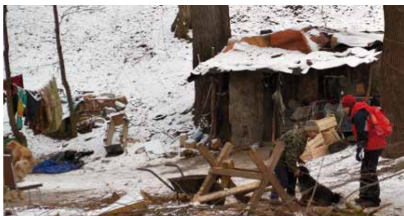
Polovina osob bez domova pomoc odmítá a tráví čas v improvizovaných přístřeších.

V roce 2018 byly uvedené sociální služby (azylové domy, noclehárny, domovy se zvláštním režimem a nízkoprahová denní centra) podpořeny z rozpočtu města v celkové výši 17,7 milionu korun. Pro rok 2019 se znovu počítá s obdobnou částkou. (avp)