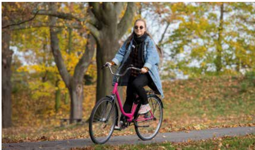
Bikesharing si v Ostravě našel mnoho příznivců.