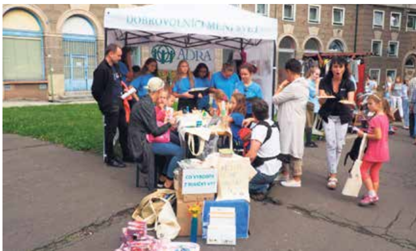
Stánek dobrovolnického centra ADRA.

Za 10 let působení v Ostravě Dobrovolnické centrum ADRA navázalo spolupráci se všemi ostravskými nemocnicemi, s 13 domovy pro seniory, třemi organizacemi podporujícími lidi se zdravotním postižením, Mobil-