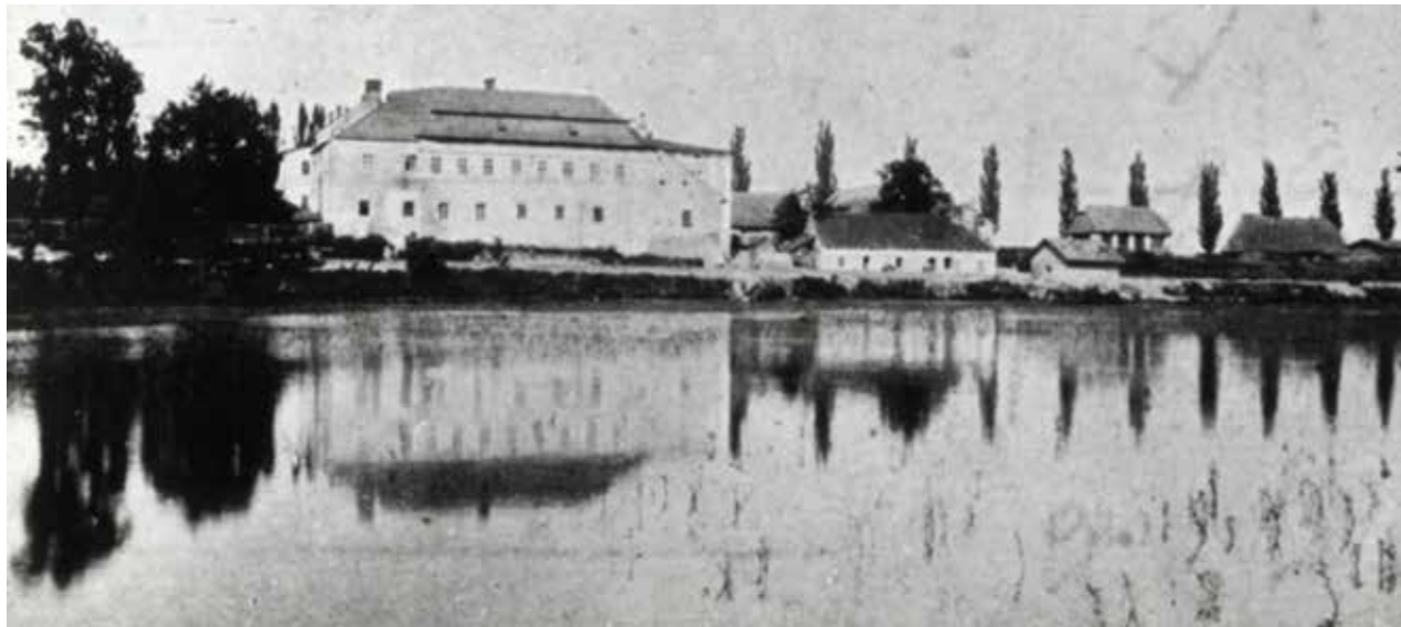
Porubský zámek, kde mladý pár pobýval.

čen starala o raněné vojáky, kteří sem byli evakuováni z frontových lazaretů. Když rakouský Červený kříž v roce 1916 hledal dobrovolnice, které by se vydaly do Ruska, aby se staraly o za-