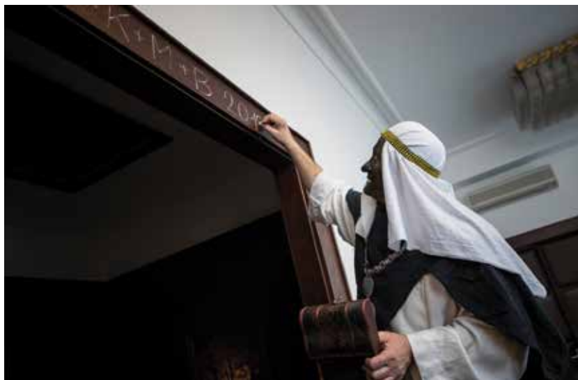
Nápis K+M+B (Christus mansionem benedicat neboli Kristus požehnej tomto domu) přináší domácnostem klid a štěstí.

Do ulic města a okolních obcí vyjdou čtyři stovky tříkrálových skupinek. Koledníci jsou vybaveni plasto-