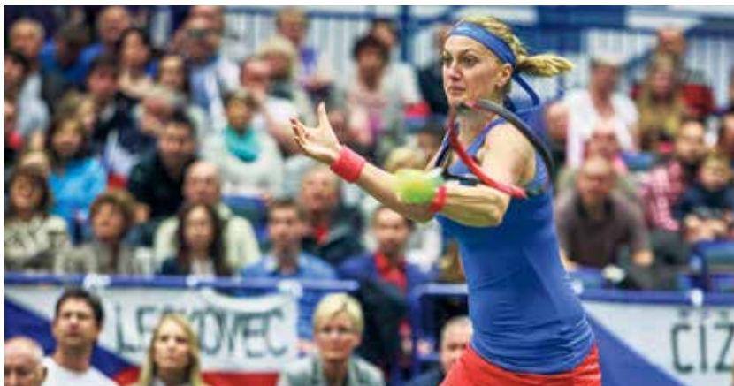
Ostravskému publiku se představí i dvojnásobná wimbledonská vítězka Petra Kvitová.

Další víkend, konkrétně ve dnech 9. a 10. února, zavítají do Ostravy české tenistky na zápas prvního kola světové skupiny Fed Cupu. Česká tenisová reprezentace v nejsilnějším složení s Karolínou Plíškovou, Petrou Kvitovou, Kateřinou Siniakovou a dalšími hráčkami se utká s Rumunskem. „Čeká nás hned v prvním kole silný tým, za který může nastoupit i světová