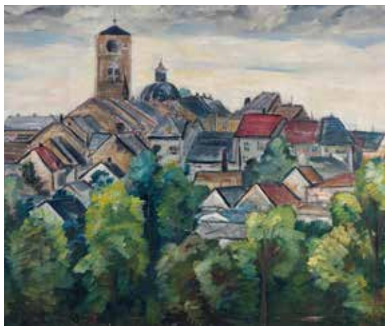
Pohled na Klimkovicce.