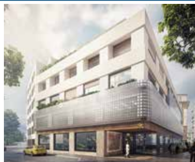
Vizualizace budovy s lékařskými ordinacemi a hotelem.

„Na Laubech“ měli první nájemníci bydlet v roce 2021. Bohužel tento termín se zdá být ohrožený. Nové vedení města totiž dosud nezdalo ani potřebný archeologický průzkum. Stejně tak nikterak dále nerozpracovalo ani