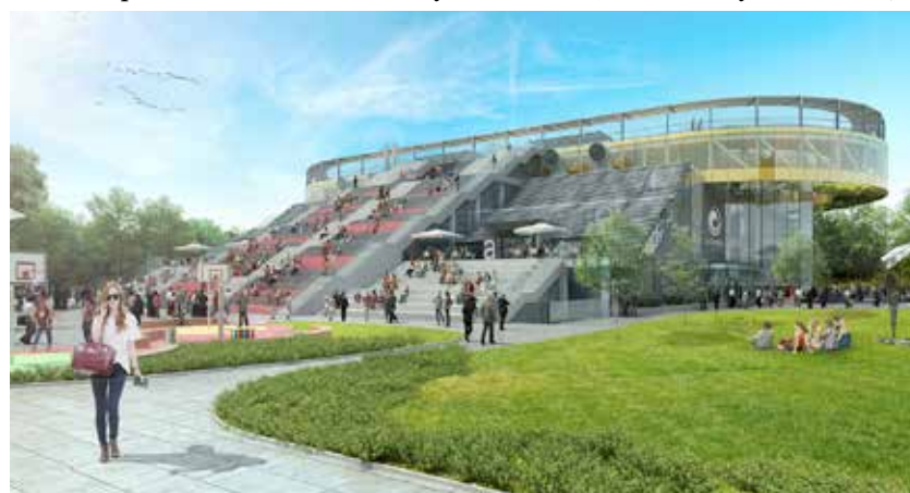
Vizualizace budovy Katedry studií lidského pohybu, pod níž město vybuduje podzemní parkoviště se 160 místy.

Výstava mapuje technický pokrok a stává se každoročním setkáním návštěvníků s vystavovateli a odbornou veřejností. Novinkou bude vstupní expozice moderního domu s využitím prvků úsporného bydlení a zdrojů vytápění. Budou v ní zakomponovány ukázky alternativ vytápění. (hob)