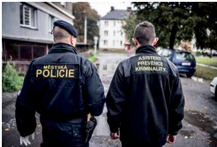
Strážník městské policie společně s asistentem prevence kriminality v ulicích města.

Členy týmu jsou zástupci magistrátu, městských obvodů, městské a státní policie, škol, neziskových organizací poskytujících sociální služby,