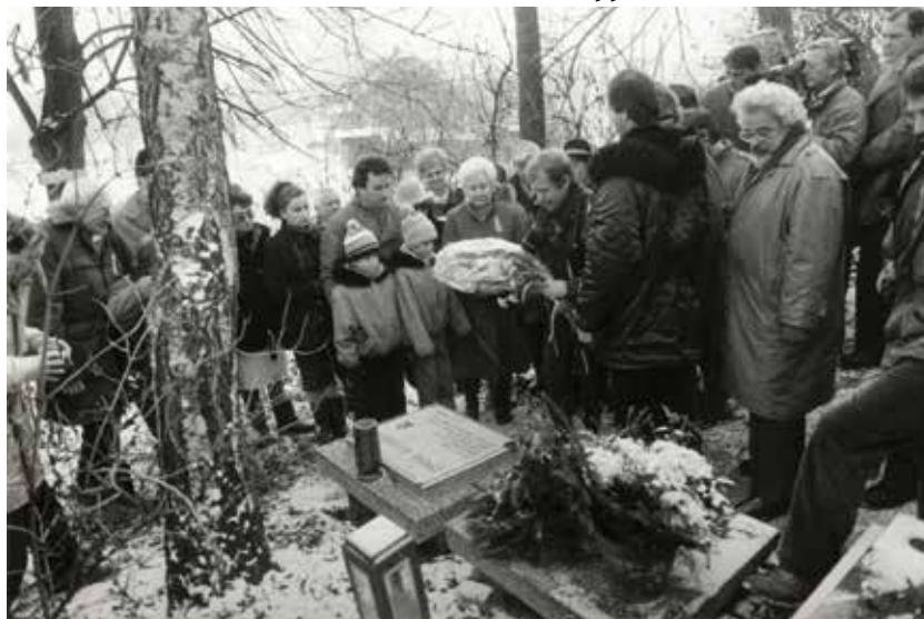
Návštěva Václava Havla u hrobu Jaromíra Šavřdy v lednu 1990.

Jaromír Šavřda patřil k nejvýznamnějším osobnostem ostravského disentu. Jeho hrob v Hrabové byl také prvním místem v Ostravě, kde se zastavil Václav Havel, jako nově zvolený prezident, při své zdejší návštěvě v lednu 1990.