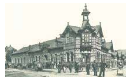
Kolonie získala jméno po bývalém hostinci U Koule.

ce. Domy získaly po rekonstrukci jednotný vzhled a působí v nich desítky firem. Díky tomu kolonie zůstala zachována. (rs)