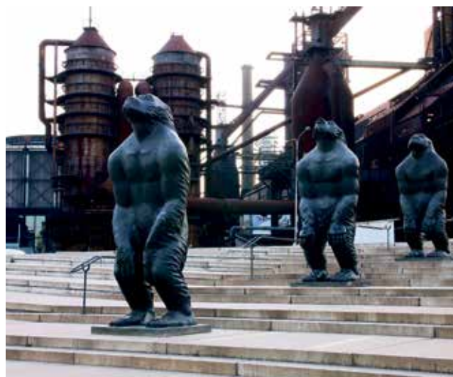
Bronzové sochy na schodišti před Velkým světem techniky.

věcem. U Velkého světa techniky bude instalace k vidění do září. Dvačtyřicetiletý Ruowang absolvoval studia na China Central Academy of Fine Arts. Jeho díla jsou zastoupena v soukromých, veřejných i firemních sbírkách po celém světě. Jeho tvorba zahrnuje plastiku i malbu. Například v roce 2013 vystavoval v jihokorejském parlamentu. (hob)