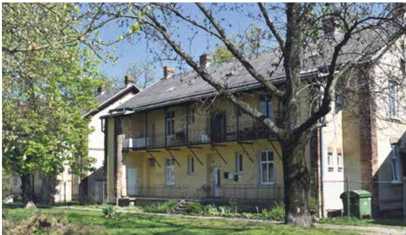
Některé domy kolonie dodnes slouží bydlení.