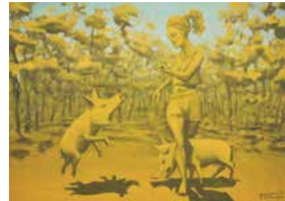
MICLovo venčení čuníků.

ZaZa. Je v pořadí druhým vystavujícím ze čtyř umělců ze skupiny Natvrdlí. Jeho malby doslova rozzářily galerii a rozzářily také tváře návštěvníků. „Snažím se, aby mé malby byly vtipné. Když se něčemu zasměji, já, tak snad