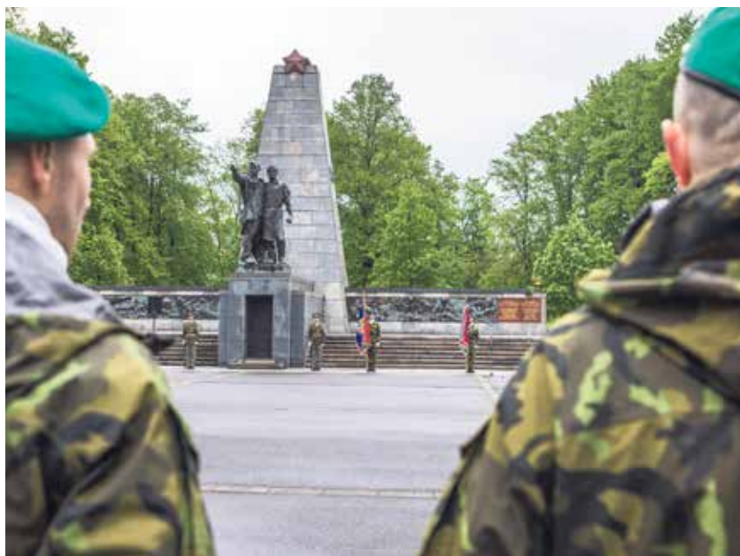
Setkání u památníku v Komenského sadech.