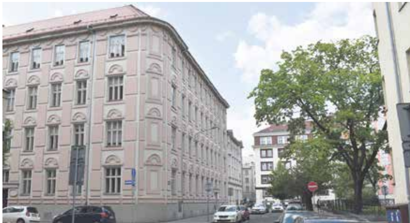
V domě na rohu Husovy a Veleslavínovy ulice vznikne po rekonstrukci 23 nájemních bytů.

prostorů na byty,“ informoval náměstek primátora Radim Babinec. Rekonstrukce vyjde na 34,8 milionu korun a práce potrvají rok. Z kanceláří v bu-