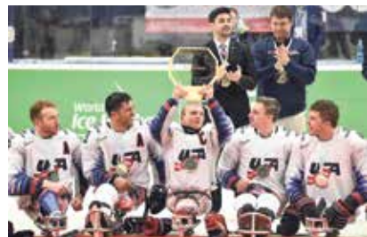
Mistrovský titul vybojovali Američané.