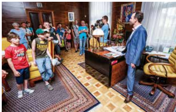
Návštěvníci si mohou prohlédnout reprezentativní prostor radnice a setkat se s primátorem.

Workshopy, dílny, výstavy, prezentace, divadla, koncerty, autorská čtení i dobrodružné úkoly pro vás připravilo 31 klíčových ostravských institucí až do pozdních nočních hodin. Klíč ke geocachingu můžete hledat v Knihovně města Ostravy, jiný si můžete vylovit v galerii PLATO, odemkněte zlatou bránu Centra PANT a zapojte se do prostorové instalace z papírových klíčů v Knihovně Galerie výtvarného umění v Ostravě. Klíčové znalosti pro život v socialismu si otestujte v Moravskoslezské vědecké knihovně a nezapomeňte si pro-