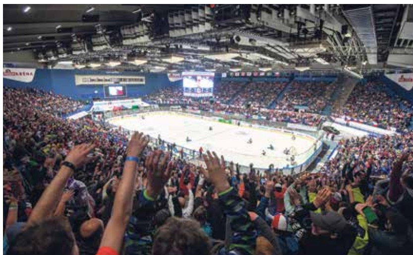
Hráče bouřlivě povzbuzovala zcela vyprodaná Ostravar Aréna.