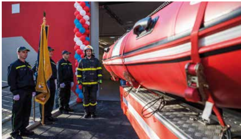
V přístavbě zbrojnice našel své místo i člun určený pro speciální zásahy.