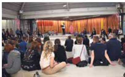
Stage v Plato.

Galerie Plato zakončila akci Dočasně struktury otevřením stage – prostoru pro divadlo, koncerty nebo performance. Zároveň otevřela zázemí pro