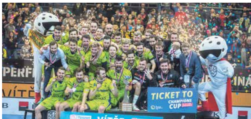
Ženy a muži Vítkovic slaví mistrovský titul.