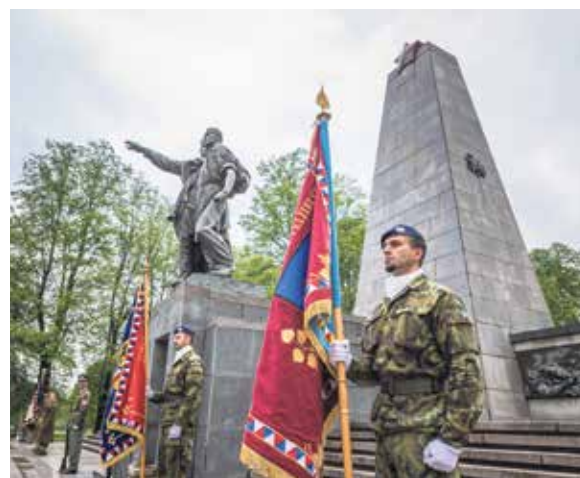
Vzpomínková akce v Komenského sadech.

„Ostrava je jediným krajským městem, na jehož osvobození se vedle Rudé armády podíleli také českoslovenští tankisté a letci. Všichni si zaslouží naši vzpomínku a úctu,“ zdůraznil primátor Macura. Připomenul ovšem také neblahé poválečné události, především po únoru 1948, kdy byla řada osvoboditelů ze západní i východní fronty perzekuována v politických procesech. (rs)