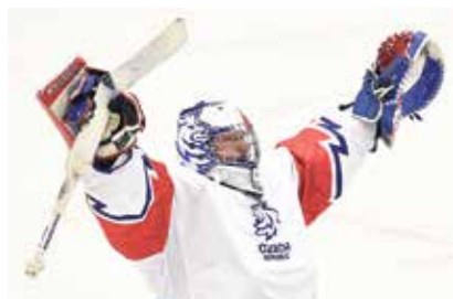
Česká radost po vyhraném zápase.