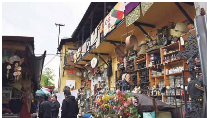
V Bendlově ulici se zabydlel největší ostravský bazar VLATO.

ném stavu a rozhodovalo se, co s nimi bude dál. Byly nabídnuty k privatizaci. V Bendlově ulici domy koupil podnikatel Ladislav Běšťák který v ulici zřídil autobazar. Byty v prvních podlažích zdevastované nepřizpůsobivými nájemníky svépomocí opravoval, spodní prostory po drobných úpravách nabídl živnostníkům. V nich pak působila restaurace, železářství, opravná kol, astroložka Pernová a bazary. Ve dvou domech dodnes působí největší ostravský bazar VLATO. První patra části domů v Bendlově ulici stále slouží bydlení.