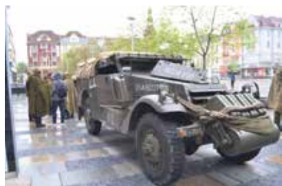
Historická technika v centru Ostravy.