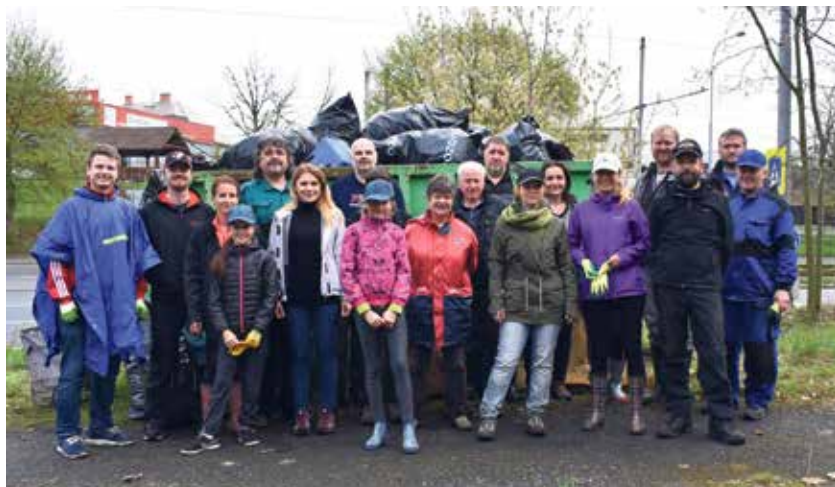
Společný snímek části magistrátního týmu u kontejneru s nasbíraným odpadem.

Na tři desítky dobrovolníků naplnily během necelých tří hodin sto pytlů odpadky, které se povalovaly v okolí. Další větší odpad skončil i s pytlí v kontejneru přistaveném společností OZO. V lesíku, v trávě a v ruinách za střelnicí se povalovaly pet lahve, skleněné lahve, rozřezané kabely, zbytky počítačů, pneumatiky, nejrůznější obaly, plesňivé matrace, zbytky textilií, staré boty, malířské potřeby, plechovky od barev a dokonce rozbité loutky nebo zachovalá čínská keramika. „Společnost OZO