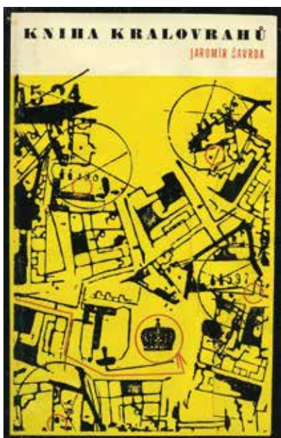
Knihu kralovrahů vydalo Sdružení umělců slezských v Ostravě 1971.