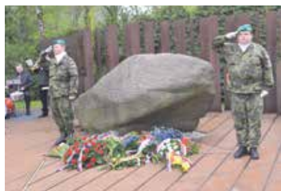
V Porubě se pietní akt k osvobození uskutečnil 28. dubna