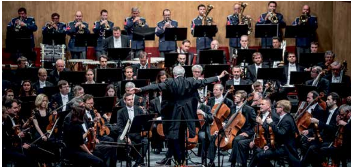
Letošní zahajovací koncert bude pod taktovkou Kristjana Järviho.