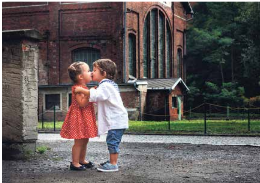
Láska kvete v každém věku a prorodinné vazby vznikají velmi brzy.

Chcete-li se inspirovat nápady, kam s dětmi v Ostravě a okolí, jste také na správném místě. Z webu se totiž lze jednoduše dostat na facebooko-