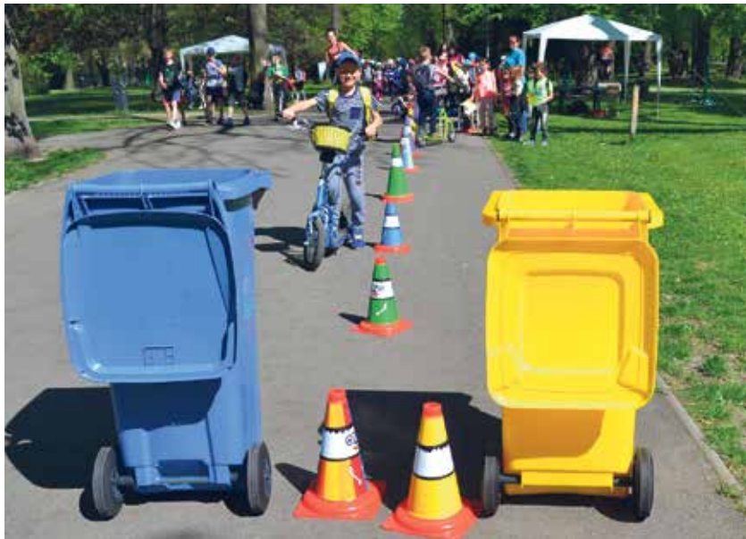
Děti čeká na každé z akcí den plný zábavy, her i poučení.