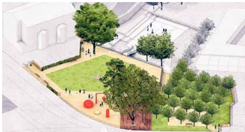
Vizualizace nové podoby Farské zahrady.

„I letos pokračujeme s estetizací veřejného prostoru. Léta zanedbaný