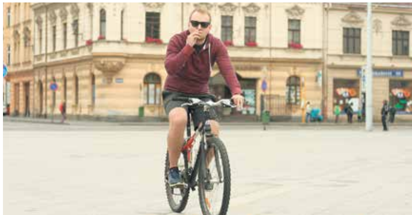
Kouření škodí zdraví, ale při řízení ohrožuje ostatní nepozorností řidiče.

Na základě těchto zkušeností se kromě besed strážníci v těchto dnech stále více zaměřují na samotnou kontrolu těchto negativních jevů přímo „v ulicích“. (mp)