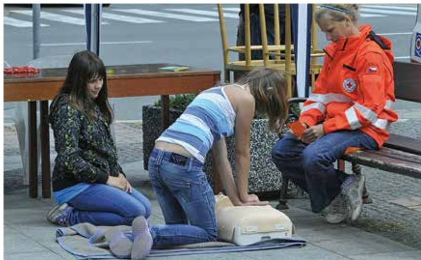
Divky se učí, jak správně provádět masáž srdce.

Jak tedy na správně a rychle poskytnoutou laickou první pomoc? „Pro laika na ulici platí tyto zásady – zjistit, jestli postižený reaguje na hlas, dotyk. Pokud ne, zakloňte mu hlavu a pokud jste sami, volejte 155, kde už vás operátorka navede. Pokud je vás víc, určete, kdo má volat 155, a vy se dál věnujte postiženému. Propněte obě ruce v loktech, dejte dlaně přes sebe a mačkejte dotýčného uprostřed hrudníku asi 100 až 120x za minutu do hloubky 5 až 6 centimetrů. Ruce pořád natažené, mačkáte ramena a zády. To je vše,“ uzavřela Kateřina Ciorová. (mn)