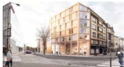
Jedním z úkolů nového ateliéru bude dostavba proluk ve městě. Vizualizace představuje návrh domu na rohu ulic Biskupské a 28. října.

Důvodem k odložení rozhodnutí ministerstva jsou závažné nedostatky v dokumentaci. Připomínky se týkají dodržování emisních limitů, intenzity dopravy, vlivu na zdraví obyvatel a specifikace a objem spalovaných odpadů, zejména zdravotnického materiálu. Na to vše poukazovali politici i občané na veřejném projednávání. Společnost SUEZ, která chce nechat linku postavit, má na doplnění tři roky. Pokud ji nedoplní, proces posuzování vlivů na životní prostředí skončí. Bez této dokumentace by stavba neměla být povolena. (rs)