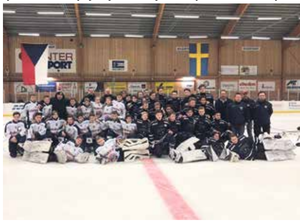
Sedmáci ve Švédsku.

„Pro naše hráče to byla první velká hokejová zkušenost v zahraničí a zvládli ji na výbornou. Nejen že měli, stejně jako my trenéři, šanci porovnat naši českou školu s tím, jak se hraje hokej ve Švédsku, ale zároveň si dokázali, že díky zodpovědnému přístupu