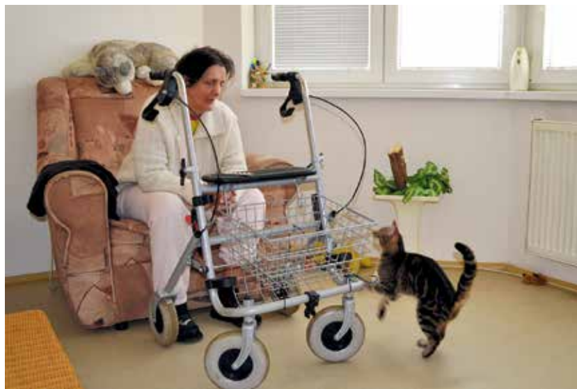
Senioři patří do skupiny ohrožené bytovou nouzí.

Na realizaci projektu magistrát spolupracuje s městskými obvody, ale také s neziskovými organizacemi, Úřa-