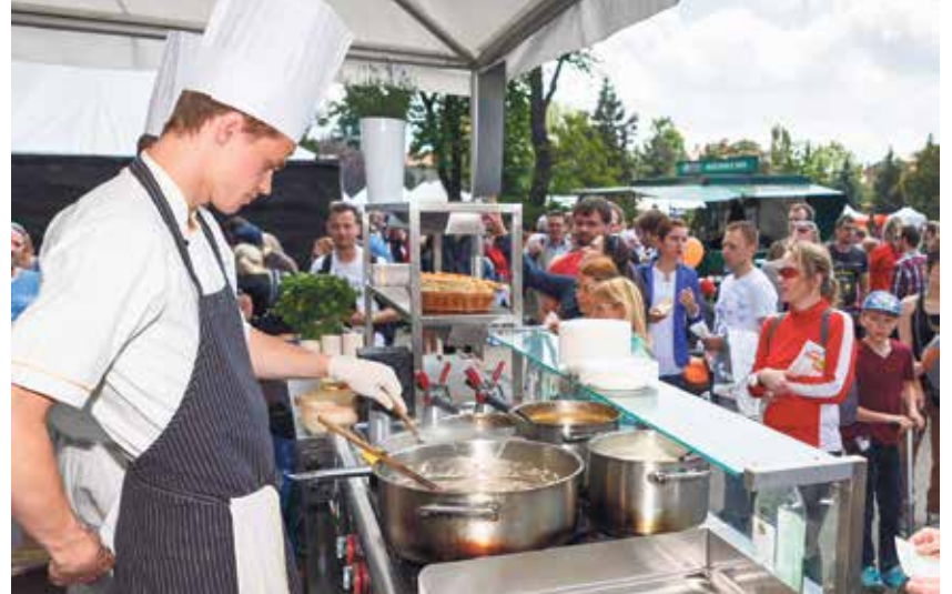
Kuchaři na Slezskoostrovském hradě nabídnou návštěvníkům domácí i světové speciality.

Novinkou letošní série akcí je spojení jídla s uměním. „Program na pódiu prodloužíme až do večera. Gastronomii na scéně vystřídá muzika, která navodí správnou atmosféru ke ku-