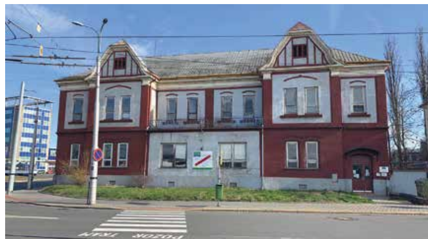
Prázdný dům v Nádražní 196.

Dům je docela prostorný a po rekonstrukci by se mohl stát sídlem hned dvou významných institucí. Tou první je KODIS, tedy společnost, která pro město a kraj koordinuje spojení vlaků, autobusů a MHD. Dnes sídlí v soukromém domě. Přitom z hlavního nádraží je to jen pár minut tram-