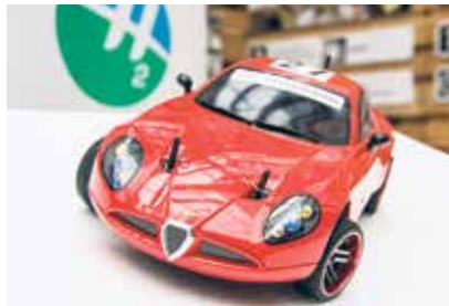
Jeden z modelů poháněných vodíkem.

Tři desítky středoškolských týmů vyrobily autíčka na dálkové ovládání s vodíkovým pohonem a zúčastní se s nimi 5. ročníku národního finále Horizon Grand Prix. Dvoudenní klání se uskuteční 17. a 18. dubna v Trojhalí. Pořadatelé zvou na akci odborníky, středoškoláky i širokou veřejnost. Studenti postavili v měřítku 1:10 vozy, které jsou poháněny vodíkem a které