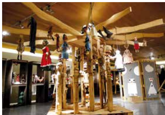
Interaktivní výstava Pimprlarium v Madridu.

Maňásci, muppeti, stínové loutky, marionety či jadvajky – jaký je mezi nimi rozdíl, odkud pocházejí a jak se s nimi pracuje? To vše se mohli dozvědět