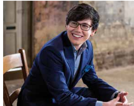
Mladý britský pianista Martin James Bartlett zahraje Ravelův klavírní koncert.

všechny příznivce filmu a hudby. V rámci cyklu Lásk na první poslech zazní filmová hudba 8. a 9. května od 19 hodin v Domě kultury města Ostravy. (hob)