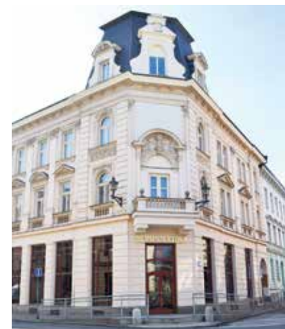
Nynější podoba budovy.

„V té době jsme měli menší prodejnu s numismatikou, starými pohlednicemi a obrazy v Nádražní ulici, prakticky za rohem. Mí mladší spolupracovníci mne v roce 2015 přesvědčili, ať prostory rozšířím. Dům po spořitelně se mi líbil, doslova mě uchvátil pohled na přívozký kostel,“ zavzpomínal Vladimír Kejla, kterého těší, že přispěl k oživení zanedbané městské části. (st)