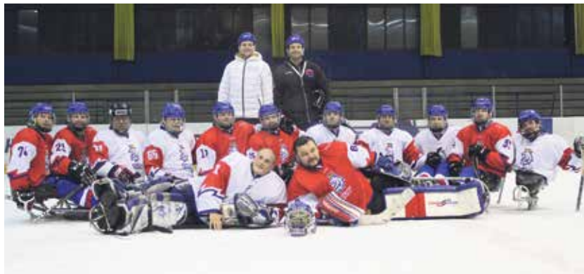
Čeští reprezentanti budou chtít získat v domácím prostředí medaili.

Již se rozběhl prodej vstupenek v síti smsticket a na pobočkách Ostrava.info. Základní jednodenní vstupné začíná na 50 korunách. Zájemci si mohou ale vybrat i variantu až do výše 500 Kč. Jedná se o dobrovolné vstupné, z nichž pořadatelé pořídí para ho-