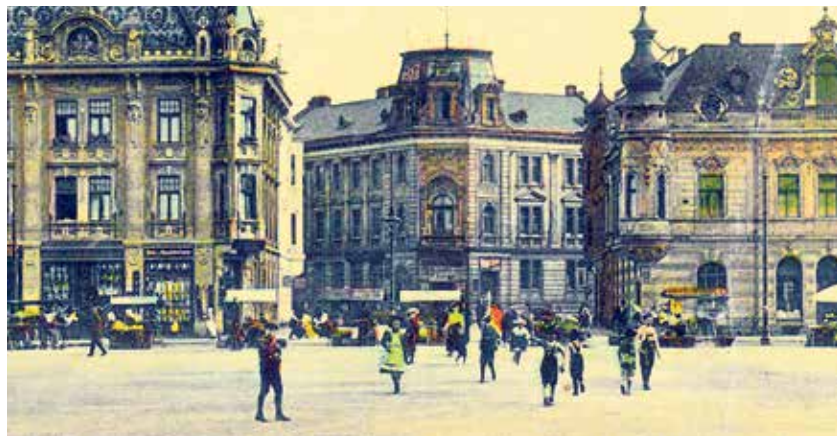
Dům na pohlednici ze začátku 20. století.

Do domu se ve 20. letech minulého století nastěhovala Občanská záložna, která v něm vydržela až do reorganiza-