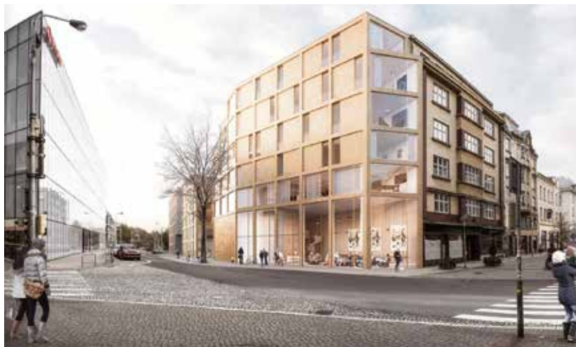
Vizualizace vítězného návrhu domu v Biskupské ulici.

Projekt nového bytového domu v lokalitě Biskupská x Kostelní souvisí se snahou o oživení historického centra města. Vítězný návrh obsahuje 40 bytů. Investorem bude obvod Morav-