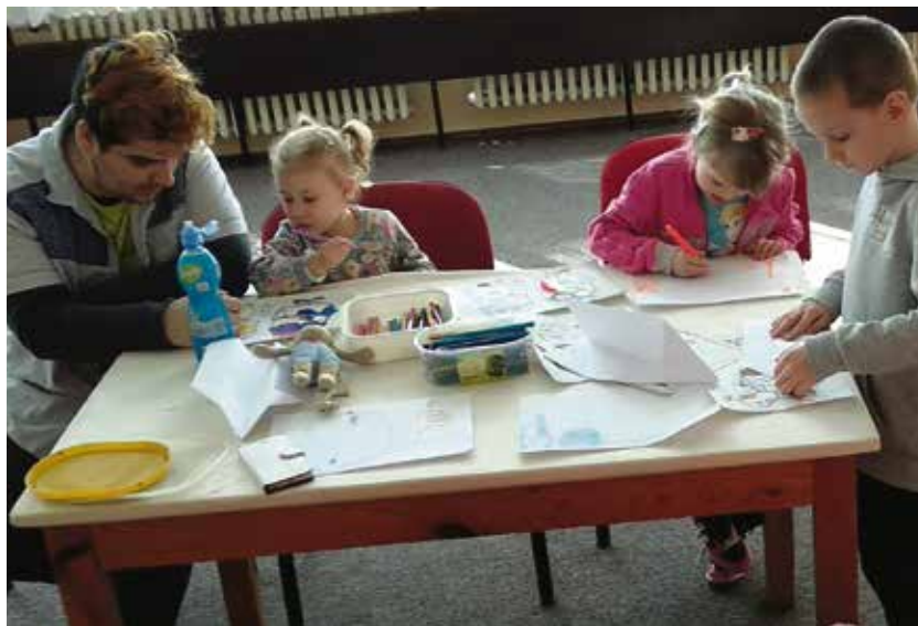
Společné pobyty upevňují tolik potřebné vzájemné vztahy.

Do aktivity „Ženy na trhu práce“ se v rámci 4 běhů zapojilo celkem 37 žen. Některé z nich prošly pouze aktivizačním kurzem, aby získaly dovednosti potřebné pro uplatnění se na trhu práce, jiné se rozhodly pokračovat dál, a to formou „práce na zkoušku“ na tréninkových místech a stážích u vybraných zaměstnavatelů. Během tříměsíční spolupráce si obě strany mohly