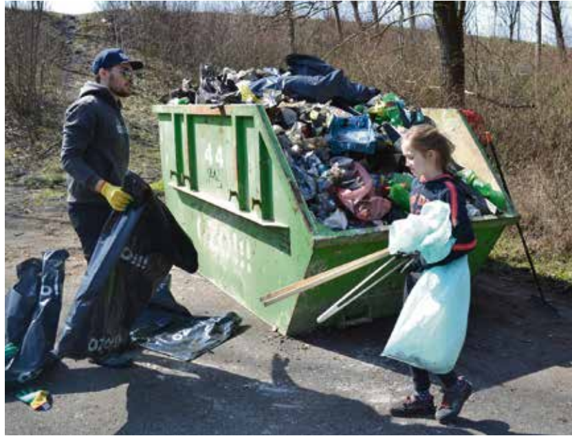
Sesbírané odpadky rychle zaplnily přistavený kontejner.