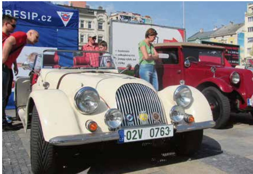
Na trať rallye vyrazí historické automobily.

Rallye historických automobilů a motocyklů pořádá Tatra Veteran Sport Club Ostrava. (rs)