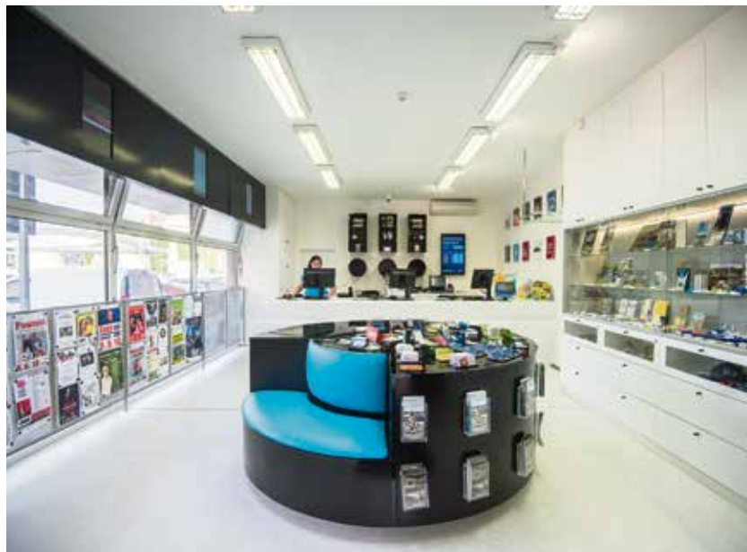
Zmodernizované prostory pobočky OIS u svinovského nádraží.

digitálních prezentací a sociálních sítí. Internetové stránky www.ostravainfo.cz byly v rámci soutěže TTG Czech Travel Awards 2017 zařazeny mezi tři nejlepší turistické portály v Česku. (rs)