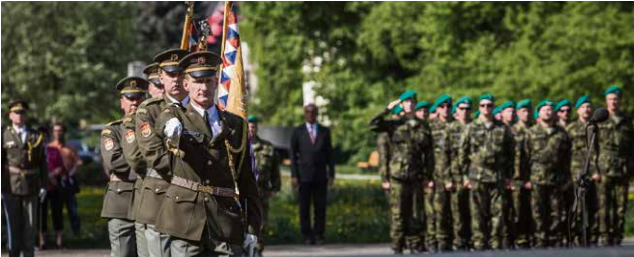
Slavnostní nástup vojenských jednotek u památníku v Komenského sadech.