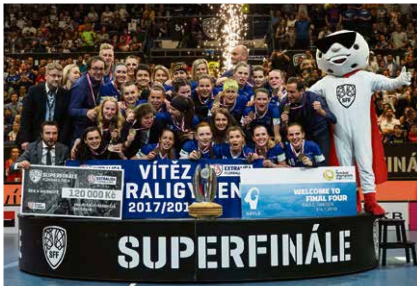
Hráčky 1. SC Tempish Vítkovice se radují z titulu mistryň ČR.