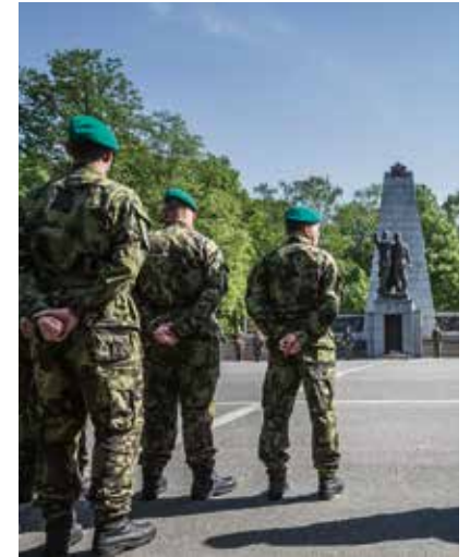
Památník Rudé armády.