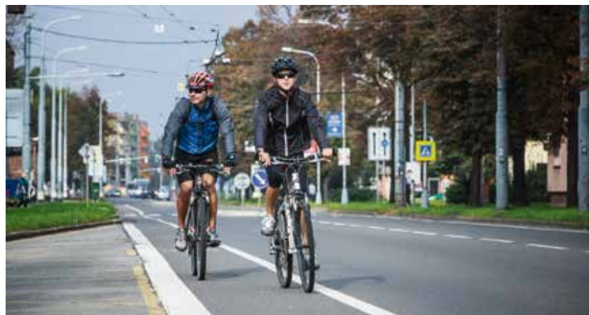
Mezi často opomíjenou bezpečnostní výbavu cyklistů patří i přilba.