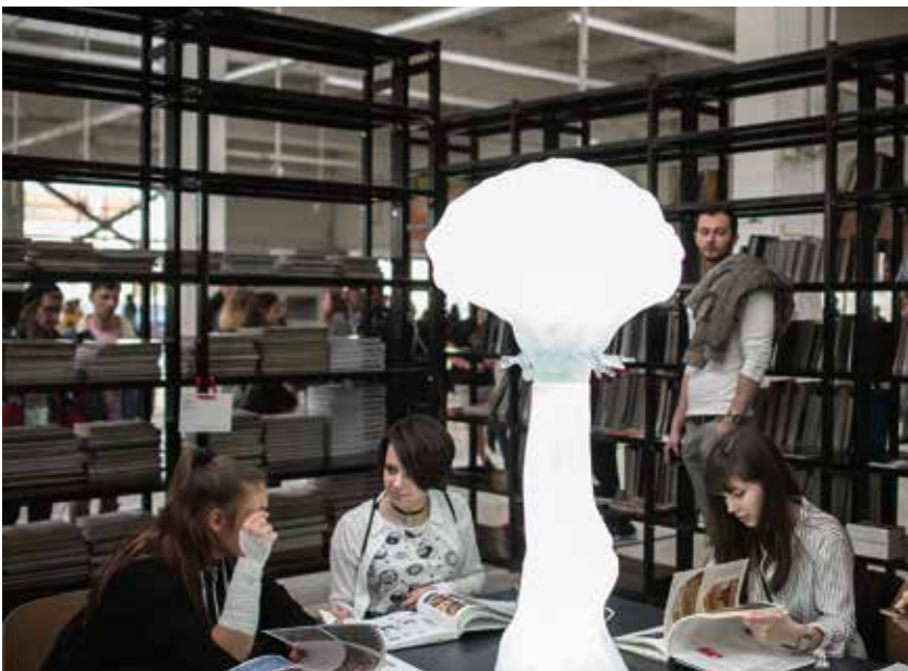
Návštěvníkům slouží knihovna.

v Bauhausu galerie uspořádala kromě výstav také performance, projekce, koncerty, divadelní představení, diskuse, workshopy s umělci pro děti, rodiny i dospělé a edukační programy pro školy. (rs)