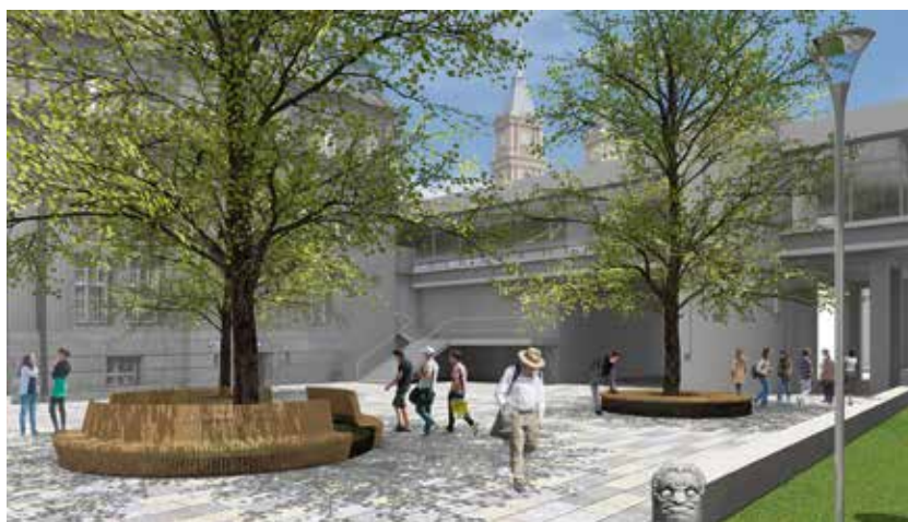
Vizualizace piazzetty před Komerční bankou.