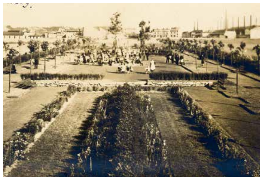
Smetanův sad v Mariánských Horách, počátek 20. let minulého století.