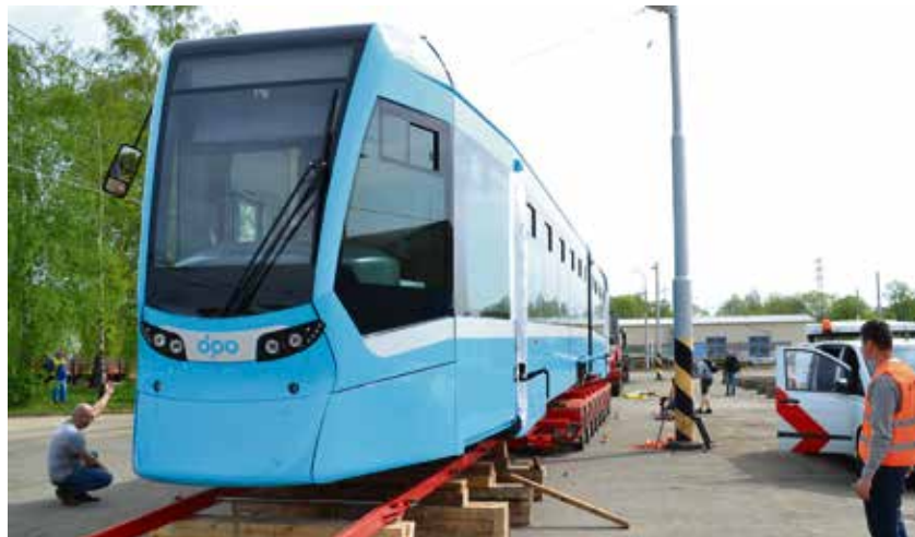
Technici přesouvají novou tramvaj z nákladního vozu na koleje.

zbytné pro bezpečnost. Čelo tramvaje je tvarováno tak, aby zvýšilo ochranu chodců při případném střetu. Maximální rychlost je 80 km/h. Cena jedné tramvaje činí 28,5 milionu korun. (rs)