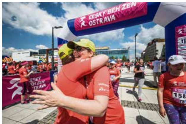
Radost v cíli.

Pokud se běžkyne přihlásí do 10. května, budou mít na startovním čísle své jméno. (rs)