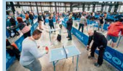
Minipingpong se hraje na desítkách stolů najednou.

Registrace na festival již byla spuštěna na oficiálních stránkách https://www.miniping-pong.cz/registrace/ a bude probíhat online do 1. června. Po tomto termínu je možné se zaregistrovat přímo na místě před zahájením akce. Registrace je pro všechny účastníky zdarma. (rs)