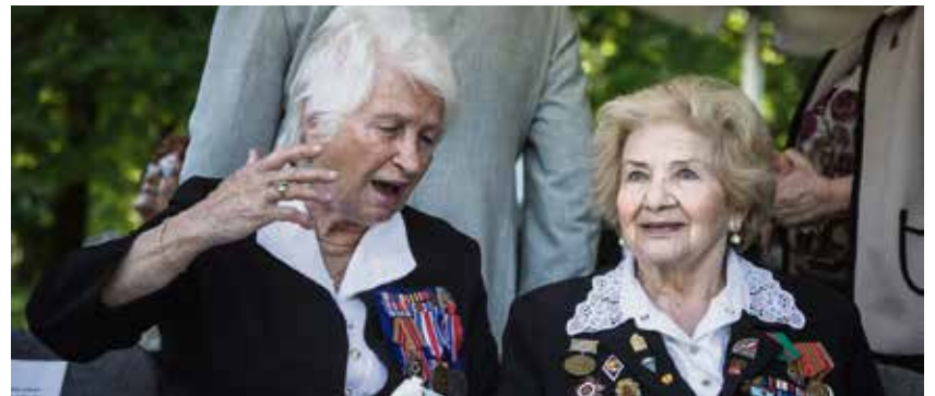
Pietní akt je pro pamětníky příležitostí setkat se a zavzpomínat.