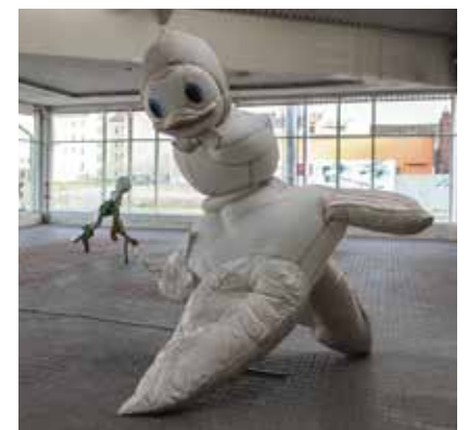
Objekty v galerii.