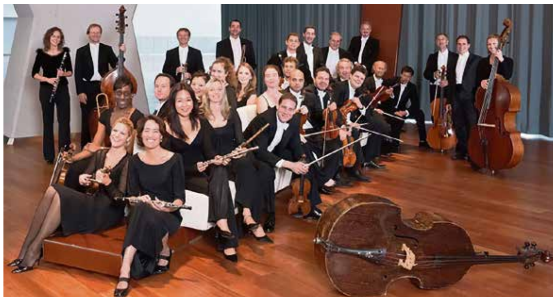
Camerata Salzburg v plném nasazení vystoupí na festivalu Leoše Janáčka.

Součástí festivalu je výstava Antonína Gavlase Partitury světa v galerii Gaudeamus v DKMO. (red)