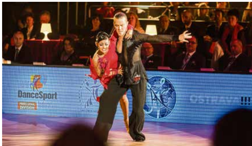
Záběr z Czech Dance Open 2015.