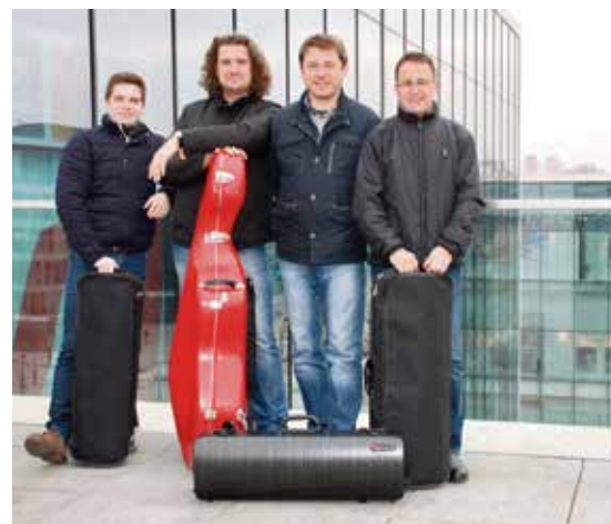
Benda Quartet zahrají 14. května.

V České republice se do Noci kostelů každoročně zapojuje na 1400 kostelů a modliteben, které kromě otevřených dveří nabízejí více než šest tisícovek bohatých a zajímavých doprovodných programů. Zájem bývá pravidelně velmi vysoký a každoročně se pohybuje kolem 450 tisíc návštěvnických vstupů. Podrobnosti o programu v jednotlivých kostelech můžete najít na webových stránkách www.nockostelu.cz . (hob)