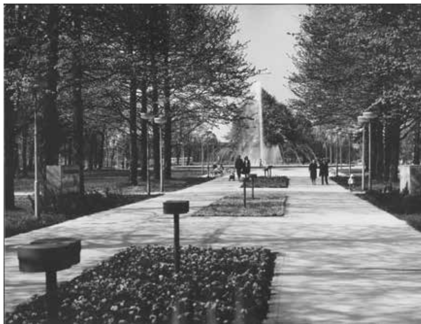
Sad Dr. Milady Horákové, fontána v místech bývalého krematoria, 1994.

O zřízení Smetanova sadu v Mariánských Horách rozhodla správní ko-