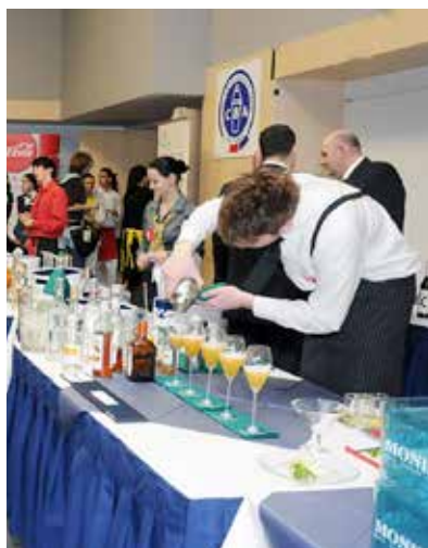
(p) Z průběhu soutěže.

AHOL – Střední škola gastronomie, turismu a lázeňství z Ostravy-Vítkovic je již tradičním pořadatelem gastronomické soutěže AHOL CUP 2013 s mezinárodní rotou a účastí. Letos na konci zimy