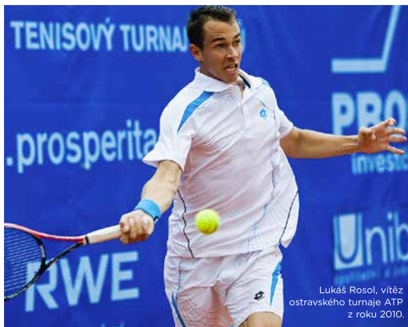
Lukáš Rosol, vítěz ostravského turnaje ATP z roku 2010.