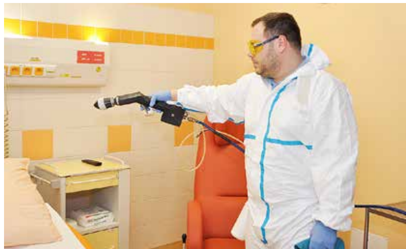
Nástřikem speciální suspenze na všechny povrchy se sníží obsah škodlivých látek a mikroorganismů o více než 50 procent.