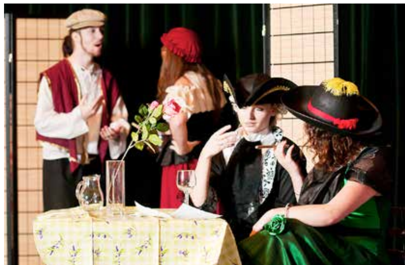
Dotace z rozpočtu města Ostravy významně podporují volnočasové aktivity dětí a mládeže. Na archivním snímku jsou studenti Wichterleho gymnázia v Porubě při divadelním představení.

podpoře se těší také atletika SSK Vítkovice a Centrum individuálních sportů pro talentované jednotlivce. Město zůstává partnerem významných mezinárodních sportovních akcí jako jsou Zlatá tretra, Světový pohár