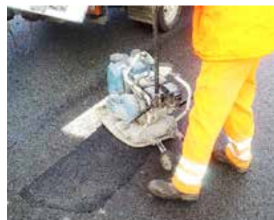
Studenou směsí se zaplňují výtluky ještě v chladném počasí.

Opravy studenou balenou směsí, které jsou prvním opatřením chránícím řidiče před nebezpečím poškození jejich vozidel, silničáři prováděli do konce března. Po zlepšení počasí, začnou používat teplou balenou směs, která umožňuje kvalitnější a trvalejší opravu silnic.