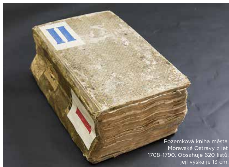
Pozemková kniha města Moravské Ostravy z let 1708-1790. Obsahuje 620 listů, její výška je 13 cm.