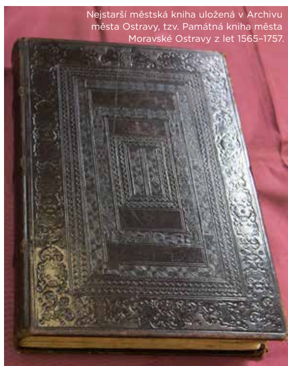
Nejstarší městská kniha uložená v Archivu města Ostravy, tzv. Památná kniha města Moravské Ostravy z let 1565-1757.