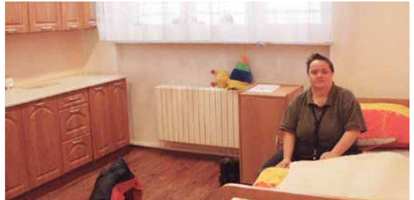
Zrekonstruovaný pokoj v Domově na Liščině.

Evropská unie v letošním roce podpoří ještě další dva projekty ostravského Čtyřlístku, a to téměř dvánácti miliony korun vybudování nového Domova se zvláštním režimem v Ostravě-Muglinově a částkou převyšující 5,498 mil. rekonstrukci Domova Beruška v Ostravě-Zábřehu. (d)