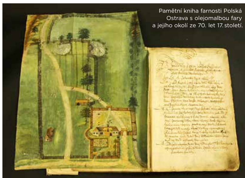
Pamětní kniha farnosti Polská Ostrava s olejomalbou fary a jejího okolí ze 70. let 17. století.