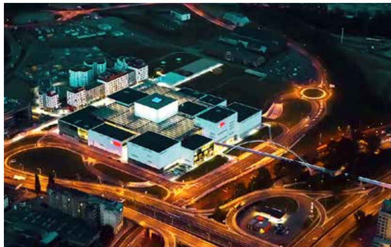
Dnešní Nová Karolina ve srovnání s průmyslem znehodnocenou lokalitou, která tu bývala do roku 1985, je z hlediska vizuálního, ekologického i užitného pro město přínosem.

kancelářemi a byty, ale přijde-li jakýkoli investor s jiným nápadem (škola, poliklinika, sportovní centrum aj.), lze to do druhé etapy začlenit. Pro druhou etapu výstavby se počítá s náklady kolem 2 miliard korun. (g)