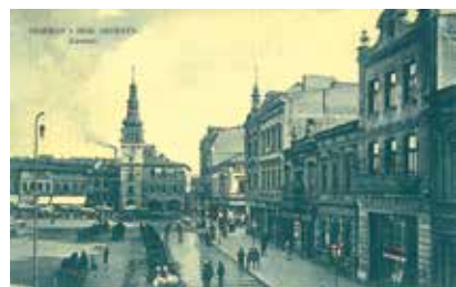
Pohlednice z roku 1911 ukazuje, jaké domy v místě původně stály.

Debata se však stočila i na budoucí zastavění této plochy, na které byly až do roku 1968 domy s prodejny v přízemí. Několik diskutujících navrhovalo domov pro seniory, přičemž výhodou by bylo, že senioři bydlící v těchto zařízeních nepoužívají automobily a nebyla by proto nutnost budovat další parkoviště. Dalším by se líbily byty, protože rezidenti vždy znamenají oživení daného místa. (rs)