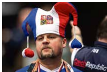
Smutný český fanoušek.