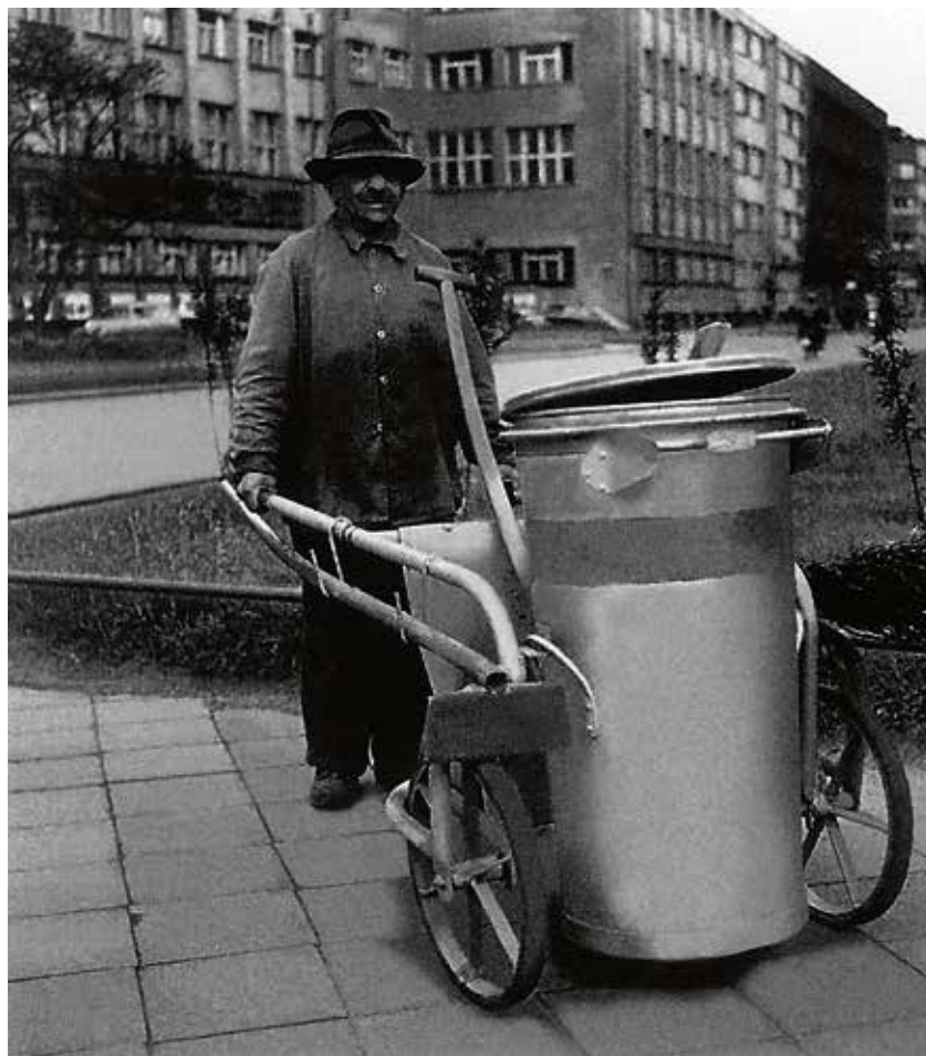
Metař na Prokešově náměstí, kolem r. 1960.

Snímky ukazují, jak Ostravané trávili volný čas, jak sportovali, které prodejny a obchody navštěvovali anebo s jakými těžkostmi se museli vypořádávat. Publikace je k dostání v pobočkách Ostravainfo. (rs)