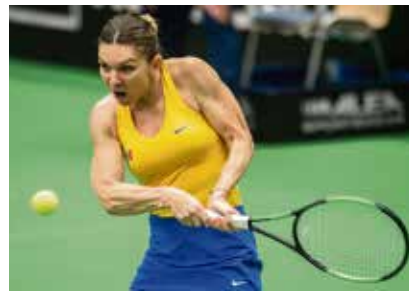
Simona Halepová porazila obě naše hráčky.