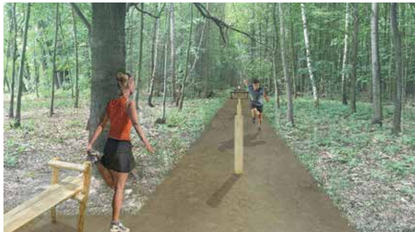
Vizualizace běžeckého okruhu, který se rozkládá na území obvodů Poruba a Krásné Pole.

Trasu a mobiliář doplní panely s informacemi o použití jednotlivých cvičebních prvků a tzv. patníky, které budou umístěny podél okruhu a budou udávat hodnotu uběhnutých metrů. Návrh běžeckého okruhu je vytvořen s ohledem na charakter lesního prostředí tak, aby působil přirozeně a zároveň naplňoval rekreační funkci území. (rs)