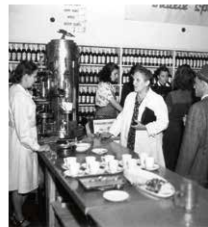
Bufet v roce 1949.