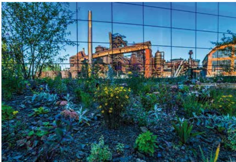
Cenu Dům roku před pěti lety získal Velký svět techniky, jehož skleněná fasáda odráží industriální areál Dolních Vítkovic.

„Letošní ročník je nejen jubilejní, ale také přináší určitou změnu. Každoroční soutěž Dům roku jsme přejmenovali na Ostravskou stavbu roku a věříme, že se rozšíří portfolio možných zájemců o účast v soutěži i o investory veřejných prostorů. Dosud se nám hlásili pouze investoři novostaveb a rekonstrukcí domů. Dlouhodobě deklaruje zájem o rozvoj kvalitní architektury ve městě. Svědčí o tom také počet architektonických soutěží, které v posledním období samo město vyhlásilo. A ty, kteří do Ostravy kvalitní architekturu přinášejí, chceme oceňovat. Třeba právě v této soutěži,“ zdůraznila