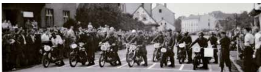
Start motocyklového závodu v Zábřehu, 60. léta.