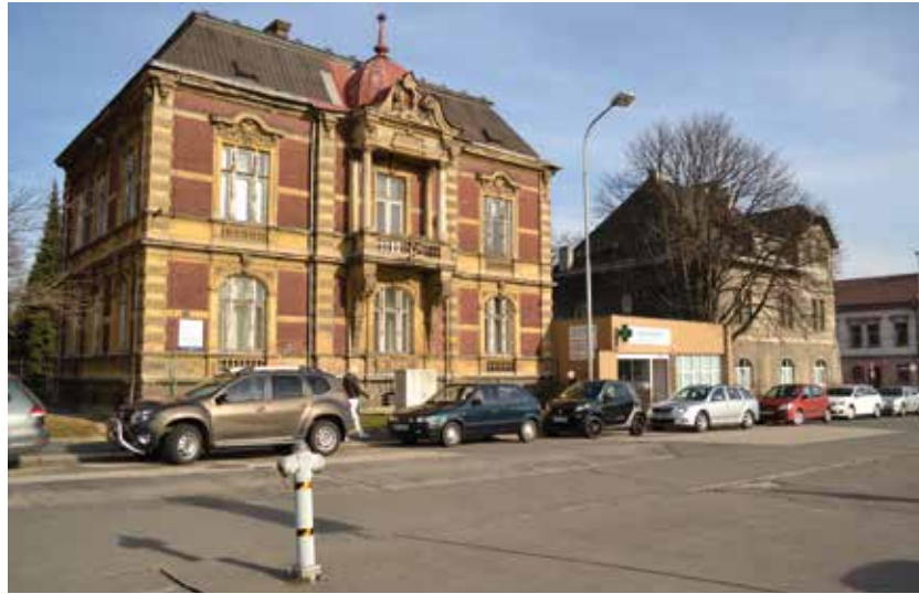
Do památkově chráněné vily se vracejí zdravotníci i pacienti.

Anesteziologická ambulance patří k oddělení ARO, slouží k optimalizaci přípravy pacientů před plánovaným operačním nebo diagnostickým výkonem v anesteziologii. Je určena pro dospělé pacienty. K vyšetření se pacienti objednávají krátce před datem operace telefonicky. Ambulance je v provozu v pracovní dny od 7.30 do 15 hodin.