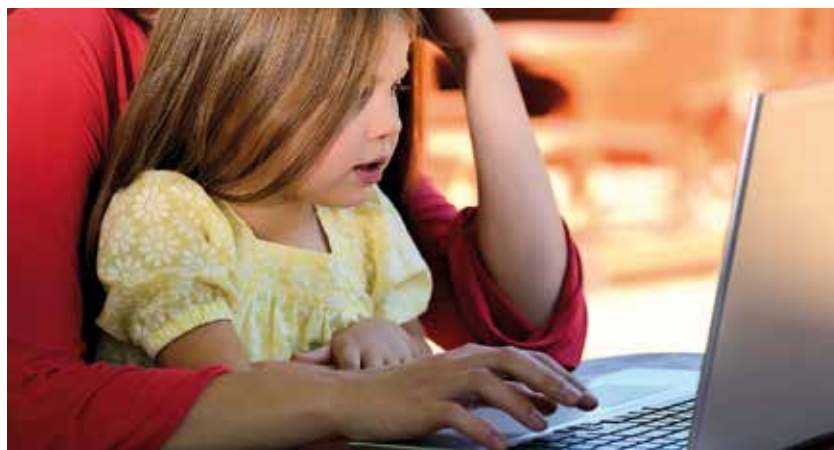
Rodiče nedomýšlejí, co může způsobit nevinné foto na internetu.

Termín sharenting označuje nadměrné používání internetových služeb rodiči, kteří sdílejí obsah, ve kterém figurují jejich vlastní děti. Konkrétně jde o nadměrné sdílení fotografií či videí vlastních dětí či zakládání profilů dětí (bez jejich souhlasu) v rámci různých druhů online služeb, prenatalních profilů, online deníčků, ve kterých je život dítěte monitorován den po dni, měsíc po měsíci apod.