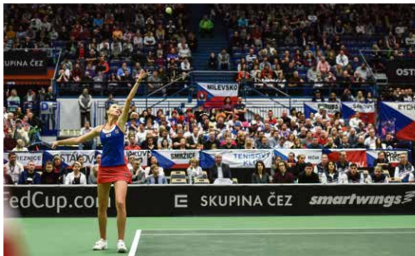
Karolína Plíšková servíruje před zaplněnou halou.

přičemž za oba týmy nastoupily dvě hráčky, které si vyzkoušely, jaké je to být světovými jedničkami – Karolína Plíšková a Simona Halepová.