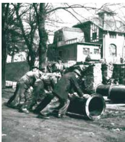
Národní směna, 1948.