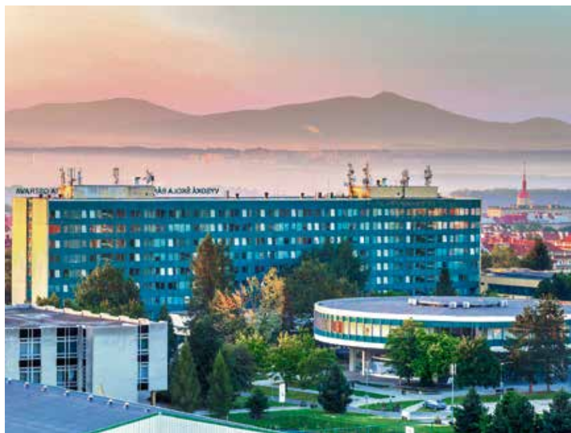
Vysoká škola báňská - Technická univerzita Ostrava sídlí v Ostravě od roku 1945, avšak její historie začíná již v první polovině 19. století.