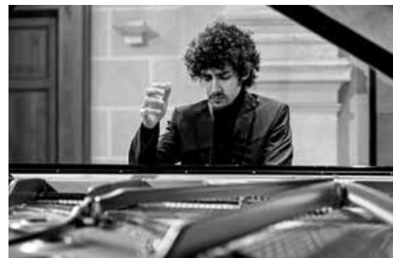
Vyhledávaný italský pianista Federico Colli.

V Multifunkční aule Gong vystoupí 21. března od 19 hodin Vojta Dyk s B-Side Bande. Petr I. Čajkovskij, Béla Bartók nebo Ferenc Liszt zazní 4. dubna od 19 hodin v podání vyhledávaného italského pianisty Federica Colliho, vítěze mozartovské soutěže v Salcburku. Slavný pianista rovněž zahraje 8. dubna v rámci cyklu klavírních recitálů Bacha. (hob)