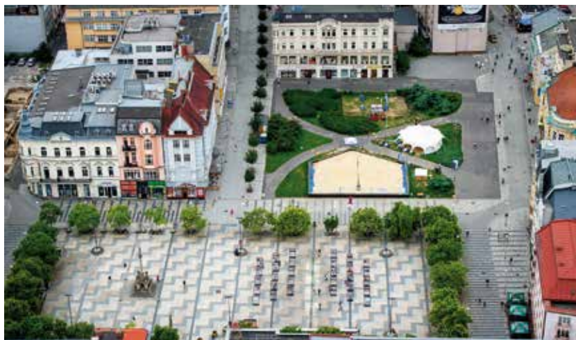
Účastníci besedy navrhovali dočasné využití proluky u Masarykova náměstí.

„Tato proluka by měla být během pěti až sedmi let zastavěna a určitě na ni vypíšeme architektonickou soutěž. Nyní ale hledáme její využití do doby, než se tam začne stavět. Chceme toto území zkulturnovat,“ vysvětlila zaplně-