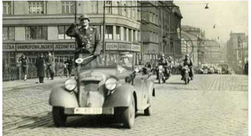
Německé vojsko na ulici 28. října, poblíž koksovy Karolina.

Nejhůře však byli postiženi ostravští Židé; hned po okupaci jim začaly být zabírány obchody a konfiskován majetek, byli vystaveni nejrůznějším