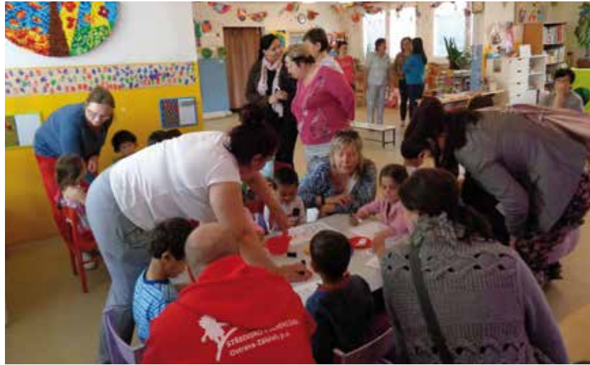
Týmy čerpají inspiraci pro svou práci na zahraničních stážích.

Realizovaná stáž nabízí účastníkům nové poznatky o možných výchovných a vzdělávacích metodách, vede k podpoře jejich osobnostního a profesního