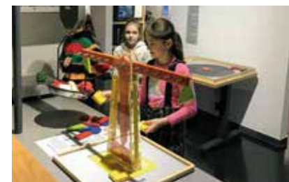
Žáci v iQLandii.

Program se zaměřuje na děti, které projevují zvláštní zájem v oblasti techniky a přírodních věd. Díky možnosti zkvalitnění podmínek pro vzdělávání, uskutečňování cílených aktivit a mimořádných akcí může být jejich potenciál s úspěchem rozvíjen. V nedávné době právě tyto žáci navštívili moderní science centrum se stovkami interaktivních exponátů a planetáriem – iQLandii v Liberci. Zde prozkoumali nejružnější expozice, zaměřené na celé