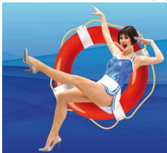
Hudební komedie Děj se co děj se odehrává na zámořském parníku.

Nejveselejší milostné dobrodružství v dějinách galantních podvodů. Staňte se svědky jednoho z nejneuvěřitelnějších milostných dobrodružství v dějinách. Komedii italské renesance Mandragora, kterou napsal Niccolò Machiavelli, uvede Komorní scéna Aréna 16. března. (hob)