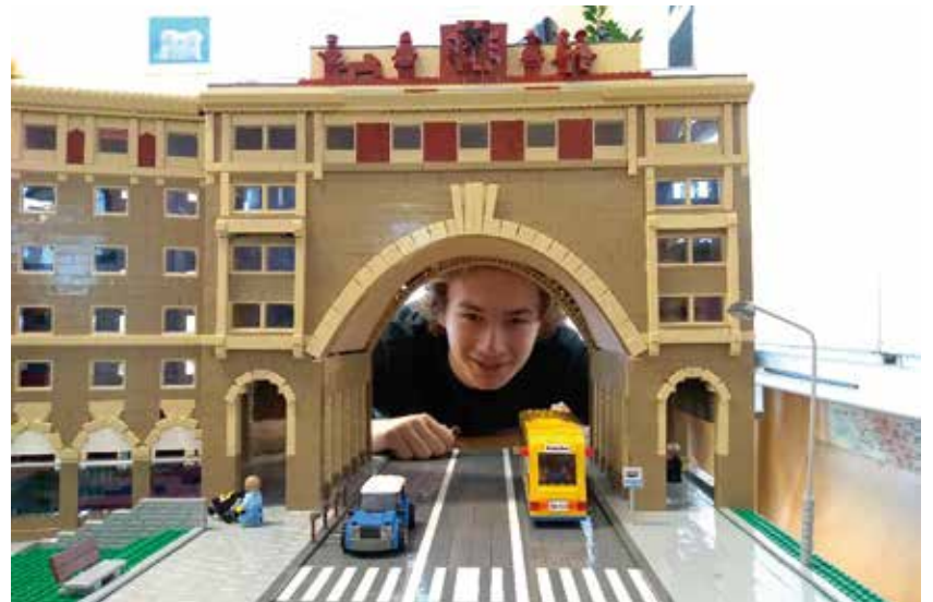
Interaktivní výstava potěší velké i malé.