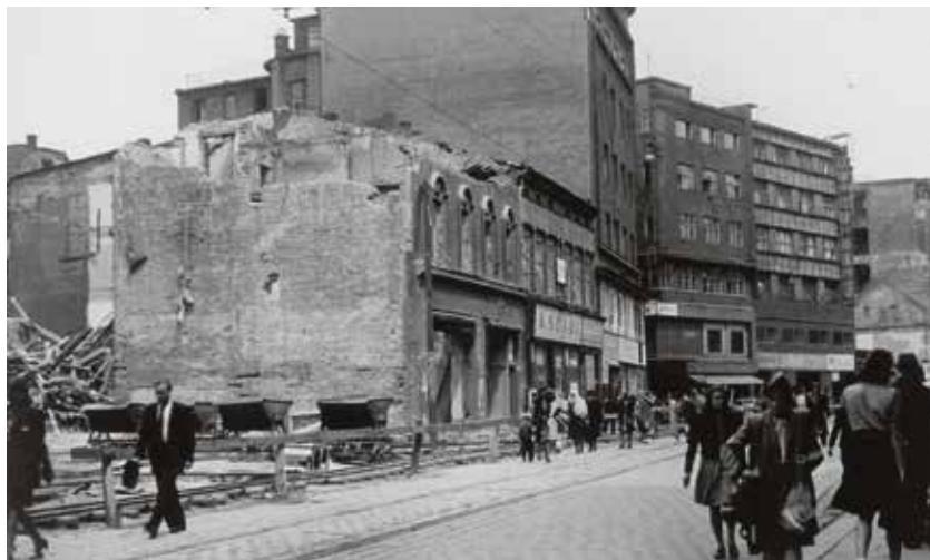
Domy zničené bombardováním na snímku z roku 1946.