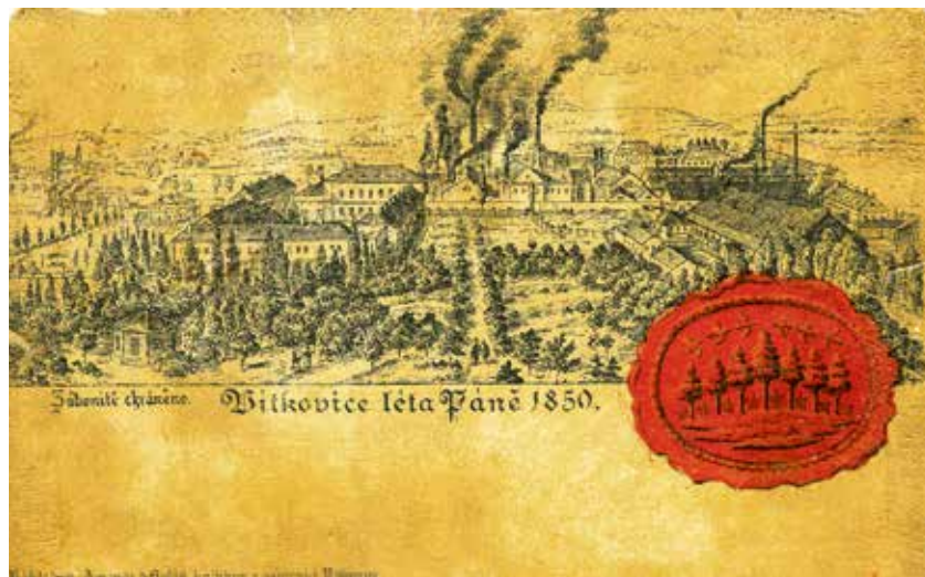
Pohlednice s Rudolfovou hutí vydaná vítkovickou tiskárnou Amende a Holaň.