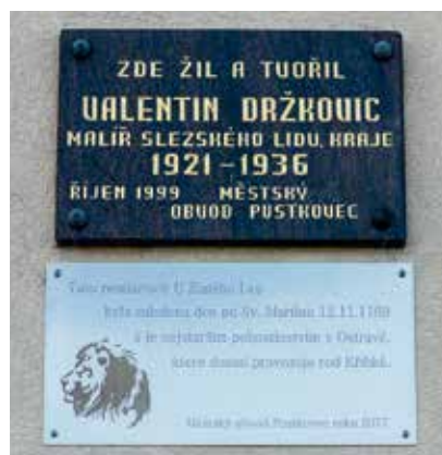
Pamětní desky, které zdobí fasádu pustkoveckého hostince.