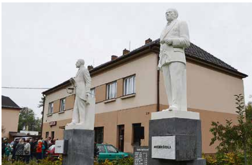
Památník obětem první světové války se sochami Antonína Švehly (vpravo) a Tomáše G. Masaryka.

Město přispěje také na opravy pomníků v Bartovicích, Hrabové, Proskovicích a Michálkovicích. (rs)