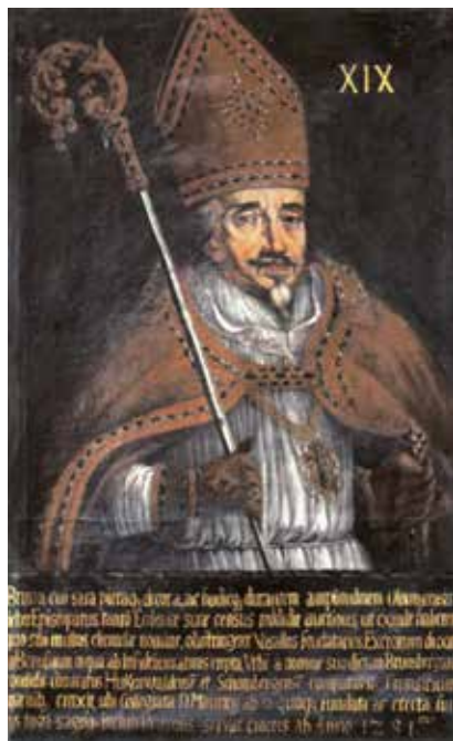
Biskup Bruno ze Schauenburku (1245–1281)