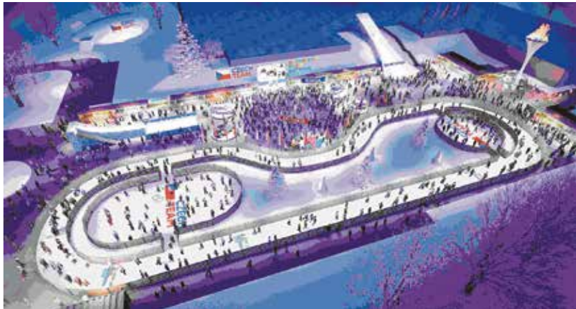
Vizualizace Olympijského parku v Ostravě.

Ostrava opět po dvou letech přivítá Olympijský park. Po úspěchu loňského letního Rio parku se mohou fanoušci těšit na zimní období u příležitosti olympijských her v Pchjongčchangu 2018. Tentokrát se hlavním centrem parku stane Ostravar Aréna.