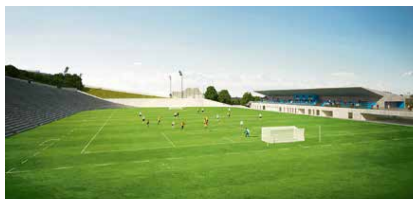
Vizualizace předpokládaného vzhledu Bazalů po rekonstrukci.

a podle primátora by toto místo mělo nadále sloužit fotbalu. Kraj přispěje na rekonstrukci areálu 70 milionů, Fotbalová asociace ČR přispěje každoročně na chod akademie částkou tří milionů korun. (rs)