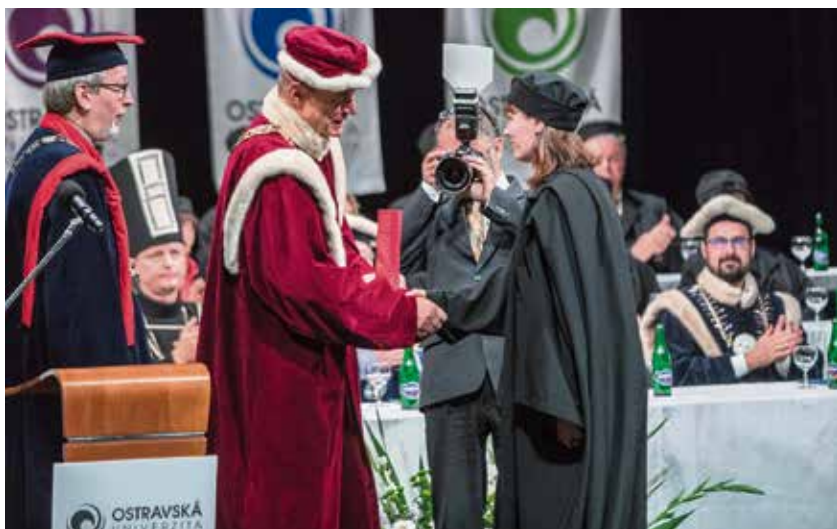
Slavnostní chvíle pro 36 absolventů doktorského studia.