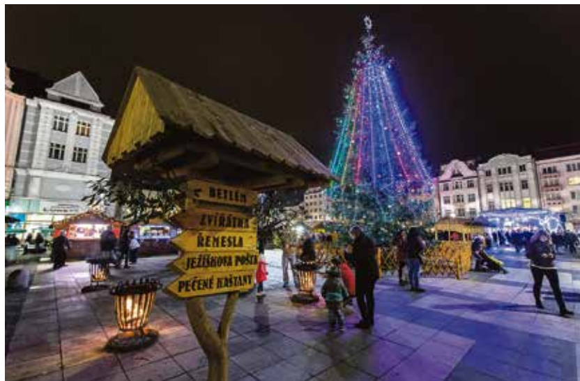
Pestré a bohaté, s podporou města. Na Vánoce se můžeme těšit.

Podrobný program najdete na www.ostravskevanoce.cz . (hob)