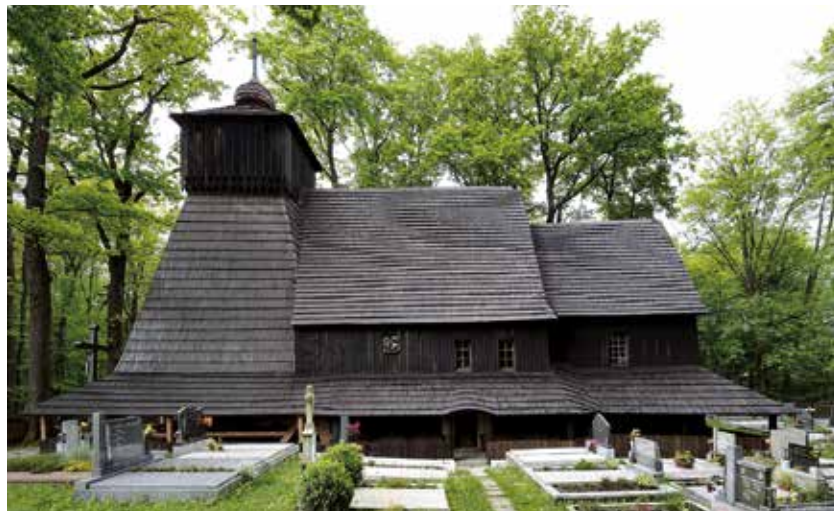
Kostel Božího těla v Gutech, jak jsme ho mohli obdivovat do srpna 2017.

dějšími zásahy. Jeho interiér skrýval výjimečný mobiliář, jehož některé kusy pocházely z 16. a 17. století. (bk)