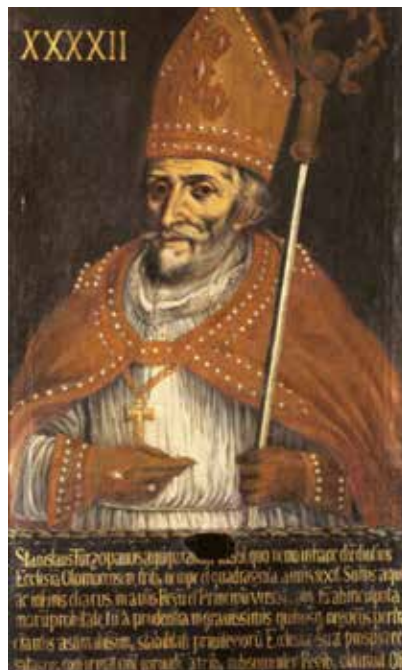
Biskup Stanislav I. Thurzo (1497–1540)