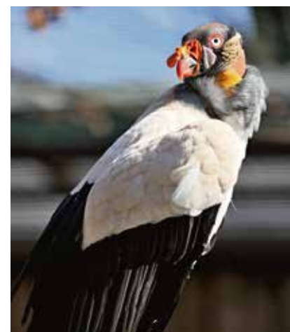
Kondor královský.

Kondoři královští se v zoologických zahradách chovají poměrně vzácně, v Evropské plemenné knize je jich vedena necelá stovka. Rozmnožovat se je daří jen ojediněle. Ostravská zoologická zahrada chová tyto nejpestřejší zbarvené kondory od roku 1970. Po téměř 50 letech se letos na jaře konečně dočkala i mláďete. (bk)