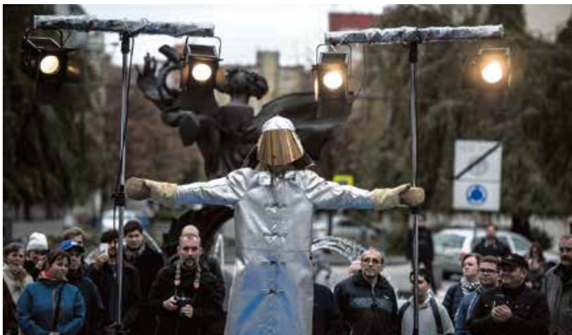
Na přehlídce pracovního oblečení byl k vidění i oblek hutníka.