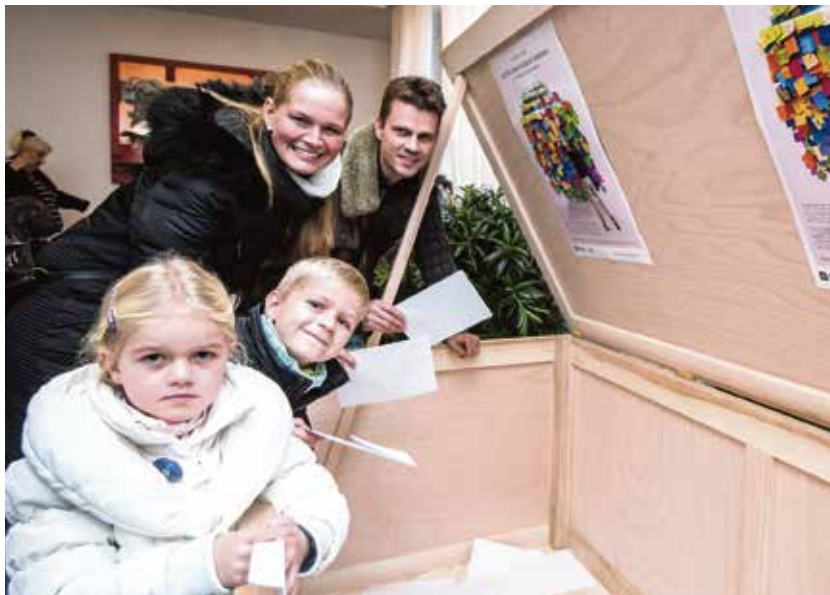
Své vzkazy vkládají do pamětní truhly jednotlivci i celé rodiny.

něním je pamětní truhla uložená v Kulturním středisku Cooltour na Černé louce, do které může současná generace Ostravanů vkládat poselství pro lidi, kteří tady budou žít za 50 let. Svůj vzkaz do ní může přidat kdokoli, kdo splní několik jednoduchých podmínek. Příspěvek – text, kresba či fotografie – musí být vyhotoven na papíru o maximální velikosti A4 a dodán v nezalepené obálce. Psán může být značkovačem Centropen 2631 document liner, čínským perem, obyčejnou tužkou, popřípadě obyčejnými pastelkami nebo černou tuší. Vyloučené jsou fixy a běžné propisky, jejichž barvivo se za několik let zcela rozpije nebo prosákne přes ostatní dokumenty.