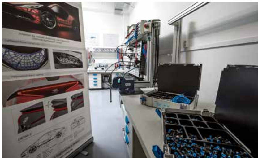
Pracoviště inovačního centra nabízejí nejmodernější vybavení.

Základní kapitál inovačního centra se navýšil celkově o 9,6 milionu korun. Na tomto navýšení participuje město částkou 3,7 milionu korun. Kraj i město budou mít ve společnosti stejný 45% podíl, zbylých 10 % připadá na Vysokou školu báňskou – Technickou univerzitu Ostrava, Slezskou univerzitu a Ostravskou univerzitu. (hob, ph)