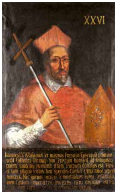
Biskup Jan VIII. Očko z Vlašimi (1352–1364)