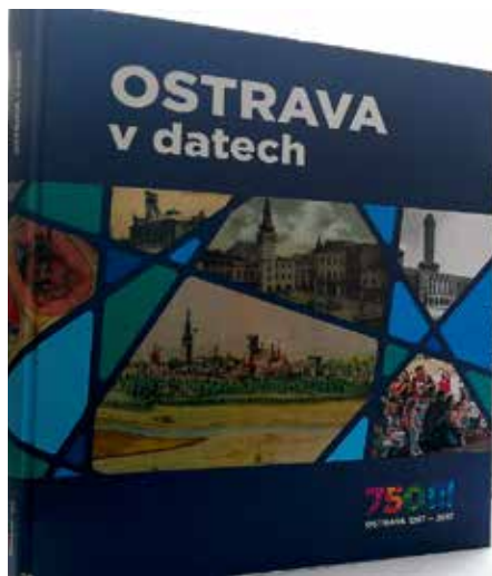
Čerstvě vydaná kniha Ostrava v datech.

Kniha Ostrava v datech je k dostání na pobočkách Ostravského informačního servisu za cenu 560 korun. (rs)