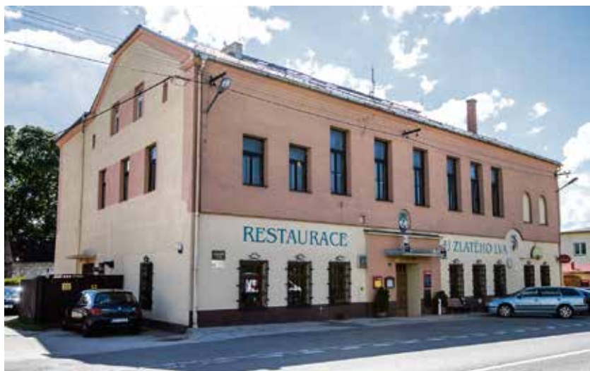
Restaurace U Zlatého lva, jak ji známe dnes.