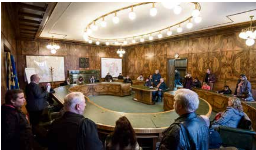
V síni rady města, která je běžně pro návštěvníky Nové radnice nepřístupná.