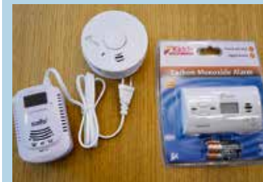
Ukázka požárních hlásičů a detektorů oxidu uhelnatého.