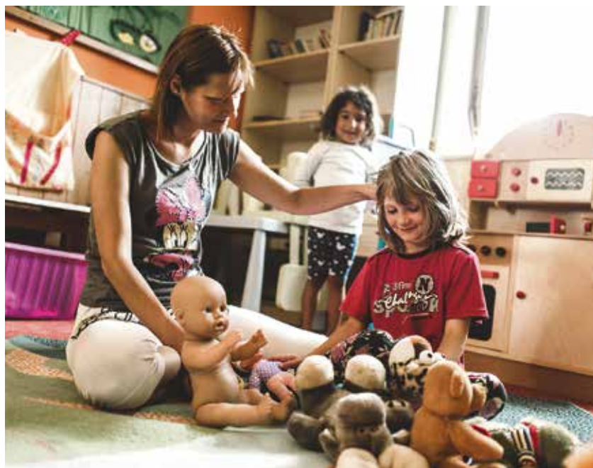
V charitním azylovém domě sv. Zdislavy.

Kompletní program Týdne rané péče najdete na http://trp.ranapece.cz . Projekt finančně podporuje město Ostrava. (km)