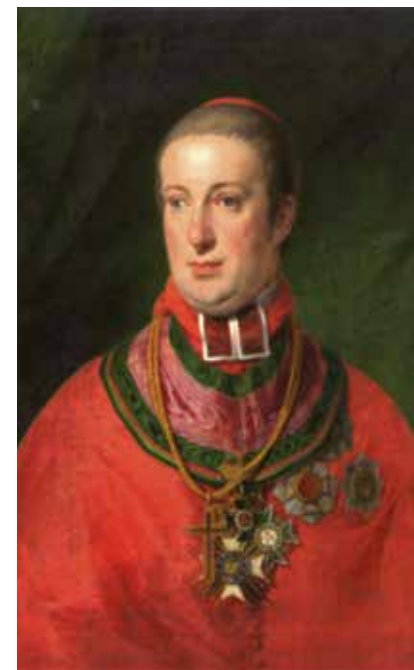
Arcibiskup Rudolf Jan (1819–1831)