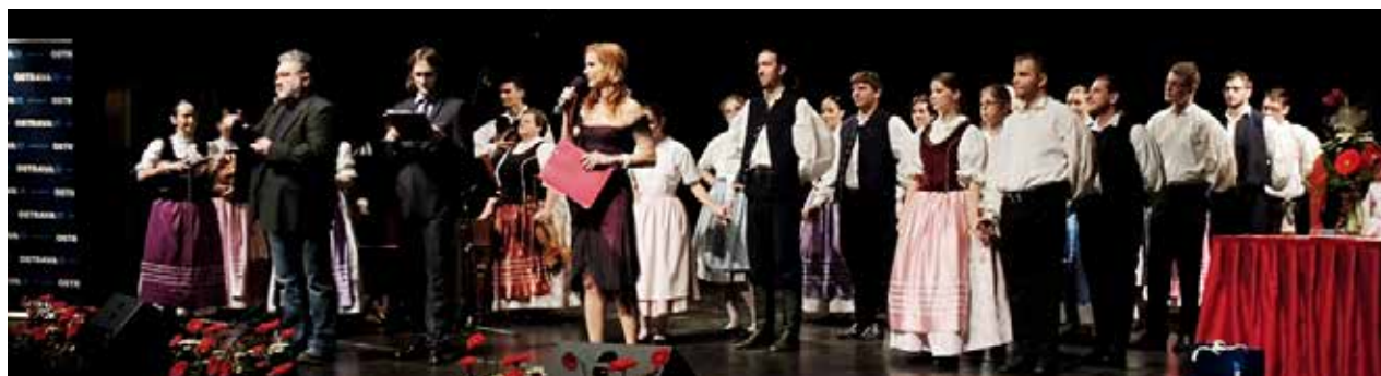
Z programu slavnostního večera Křišťálový kamínek 2015 v rámci Evropských dnů handicapu

O 75 kilo více než loni, celkem 302 kilogramy potravin shromáždili zaměstnanci Magistrátu města Ostravy 15. října při sbírce potravinové pomoci uspořádané u příležitosti Mezinárodního dne za vymýcení chudoby. Pracovníci magistrátu darovali především trvanlivé potraviny jako jsou těstoviny, cukr, rýže, mouka, luštěniny, sůl, konzervy, olej, instantní polévky či cukrovinky. Hned následující den byly potraviny předány ostravské Potravinové bance, která je bude dále distribuovat prostřednictvím organizací, které s potřebnými pracují. (zž)