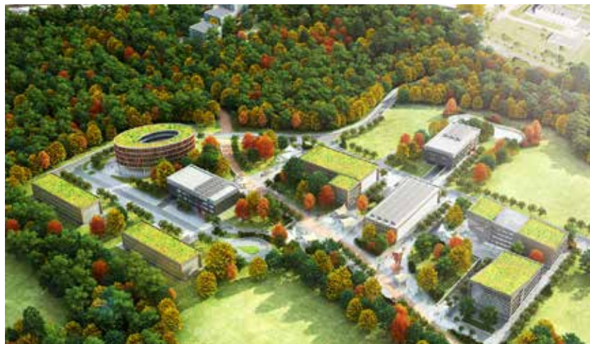
Vizualizace rozšíření VTP v Porubě

K rozšíření VTP primátor Ostravy vystoupil také ve čtvrtek 26. 11. na zasedání porubského zastupitelstva. (mv)