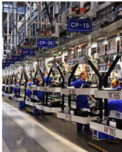
Provoz společnosti Mobis Automotive Czech v Nošovicích.

Poslední krok k cíli udělalo ostravské zastupitelstvo, které 14. října schválilo text kupní smlouvy na pozemky v zóně, který zohledňuje postoj Evropské komise. Brusel totiž odmítl záměr prodat strategickému investorovi pozemky o celkové výměře okolo 18 hektarů za zvýhodněnou cenu 1 Kč za m 2 , to znamená za zhruba 180 tisíc korun. Podle nového znění smlouvy česká „dcera“ jihokorejské společnosti Hyundai Mobis Co., Ltd. odkoupí pozemky