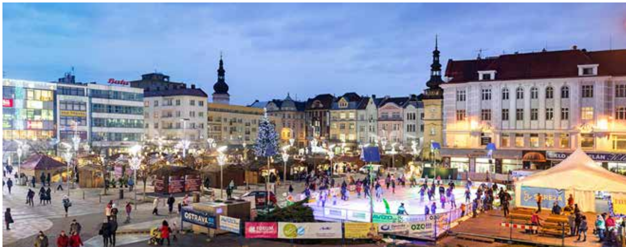
Vánoční kluziště a trhy v centru Ostravy přilákají ročně tisíce lidí

OSTRAVA-PORUBA. Tradiční vánoční jarmark začne 11. prosince v 16.30 h na Alšově náměstí. Každý následující den je o zábavu také postaráno, vystoupí řada souborů, divadelních spolků, bude se promítat pro děti. Jarmark skončí 22. prosince programem od 16.30 h. Obvod také pořádá setkání porubských seniorů 1. prosince