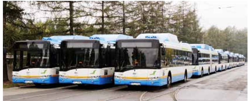
Nové autobusy na CNG v dílnách Dopravního podniku Ostrava v Martinově

Slavnostního uvedení do provozu nových autobusů a plničky CNG se zúčastnili náměstek primátora Ivo Hařovský, náměstek ministra životního prostředí Vladimír Mana a další hosté. (bk)