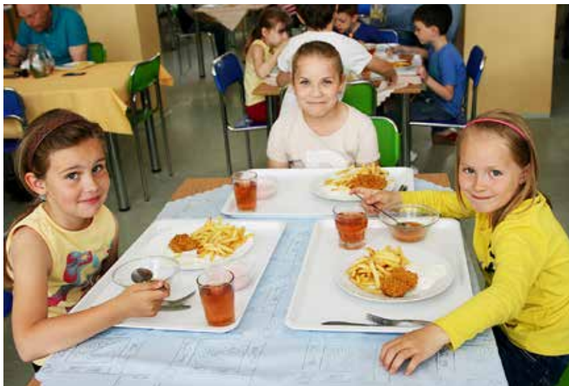
Ve školní jídelně ZŠ Bohumínská dětem chutná

Porotci vyzvedli také skutečnost, že pro svoji kampaň s názvem Školní jídelny zdravé a chutné ostravský magistrát získal řadu odborníků a navázal spolupráci s dalšími partnery, například Krajskou hygienickou stanicí, Českou školní inspekcí či Divadlem loutek Ostrava. Symbolickou cenu – křišťálovou desku s pamětním listem – převzali zástupci Magistrátu města Ostravy na mezinárodní