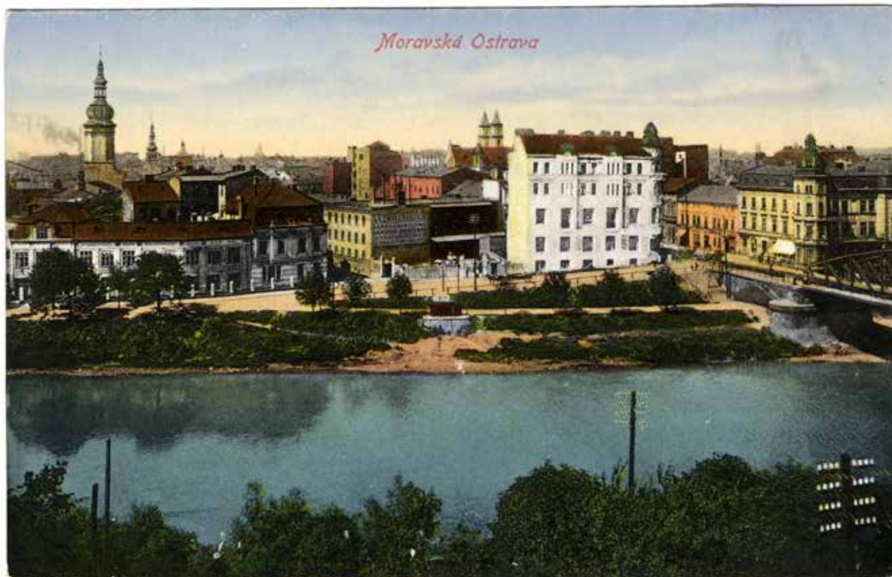
Heblingova tiskárna na Havlíčkově nábřeží (dům se šedou fasádou vlevo) na pohlednici z počátku 20. století