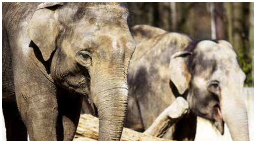
Ilustrační foto: Zoo Ostrava

Calvin patřil v Evropě mezi nejspěšnější samce. Během svého života zplodil 14 mláďat, z nichž 11 přežilo. Dvě z nich – samičky Rashmi a Sumitra – jsou v Zoo Ostrava. (k)