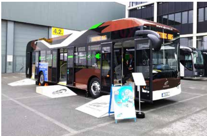
Ostravský elektrobus na dopravním veletrhu v belgickém Kortrijku