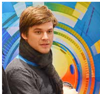
Vojtěch Dyk, oblíbený divadelník a filmový herec, zpěvák kapely Nightwork, se ujme zodpovědné role patrona družstva České republiky.