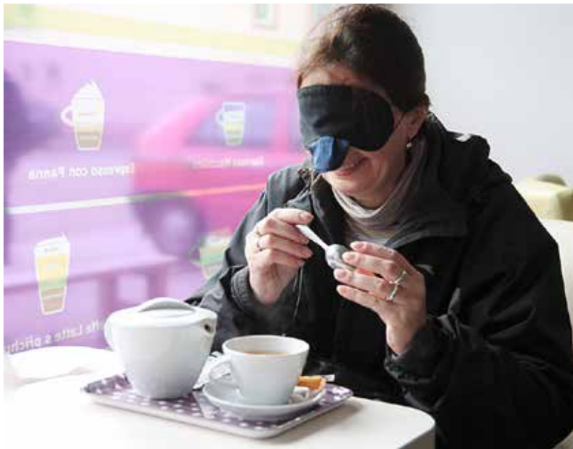
Vyzkoušet si, jak chutná káva nevidomým, můžete během listopadového Týdne rané péče pořádaného Společností pro ranou péči.