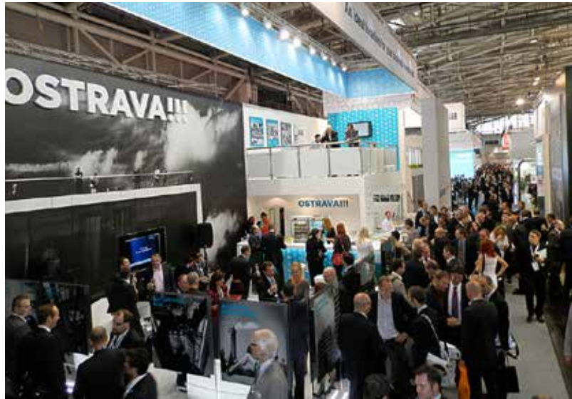
Stánek Ostravy na Expo Real v Mnichově, dějiště řady schůzek a jednání

Primátor Ostravy Petr Kajnar k účasti na Expo Real poznamenal: „Město hodlá nadále podporovat zejména strategické průmyslové zóny. Jejich rozvoj pomůže ke vzniku nových pracovních příležitostí. V zóně Hrabová bylo do letoška vytvořeno více než 6 200 přímých pracovních