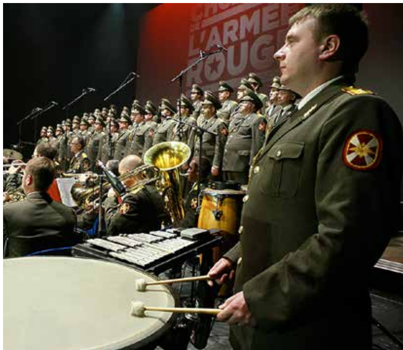
Do Ostravy míří pěvecký sbor Rudoarmějci, jehož hostem bude zpěvačka Helena Vondráčková.