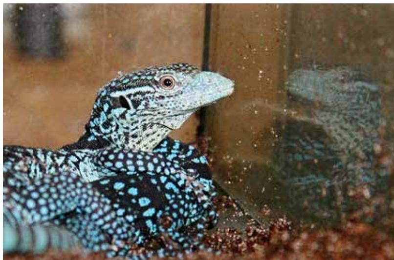
Varani modří se mají v ostravské zoo čile k světu.

v roce 2001. O jejich početních stavech se mnoho neví. Může patřit ke kriticky ohroženým druhům. Velmi vzácně se chová v zoologických zahradách, odchovy mláďat jsou spíše raritní. O to více si úspěchu v ostravské zoo cení. (šk)