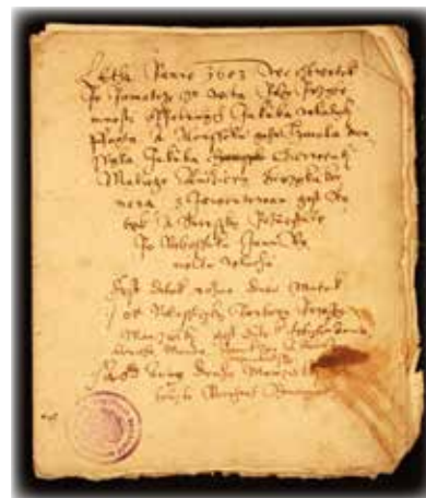
Pozůstalostní inventář kamenického mistra Vlacha Jana Rinolta (1603).