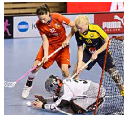
Česká republika bude v Brně a Ostravě obhajovat světový bronz, který děvčata vybojovala před dvěma lety na šampionátu ve Švýcarsku.