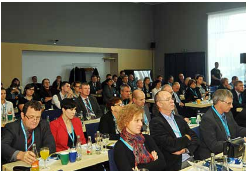
Pohled do pléna konference Ovzduší 2013 pořádané posedmé městem Ostravou jako příspěvek k řešení problematiky životního prostředí v regionu.

Záchraný tým ČČK Ostrava pomáhá lidem při povodních, byl v Troubkách, Mělníku či Novém Jičíně. Právě pomoc při živelných katastrofách patří k nejsilnějším zážitkům jeho členů. A co je těší? Určitě pořízení profesionálně vybaveného sanitního vozu, který umožňuje ještě rychlejší a efektivnější první pomoc. (ph)