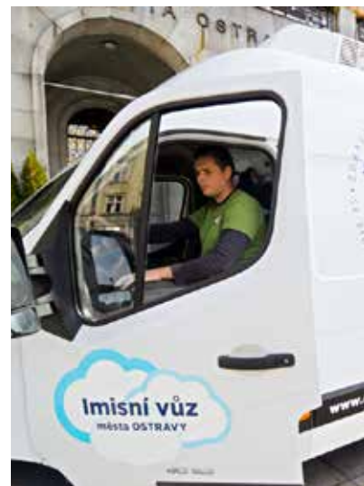
Imisní vůz města Ostravy