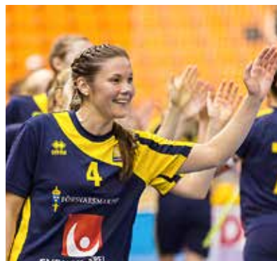
Švédské florbalistky, pětinasobné mistryně světa, jsou favoritkami prosincového turnaje, který uvidí moravská metropole Brno a moravskoslezská Ostrava.

To je slogan devátého mistrovství světa. Zatímco Ostraváci dojedou do ČEZ Arény městskou hromadnou dopravou, autem nebo třeba i dojdou pěšky, na české i zahraniční fanoušky čeká zájezd do Brna a Ostravy typu all inclusive s bohatými sportovními i společenskými zážitky. Florbal v nejluxusnějším balení nabídne prosincový světový šampionát v České republice! (vi)