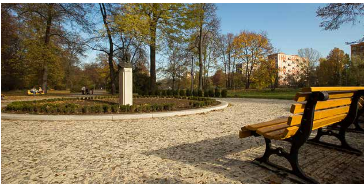
Pomník s bustou Jana Amose Komenského a okolí za Novou radnicí jsou po rekonstrukci a modernizaci ozdobou největšího ostravského sadu, který nese od roku 1919 jméno učitele národů.

Dvě etapy Revitalizace Komenského sadů probíhající v loňském a letošním roce jsou u konce. Po zvládnutí první fáze stavebních prací ve střední a zadní části areálu byla letos v dubnu zahájena druhá etapa, během které stavbaři modernizovali společensky atraktivní a frekventovanou vstupní část sadů od mostu Pionýrů, za Novou radnicí až po bustu Jana Amose Komenského.