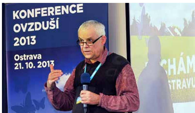
Bývalý předseda vlády a europoslanec Vladimír Špidla hovořil na konferenci Ovzduší 2013 o trvale udržitelném rozvoji a snižování energetické náročnosti.

Během zimního období mohou řidiči získat informace o sněhovém zpravodajství a sjízdnosti silnic na webových stránkách společnosti Ostravské komunikace www.okas.cz nebo na stránkách www.dopravniiinfo.cz . (jm)