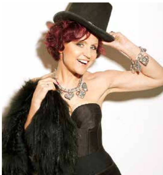
Patronkou koncertu Všechny barvy duhy je česká propracovaná legenda Petra Janů.

Vstupenky v ceně 150 Kč lze zakoupit v předprodeji NDM na ul. Čs. legií nebo v divadle před začátkem koncertu. (rw)