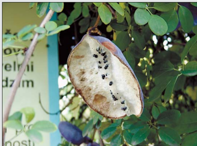
Vzácný plod liany akebia quinata, která roste v zoo

Nejen zvířata jsou v zoo k obdivování, je tu řada pozoruhodných rostlin. V těchto dnech dozrává plod popínavé dřevité liany z východní Asie s odborným názvem akebia quinata. Je to léčivka, pomáhá proti zánětům,