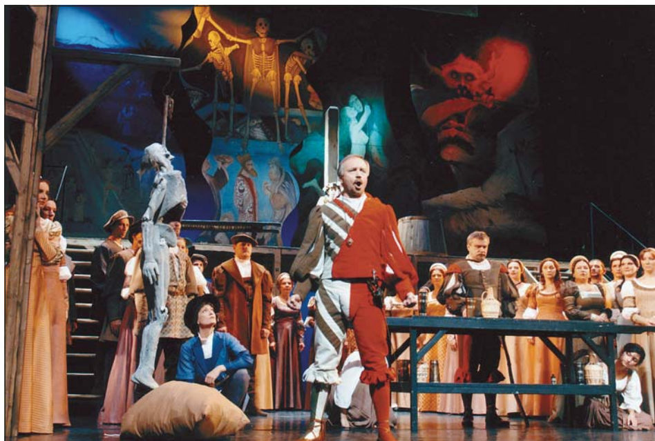
Z opery Faust Charlese Gounoda v ostravském Divadle Antonína Dvořáka

Svížným krokem vstoupilo Národní divadlo moravskoslezské do nové sezóny. Poslední zářijový víkend připravilo pro své návštěvníky premiéru operní lahůdky – Faust skladatele Charlese Gounoda ve francouzštině. Generace už dlouho okouzljuje nádhernou hudbou i známým příběhem doktora Fausta, který pro světské rozkoše upíše svou duši ďáblu, aby mohl být znovu mladý. Divadla se k této romantické melodické opeře vrací často, znalci oceňují i Valpuržinu noc – bohatou choreografií.