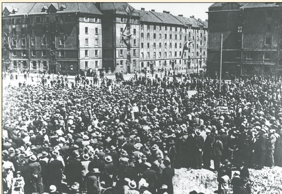
Tábor lidu na Senném trhu 15. 10. 1918