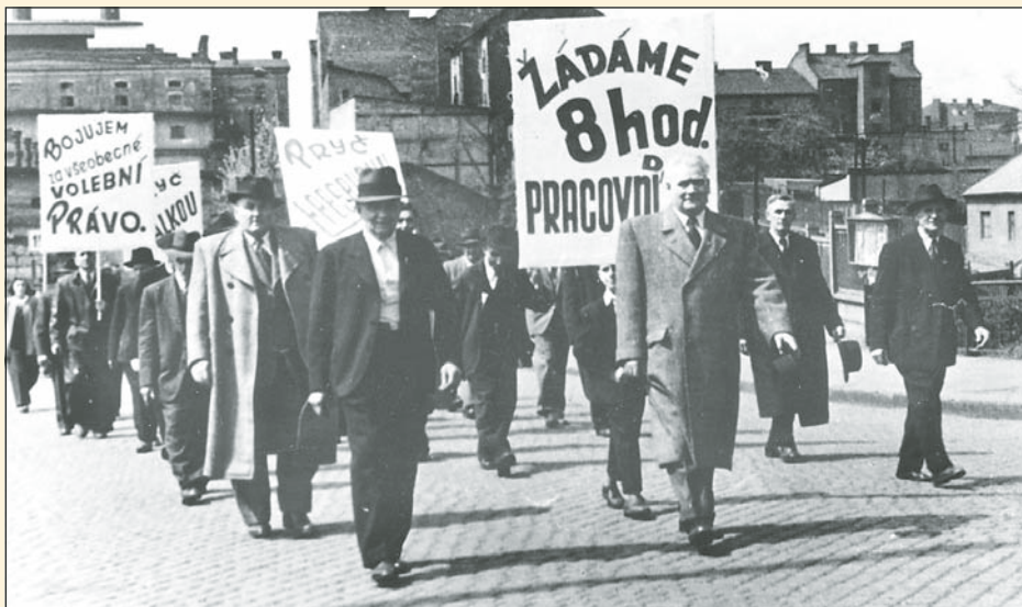
Manifestační průvod ze Senného trhu za vznik čs. státu, sociální a politická práva 15. 10. 1918

Hnutí odporu se pak rozšířilo do Hulvák, Mariánských Hor, Přívozu a Moravské Ostravy. V Přívoze byli vojáky zastřeleni další dva de-