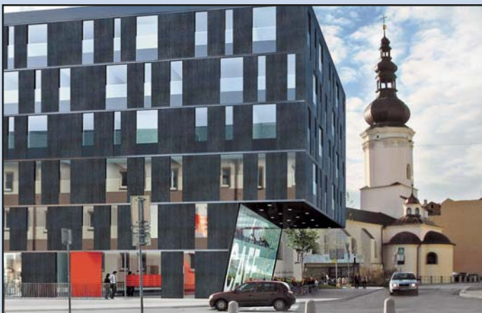
Vizualizace bytového domu Městská brána