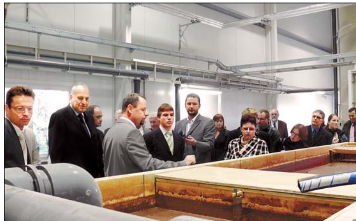
Ministr průmyslu a obchodu Martin Říman a další hosté při zahájení provozu dekontaminační stanice v areálu ropných lagun Ostramo si prohlíží usazovací nádrže

Vlastní likvidace ropných látek z lagun začala letos v červenci. Po odtěžení a smíchání s vápnem a uhlíkem vzniká pevné palivo vhodné k energetickému spalování. První stovky tun jsou zatím uloženy v areálu. O speciální směs mají zájem společnosti ČEZ, Energetika Trinec nebo polská firma