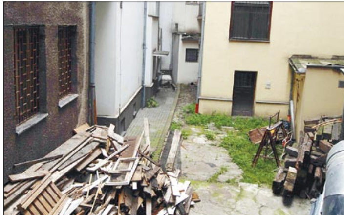
I takto vypadají některé městské dvory...

„Samozřejmě, že i náš dvůr vypadal dříve dost děsivě. Vše se začalo měnit v době, kdy začala sou-