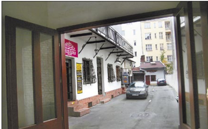
Dvůr s menšími obchody musí být stále udržován

Chtěli jsme na kafe. Setkání po letech takový rituál vyžaduje. Vešli jsme do jedné z restaurací v centru Ostravy a zadním východem vstoupili do příjemné restaurační zahrádky. Na kafe jsme v tu ránu zapomněli. V němém úžasu a obdivu jsme zírali na kvetoucí durmany a opuncie, řadu dalších rozkvetlých keřů a nádherný, udržovaný zvlněný trávník zaplňující značnou část typického uzavřeného dvora, jaké jsou ve staré městské zástavbě.