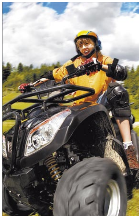
Jízdy na čtyřkolce jsou žádané

Programové tipy jsou rozděleny na několik oblastí. Pod titulem „Adrenalin“ si můžete dopřát například nezapomenutelnou jízdu truck trialovým speciálem Tatra 813 se zkušeným pilotem na trati ostravského polygonu nebo též