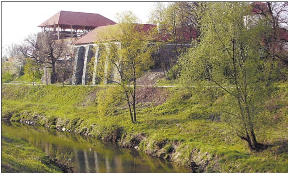
Lučina pod Slezskoostravským hradem už také není bahnitou stokou

Konec 20. století znamenal obrat. Větší péče o životní prostředí, přísnější normy na čistotu vod i ovzduší a používání moderních technologií vrátily mnoha řekám jejich původní, přírodní podobu. Místo staré Vratimovské papírny na horním toku Ostravice před městem vyrostl nový, technologicky moderní papírenský závod Biocel s čističkou odpadních vod. Také splaškové vody ústící do řeky dnes procházejí čističkami, které byly vybudovány ve větších městech kolem toku. Dnes je Ostravice řeka plná života – dobře prokysličená, s obnovenou faunou a flórou. Velkým přínosem pro řeku bude další odkanalizování některých malých vyústění a jejich svedení do ústřední čističky vod v Ostravě-Přívoze. Zbytkové znečištění dna zmizí mechanickými prostředky, řeka samotná má velkou samočisticí schopnost. V létě už není neobvyklé vidět na travnatých březích řeky v centru města opa-