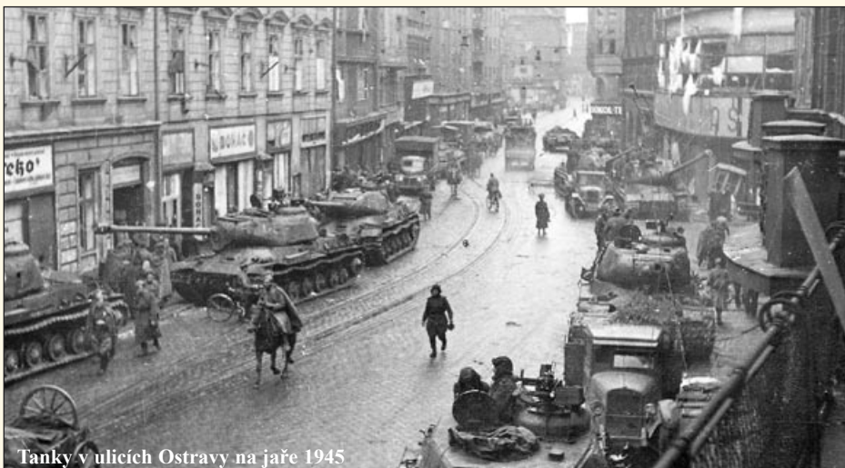
Tanky v ulicích Ostravy na jaře 1945

Když pomineme hornické a hutnické učiliště založené r. 1716 císařem Karlem VI. v Jáchymově, začala se historie Vysoké školy báňské odvíjet 12. 11. 1849, kdy byla slavnostně otevřena Báňská akademie v Příbrami. Posluchači ani profesori však nebyli v malé Příbrami spokojeni a snažili se o přemístění školy do Brna nebo Prahy. Tyto snahy přerušilo vypuknutí druhé světové války a uzavření všech vysokých škol 17. 11. 1939. Po osvobození byla činnost školy počátkem června 1945 obnovena a v září, po 97 letech své existence, přemístěna do Ostravy především kvůli možnosti doplňování teoretické výchovy praktickou činností v moderních ostravských průmyslových závodech. Do prvního ročníku nastoupilo v říjnu 1945 celkem 321 studentů. Hutnická fakulta nalezla své sídlo v bývalé obchodní akademii na rohu ul. Sokolské a Českobratrské (nyní sídlo Ekonomické fakulty VŠB). Hornická fakulta získala budovu bývalého Učitelského ústavu ve Slezské Ostravě. První koleje a menza se nacházely v bývalém hotelu Royal na Reální ul. (dnes menza Ostravské univerzity). Až do r. 1959, kdy byl zřízen pedagogický institut, byla VŠB jedinou vysokou školou v Ostravě.