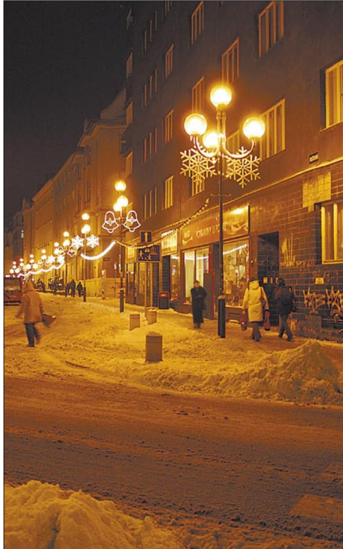
Ulice Poštovní v centru Ostravy patří k nejhezčím.

POLANKA. Už tradiční vánoční stříbrnou jedli před radnicí doplní atmosféru v obvodu vánoční výstava, kde se představí zahrádkáři a zruční lidé svými výrobky k vánocům, a to