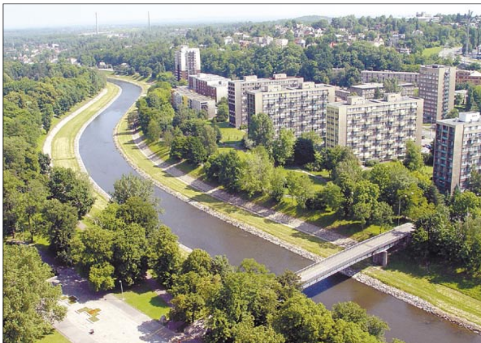
Snímek Ostravice z radniční věže v centru města dokazuje, že řeka je opravdu obklopena zelení

Sanace a rekonstrukce břehů řeky a jejich zpevnění po bývalých důlních vlivech spojené s odvedením odpadních vod se bude týkat pěti kilometrů toku v Ostravě. S dalšími úpravami v rámci humanizace řeky bude celkové ozdravení představovat úsek devíti kilometrů vodního toku městem. Realizace celého projektu počínaje technickou přípravou a vyřízením platných povolení by měla skončit roku 2013. Z hlediska ekologického i kulturně společenského přínosu je to velmi slibný projekt, který Ostravě jen prospěje. (ok)