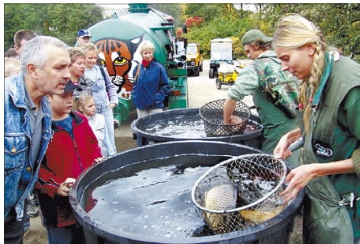
Výlov rybníka v zoo už měl vánoční atmosféru.

V sobotu 3. listopadu se v Zoo Ostrava slavil svátek Halloween. Děti si mohly vydlabat dýni, nadšeně se zúčastnili lampiónového průvodu. Svátek Halloween je spjat s tradicemi a zvyky starých Keltů a znamená „Konec léta“. Slaví se poslední noc keltského roku, začínající západem slunce 31. října a trvající do východu slunce 1. listopadu. Jedná se o noc, kdy předěl mezi světem živých a královstvím mrtvých je nejmenší. Je to nejmagičtější noc v roce, během níž se umístití rozsvícené lucerny vyřezané ze dřeva nebo tykve před vchod do domu nebo přímo do okna. (sd)