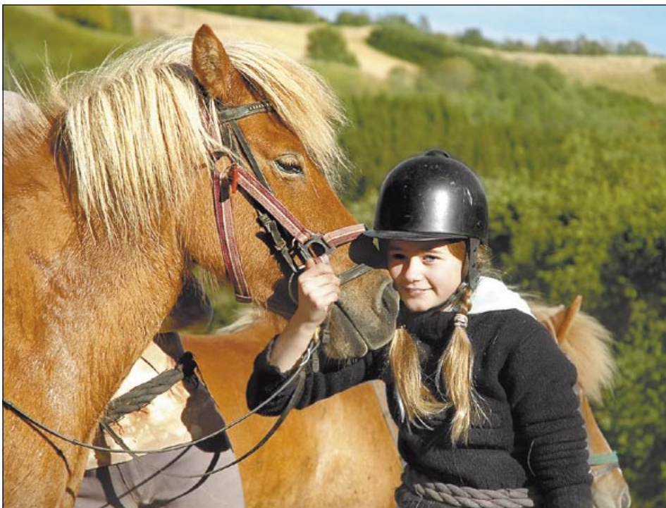
Říká se, že svět je nejhezčí z koňského hřbetu

pronajmout čtyřkolku na uzavřené trati. Rychlá kola mají i malá závodní čtyřkolová vozidla na trati v Mošnově, kde lze trénovat na příštího Schumachera, škola smyku autem na kluzké fólii se provozuje v Ostravě-Prívově. Do adrenalinových zábav patří rovněž paintball a fárání do dolu v hornickém muzeu. Pod titulem „Pohoda“ lze navštívit výrobu mýdla, areál bonsajů s výrobou příslušné keramiky (mohou i návštěvníci), planetárium, špičkovou geologickou sbírku. S profesionálním fotografem se můžete projít za architektonickými památkami a přiučit se fotografování. Vyhlídkové lety, kurzy orientálního tance, romantické večery pro dva ve vybrané restauraci, návštěva pivovaru, jezdeckých farem, výuka lukostřelectví, návštěva lanového centra, šermování, potápění, rafting, skákání na trampolině... Tipů jsou opravdu desítky a každý v nich najde svůj zábavný cíl.