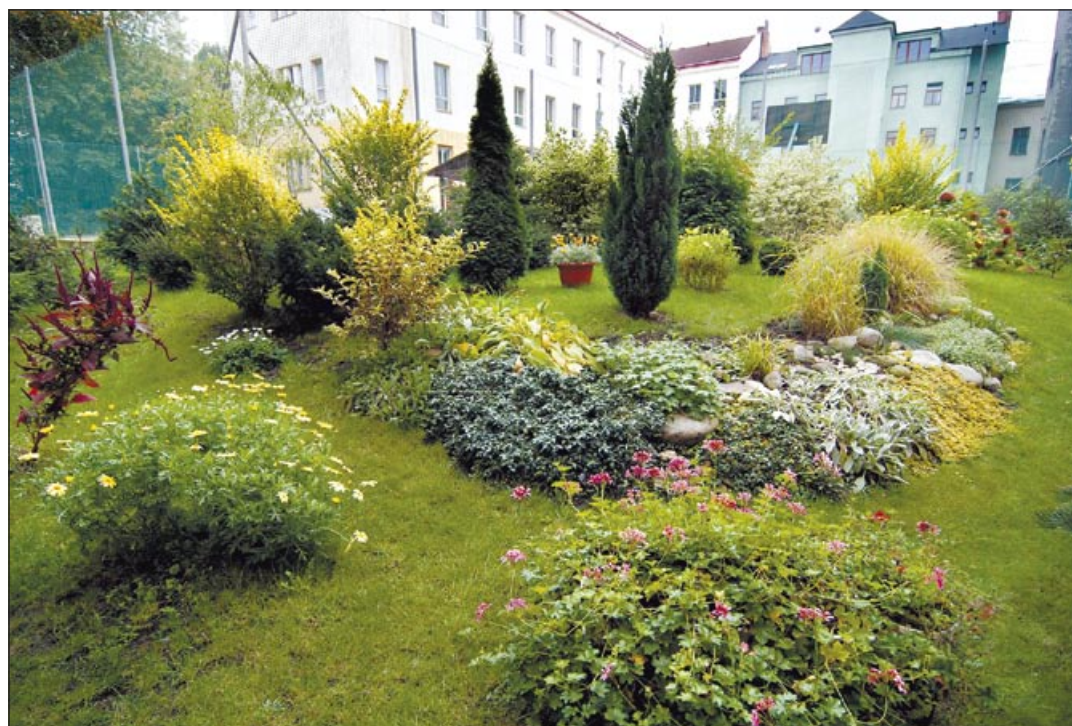
Zahrada, kterou nájemníci vytvořili na dvoře v centru Ostravy, je pastvou pro oči

Nebude od věci vyhlásit například na jaře soutěž o nejkrásnější dvůr. Naším čtenářům přineseme informace v některém z dalších vydání měsíčníku Ostravská radnice. (ok)