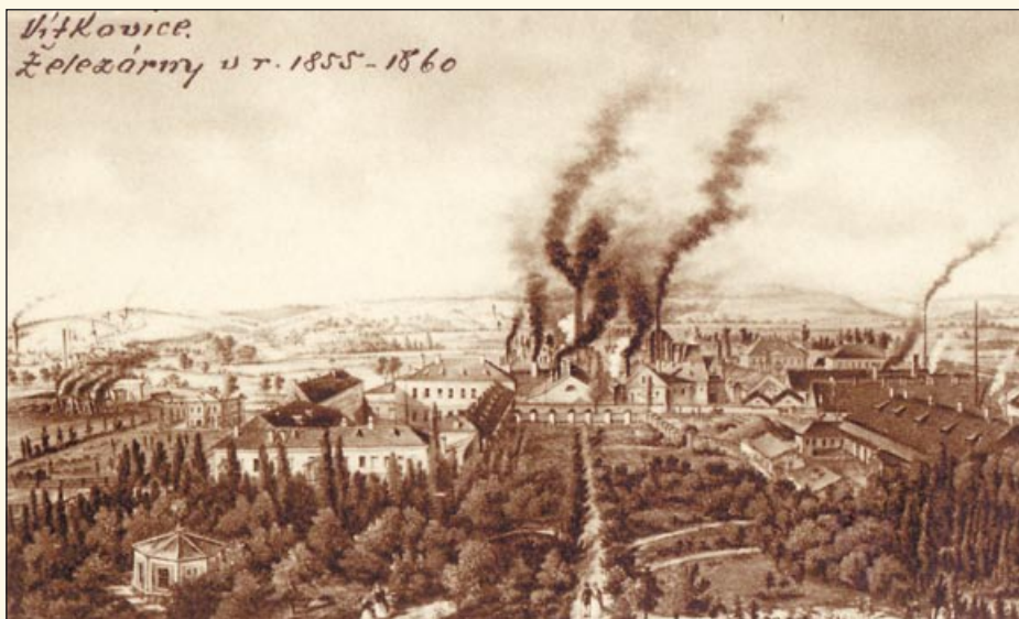
Vítkovice začátku minulého století, kdy byly povýšeny na město

Zrušením poddanství a patrimoniálního systému se obce vymanily z poddanské závislosti,