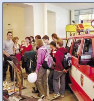
Pozornost přitahuje stará technika, v tomto případě hasičské auto

Desítky návštěvníků se přišly podívat v závěru roku na nový klenot muzea – historický hasičský vůz Tatra NW typ K z roku 1910, který do Ostravy zapůjčilo Technické muzeum Tatra Kopřivnice a který stojí