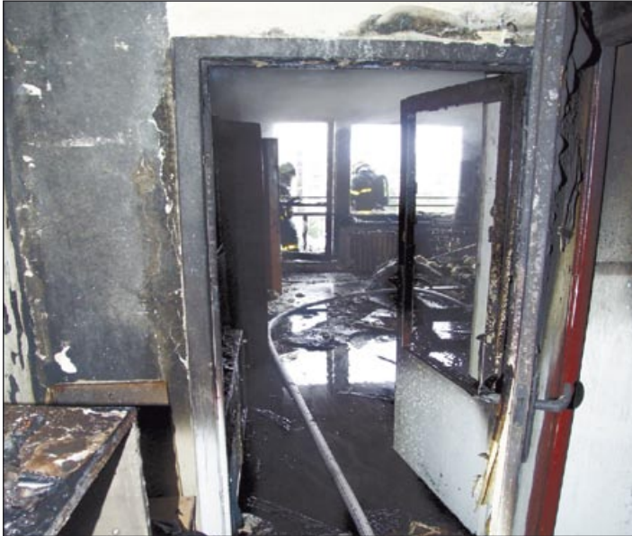
Na vyhořelý byt je opravdu tragický pohled, toho se nechce dočkat nikdo

Zhruba k 800 požárům vyjžděli v loňském roce profesionální a dobrovolní hasiči na území města Ostravy, o rok předtím zasahovaly hasičské jednotky u méně než 700 požárů. Celková škoda, způsobená požáry, činila loni do poloviny prosince 36 milionů korun, za celý rok 2006 přesáhla 39 milionů korun.