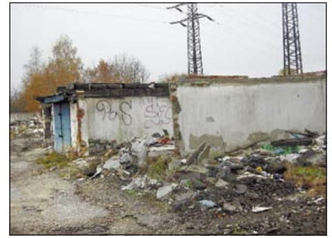
Skutečně neutěšený je pohled na ruiny garáží zavezené navíc odpadem

Dohledaným vlastníkům garáží bylo průběžně nařizováno zabezpečení garáží a provedení údržbových prací. Jedná se o velmi složitou proceduru vzhledem k tomu, že mnohé vlastníky lze těžko nalézt z důvodů neregistrovaného prodeje garáží, úmrtí vlastníků, přestěhování, atp.