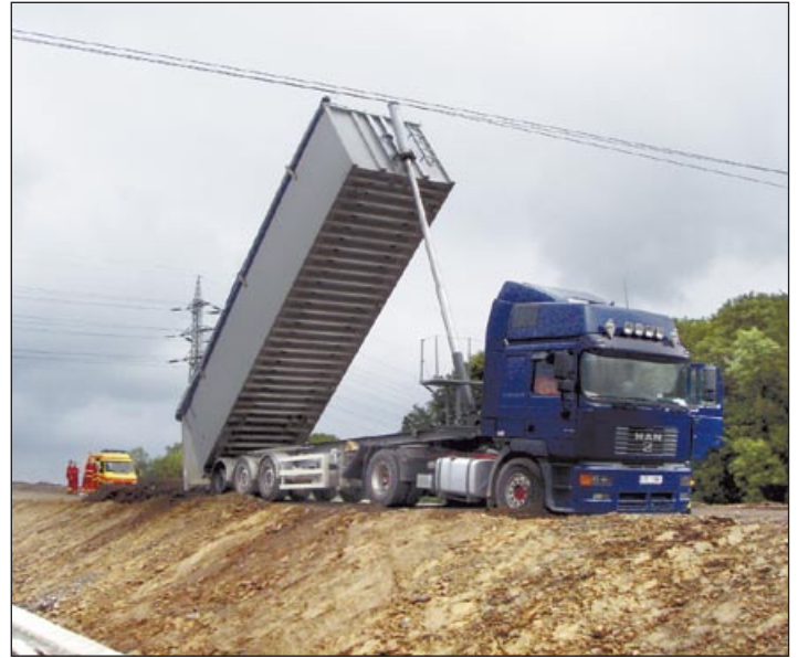
Kontakt vozidla s elektrickými dráty při rekonstrukci silnice stál jeden lidský život

Zvláštní kategorie požárů vzniká každoročně při vaření. Kuchařky například zapomínají na to, že si vaří kávu či ohřívají polévku a důsledkem je hustý kouř stoupající z oken a nasazení hned několika hasičských jednotek, protože nebezpečí rozšíření na celý byt a sousední byty je velké. Podobné nebezpečí hrozí ve skupině méně opatrných seniorů. Poděkování patří těm, kteří na stoupající kouř z bytů neprodleně upozorní na tísňové linky. Když už začne hořet, lepší než zmatené pokusy o uhašení vlastními silami je vždy ihned zavolat hasiče, kteří na území Ostravy dojíždějí k požárům během několika minut a mají potřebné vybavení.