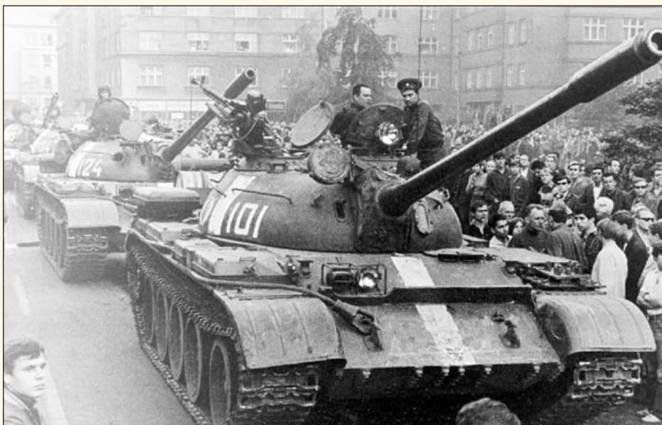
Tanky před Novou radnicí v Ostravě v roce 1968