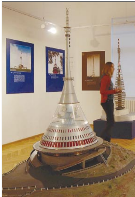
Známa věž na Ještědu je také dílem vítkovických konstruktérů.

Na jaře tomu budou tři roky od doby, kdy bylo Ostravské muzeum na Masarykově náměstí znovuotevřeno po několikaleté náročné rekonstrukci. Historická budova, kdysi sídlo radnice, vyrostla do krásy a dnes patří k nejcenějším objektům města. Vysoko ceněna je i jeho náplň - stále expozice i krátkodobé výstavy k nejrůznějším tématům. Rozsáhlé prostory přímo vybízejí, aby tu návštěvníci našli mnoho pozoruhodného z historie i současnosti Ostravy.