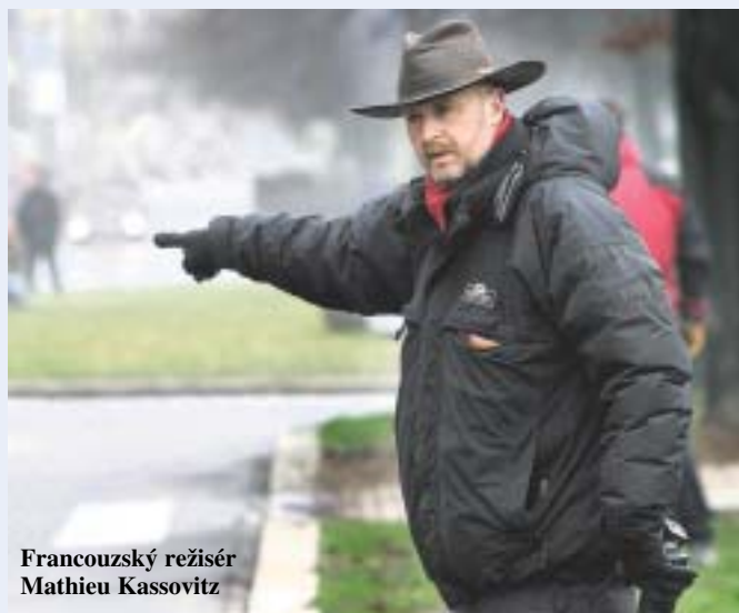
Francouzský režisér Mathieu Kassovitz