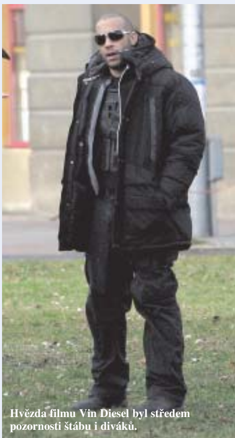
Hvězda filmu Vin Diesel byl středem pozornosti štábu i diváků.

Ostrava se v lednu stala dějištěm natáčení americko-francouzského filmu Babylon A.D. Z Hlavní třídy v Porubě, kde filmaři obsadili na 3 dny kruhový objezd, se štáb přesunul do Dolní oblasti Vítkovic. Zmíněné lokality ožily filmovými efekty a dekoracemi, které přilákaly řadu Ostravanů. Od města si filmaři pronajali rozestavěnou budovu na ulici 28. října, kterou přeměnili tak, aby záběry vypadaly jako z newyorské čtvrti Bronx. Režisérem snímku je Mathieu Kassovitz, jeho hlavní hvězdou slavný hollywoodský herec Vin Diesel známý z filmu Zachraňte vojína Ryana nebo Rychle a zběsile. (s)