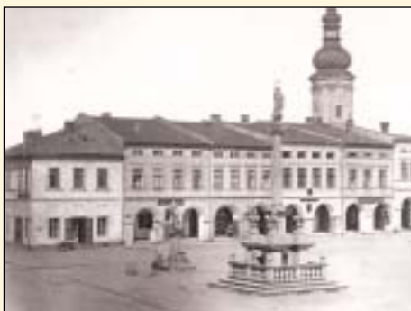
Východní strana náměstí směrem ke kostelu svatého Václava v 80. letech 19. století

Jak připomíná J. Šerka, samotná radnice je nejstarší dochovaná světská kamenná stavba v Moravské Ostravě. První zmínka o ní spadá do roku 1539. Rozlehlou plochu náměstí oživoval od roku 1702 Mariánský sloup. V roce 1763 přibyla socha sv. Floriána jako poděkování tomuto patronovi za záchranu města při ničivém požáru. Ozdobným prvkem náměstí byla také kašna, do níž ústil první městský vodovod (části jeho původního dřevěného potrubí byly rovněž nalezeny při vykopávkách na konci minulého roku). „Kamenná kašna byla v 80. letech 19. století nahrazena kašnou litinovou se sochou ženy, jakési vodní víly či snad Hygie, dcery mýtického léčitele Asklepiea. Ale prostor náměstí byl v první řadě místem střetávání lidí - střediskem obchodu a dalších kulturních a společenských aktivit. Konaly se tu výroční trhy. Až do 19. století zde měly své místo masné krámy, kde fezníci nejen prodávali maso, ale dobytek také poráželi. Připočteme k tomu nejruznější církevní procesí, v pozdějších staletích například hornické prokopské slavnosti a shromáždění u příležitosti návštěv korunovaných