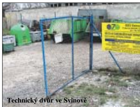
Technický dvůr ve Svinově

Provozní doby na: www.ozoostrava.cz nebo na infolince: 800 100 699