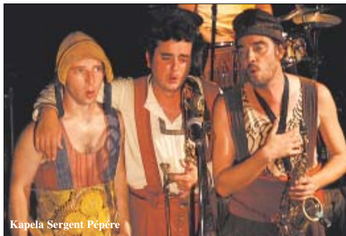
Kapela Sergent Pépère

Společně s veletrhem se uskuteční konference, na které se účastníci budou zabývat historií muzejnictví v Horním Slezsku. V sekcích se bude jednat o navázání konkrétní spolupráce, o publikační činnosti i vzájemně propagaci. Vzniknout by měla společná brožurka s adresami muzeí i kontakty na ně. Projekt je spolufinancován Evropskou unií z Fondu mikroprojektů Iniciativy Společenství Interreg IIIA Česká republika-Polsko. (t)