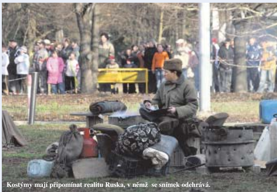
Kostýmy mají připomínat realitu Ruska, v němž se snímek odehrává.