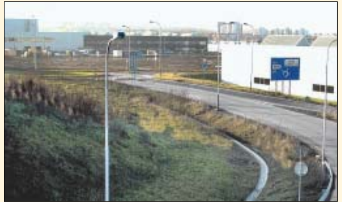
Vytvořená a očekávaná pracovní místa

Na podzim minulého roku zahájila v další části průmyslové zóny zkušební provoz společnost SungWoo Hitech, u níž je předpoklad, že v zóně zaměstná 1 500 lidí. Posledním pří-