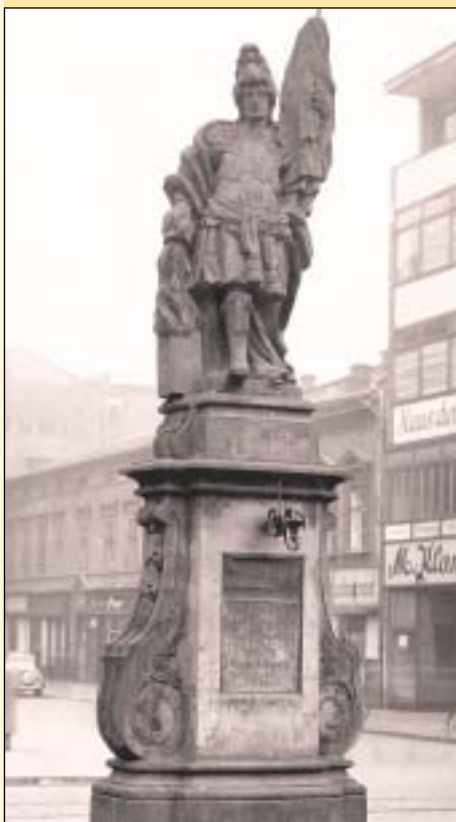
Socha sv. Floriána – měla by se na náměstí opět vrátit.