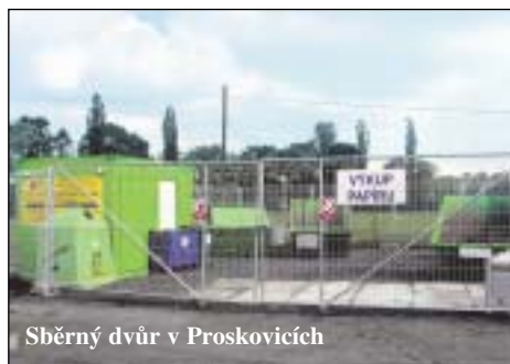
Sběrný dvůr v Proskovicích

* pojízdné sběrné (Ostrava-Jih a Poruba)