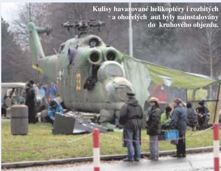
Kulisy havarované helikoptéry i rozbitých a ohořelých aut byly nainstalovány do kruhového objezdu.