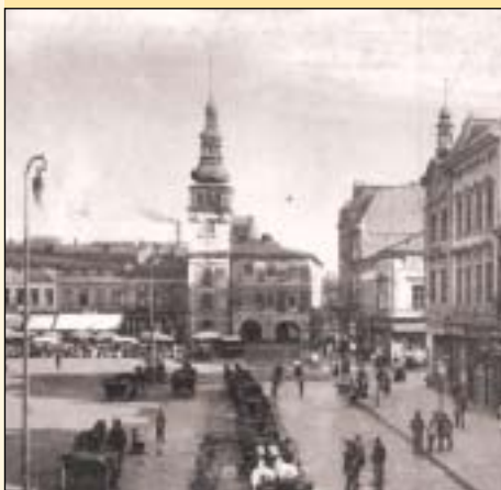
Náměstí po roce 1900, zcela vpravo fronta domů demolovaných v roce 1968

hlav. Všechny tyto akce přitahovaly stovky až tisíce lidí z blízkého i vzdáleného okolí. Není tedy divu, že rozblácené náměstí často připomínalo močál, do něhož přitékaly i splašky z okolních domů, dlouho do novověku neopatřených kanalizací.“ dodává archivář Šerka. Archeologickým průzkumem je doloženo, že povrch náměstí byl už od raného středověku opakovaně zpevňován. Ve 14. století dřevěnou hatí z větví listnatých stromů, později říčním šterkem a valouny. Řádně a důkladně vydlážděn byl však zřejmě až v 19. století. Tehdy se náměstí dočkalo veřejného osvětlení, od roku 1870 plynového a teprve v roce 1900 zde byly instalovány elektrické obloukové lampy.