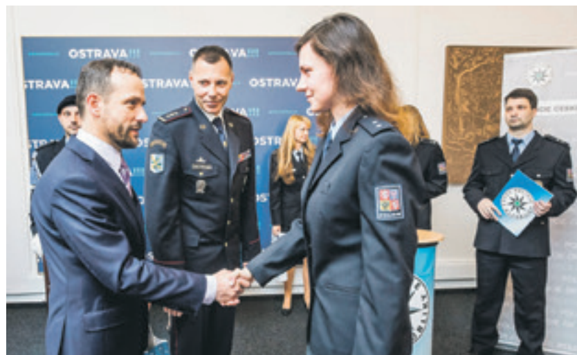
Mezi nováčky v policejní uniformě, kteří si potřásli rukou s primátorem, byly i čtyři ženy

pětiměsíční praxe na jednotlivých útvech. Plnoprávními policisty se stanou po roce. Pokud půjde vše podle předpokladů, devět nových policistů zůstane sloužit v Ostravě. (bk)