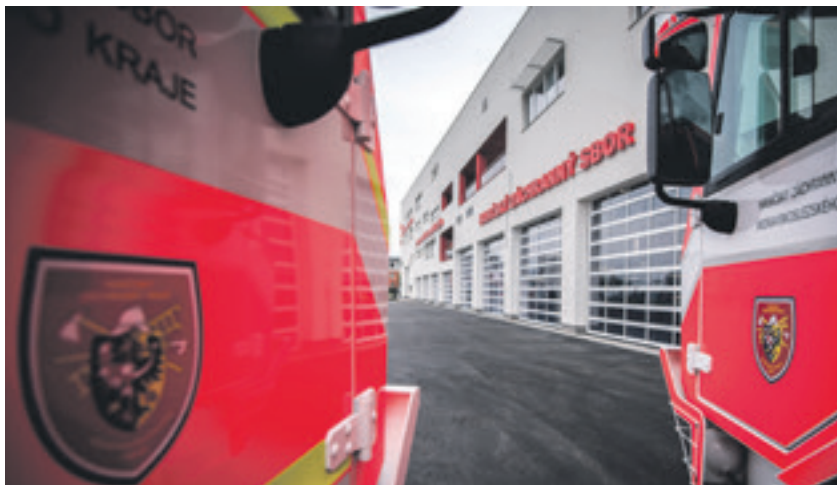
IVC Ostrava-Jih je svým rozsahem a komplexností unikátní nejen u nás, ale i ve střední Evropě

Výstavbu Integrovaného výjezdového centra v Ostravě-Jihu za téměř 250 milionů korun realizoval kraj. Většina nákladů byla pokryta z evropských dotací, 15 procenty se na financování stavby podílel kraj. Stranou nezůstalo město Ostrava. „Z rozpočtu jsme na výstavbu poskytli 11 milionů korun na průzkumné a projekční práce, dalších 7 milionů jsme investovali do rozšíření příjezdové komunikace včetně výstavby chodníků a osvětlení. Stavělo se také na městských pozemcích, které jsme darovali nebo vypůjčili. V dalších letech budeme hradit 59 procent z nákladů na provoz,“ upřesnil 25. dubna při zahájení provozu IVC primátor Tomáš Macura. (bk)