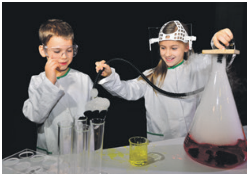
Město podporuje možnost interaktivního vzdělávání ve vítkovickém Světě techniky

na celkovou částku 68,7 mil. korun. Nejzazší termín pro odevzdání žádostí v rámci druhého kola byl stanoven na 6. května. (bk)