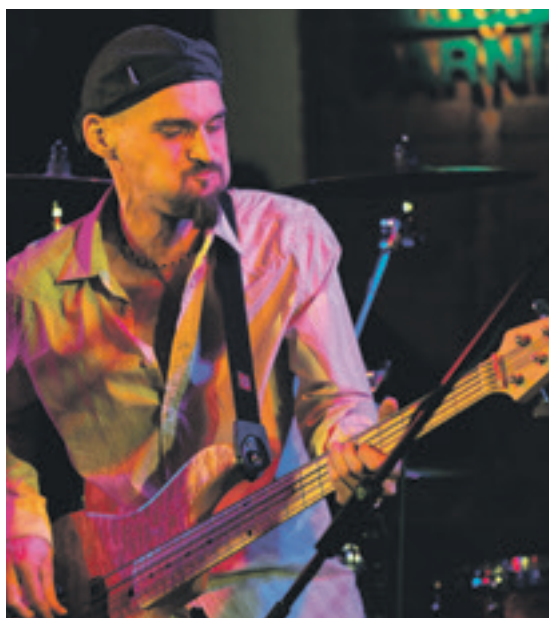
Z koncertu v klubu Parník