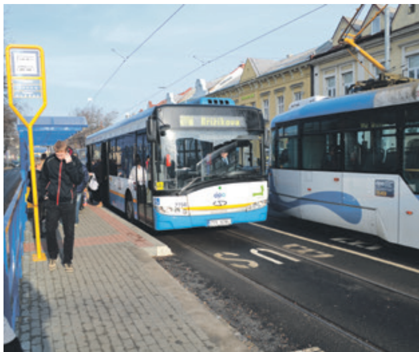
Modernizace zastávky Křižíkova v obvodu Moravská Ostrava a Přívoz byla financována z dotace Programu švýcarsko-české spolupráce.