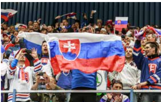
Slovenští hokejisté našli v ČEZ Aréně domácí prostředí