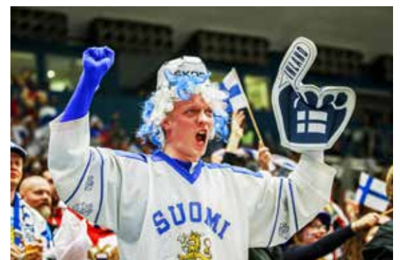
Finové bývají vždy bojovně naladěni