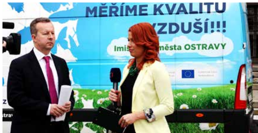
Ministr Richard Brabec si prohlédl měřící vůz města Ostravy