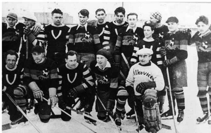
Hokejový oddíl SSK Vítkovice, založený 1. 12. 1929, sváděl ve třicátých letech souboje o titul mistra Slezské župy s SK Slovan Moravská Ostrava. Na společném snímku obou rivalů mají vítkovičtí hokejisté nejstarší sadu černo-bílých dresů s písmenem V na hrudi.

Lední hokej přispíval na Ostravsku také k překonávání etnických bariér a otupoval hrany nacionalismu. První čeští hráči se učili technickým a taktickým základům hry od německých hokejistů ze sousedních měst. Jelikož německé soutěžní mužstvo existovalo v Moravské Ostravě až od roku 1935 a nedosahovalo příliš vysoké úrovně, pročítali si ostravští Němci ve svých novinách výsledky českých celků,