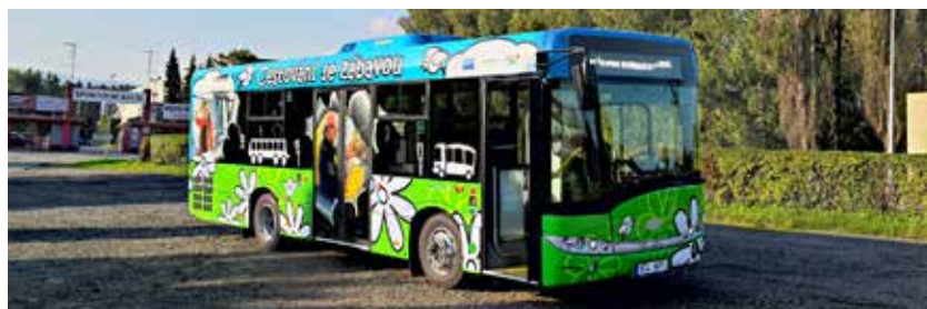
Propagační autobus nepřehlédnete

Propagace veřejné dopravy a ODISbus, jehož vzorem je systém dopravní výchovy v anglickém Birminghamu, má pomoci změnit postoj veřejnosti a zejména školní mládeže k veřejné dopravě. Kampaň se až do června povede