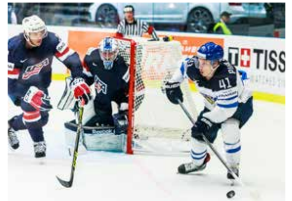
Americké mládí smetlo chladné Finy (USA-Finsko 5:1)