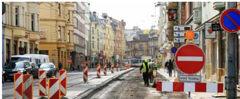
Rekonstrukce Nádražní ulice potrvá do poloviny roku 2016

od Poděbradovy po Nádražní. Třídenní výluka v Nádražní pro převedení provozu tramvají z levé na pravou kolej ve směru na zastávku Elektra je připravována od 12. do 14. června. Za tramvaje bude zavedena náhradní autobusová doprava.