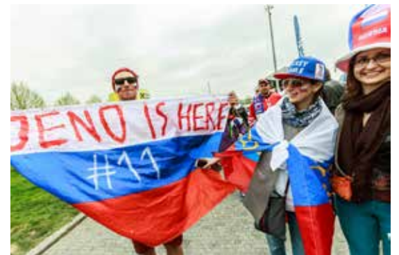
Ruští fanoušci věří v obhajobu titulu mistrů světa

I Ostravané, které nechává hokej chladnými, musí ocenit, jak slušně a vstřícně se hokejoví fanoušci v odlišných dresech k sobě chovají. Na rozdíl od fotbalových výtržníků, se kterými máme v Ostravě své špatné zkušenosti. Sport má přece lidi a národy spojovat, ne dělit. (vi)