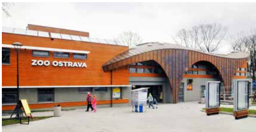
Do zoo projdete novou, stylově navrženou vstupní budovou

obvodových konstrukcí, výměna výplní otvorů (oken, dveří) a zateplení střešních konstrukcí u šesti objektů. Jde o Pavilon velkých šelem, Pavilon safari, objekt karantény, dílny, sklad a tzv. domeček. Projekt bude spolufinancován z Operačního programu Životní prostředí. Celkové náklady činí 18,3 mil. korun vč. DPH, dotace činí 60% přímých realizačních nákladů.