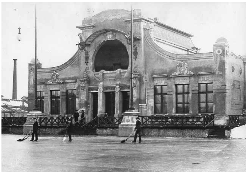
S přírodním kluzištem Moravskoostravského bruslařského spolku poblíž městských jatek se v zimě 1909/1910 pojily první pokusy německých bruslařů hrát lední hokej. Po druhé světové válce byl v Ostravě vybudován Zimní stadion Josefa Kotase (snímek vpravo), který výrazně urychlil rozvoj ostravského hokeje.