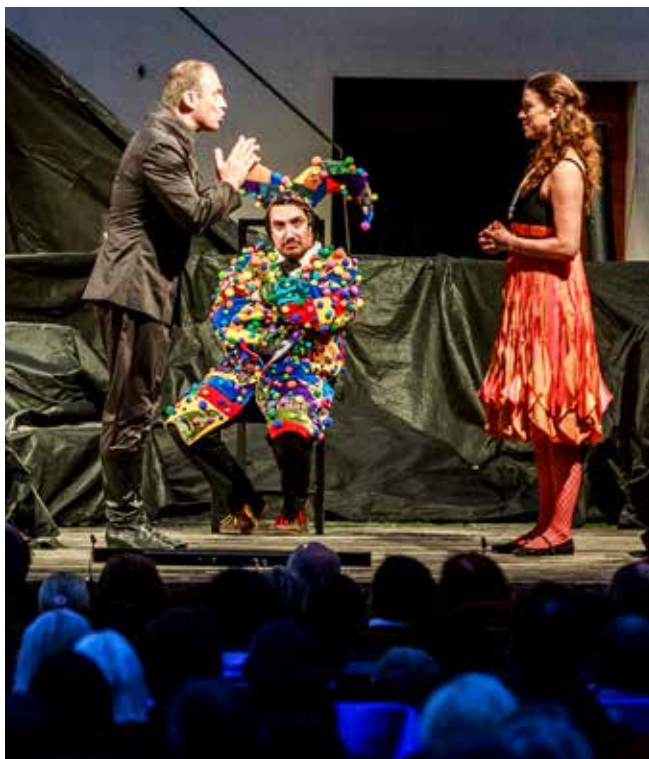
(g) Inscenaci Jak se vám líbí nastudovali ostravští herci

Festival každoročně významně podporuje město Ostrava. Více informací o programu a cenách vstupenek aj. jsou na www.shakespeareova.cz nebo www.ticketportal.cz .