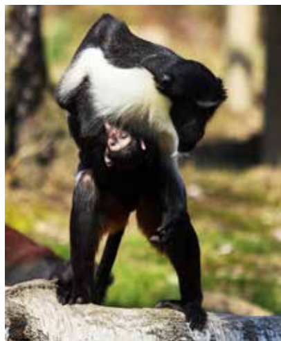
Kočkodan Dianin – matka a mládě jsou dokonale spojeni, jako akrobati...

V dubnu byla také zahájena stavba Snížení spotřeby energie v Zoo Ostrava. Předmětem projektu je zateplení