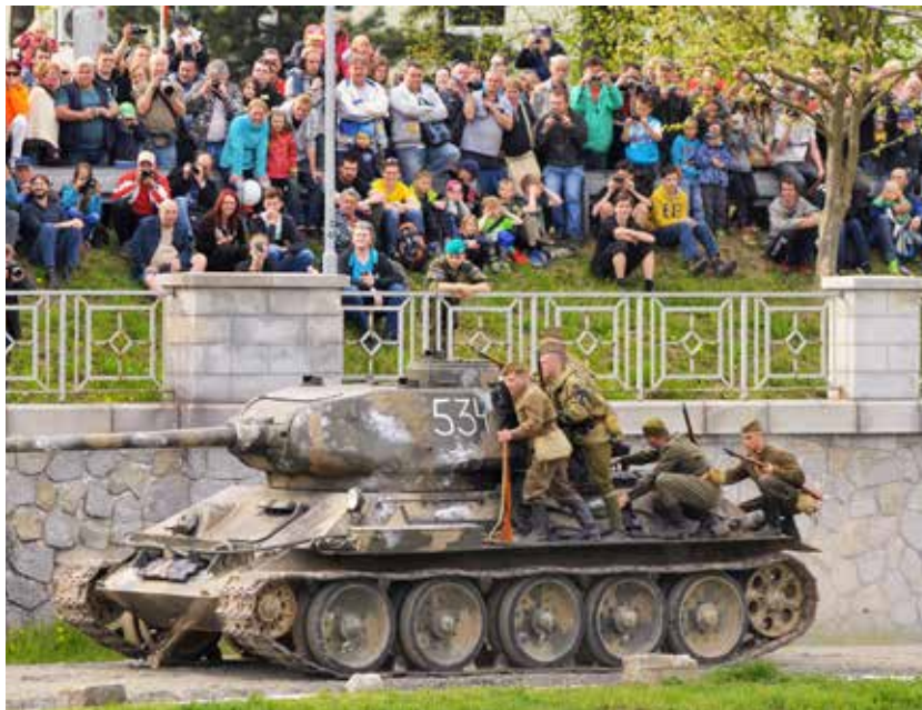
Stejně jako na jaře 1945: osvoboditelé útočí z Moravské na Slezskou Ostravu

Pro nás, generace, které nezažily válku, šlo nesporně o mimořádně působivou a vydařenou atrakci. Z čestných míst ji pozorně sledovali také váleční veteráni. Jen oni sami vědí, jaký