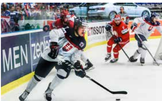
Vítejte v červenomodrobílém peklu! Slovensko-Bělorusko 2:1 po prodloužení.