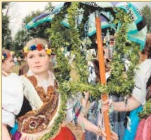
HONĚNÍ KRÁLE. Městský obvod Ostrava-Lhotka pořádá 26. května tradiční lidovou slavnost Honění krále 2007. Akce se koná ve spolu-