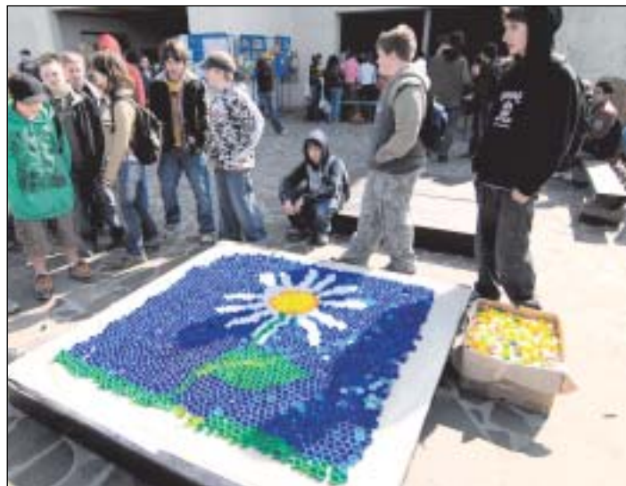
Účastníci Dne Země vyráběli také mozaiky z víček od PET lahví.

Většinu návštěvníků sice tvořily děti, ovšem v programu se nezapomnělo ani na dospělé. Studenti Vysoké školy báňské předvedli v Porubě vývoj solárního a vodíkového pohonu. Zástupci Ostravské univerzity umožnili návštěvníkům vyzkoušet si chemické pokusy nebo se dozvědět novinky z oblasti pěstování pokojových rostlin.