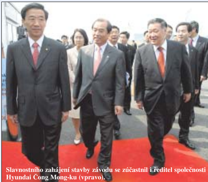
Slavnostního zahájení stavby závodu se zúčastnil i ředitel společnosti Hyundai Čong Mong-ku (vpravo).

V průmyslové zóně vznikne sedm výrobních objektů. Korejská automobilka staví na 200 hektarech. Ze zbývajících 60 ha poskytne kraj část pozemků dvěma subdodavatelům Hyundai, firmám Mobis a Hysco. Ty se budou věnovat stříhání plechů nebo sestavování modulů budoucích