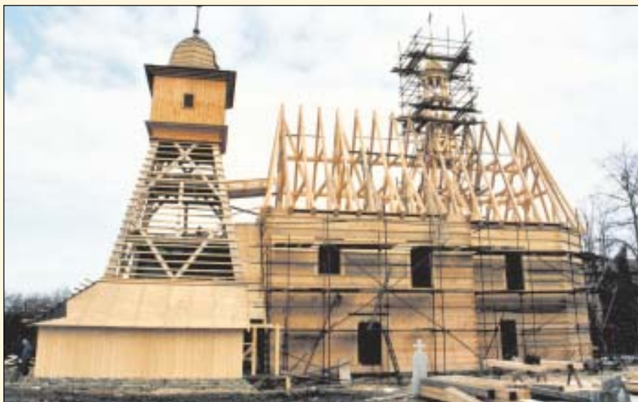
Stavba přesné repliky vyhořelého kostela (16. 3. 2004).

Morové epidemie znamenaly pro Moravskou Ostravu obrovské rány, které znatelně prohloubily hospodářský úpadek města. Negativní vývoj ještě znásobily útrapy třicetileté války a další živelné pohromy v 18. století. Dosud prosperující Moravská Ostrava se změnila na nevýznamné a chudé zemědělsko-řemeslnické městečko. Obrat v tomto nepříznivém vývoji znamenal až rozvoj hornictví a průmyslu v průběhu 19. století. (m&j)