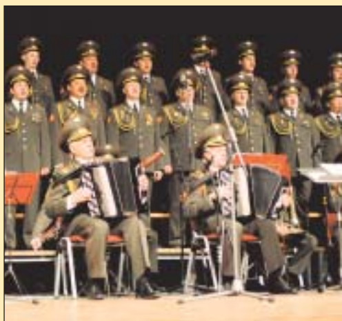
ALEXANDROVCI NADCHLI. Legendární ruský hudební a taneční soubor Rudé armády Alexandrovci,

linka, Podmoskevské večery zazněly árie z Verdiho oper, například Pochod Židů z Nabucca a další.