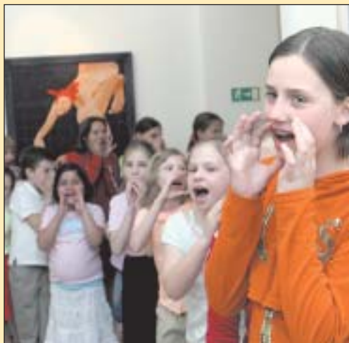
OSTRAVA DĚTEM. Slavnostní zahájení výstavy Ostrava dětem, aneb nejen dětem se uskutečnilo 3. května v Ostravském muzeu. Díla vystavují

kteří se jmenuje podle svého zakladatele A. V. Alexandrova, nadchl 5. května zcela vyprodanou ČEZ ARÉNU. Na pódiu vystoupilo pod taktovkou tří dirigentů padesát čtyři vynikajících zpěváků, třicet pět hudebníků, zatančilo třicet tanečnic a tanečníků. Vedle ruských písní Oči černé, Ka-