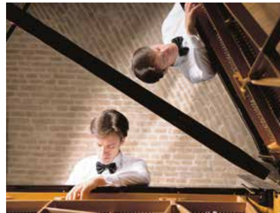
Italský pianista Alessandro Taverna.

V současné době je Alessandro Taverna uznávaným klavíristou, který koncertuje po celém světě. Získal ceny na prestižních klavírních soutěžích. Přestože patří k nejlepším světovým klavíristům, podal si v roce 2010 přihlášku ke studiu inženýrství na univerzitě v Padově. Okomentoval to slovy, že je