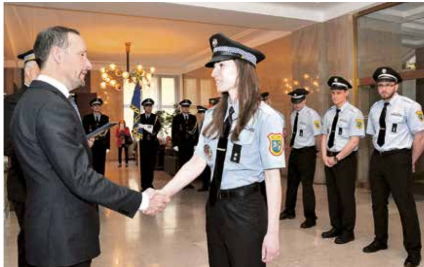
Městská policie byla posílena o dalších sedmnáct žen a mužů.

K městské policii se hlásí lidé různého věku, různých profesí. K tomu,