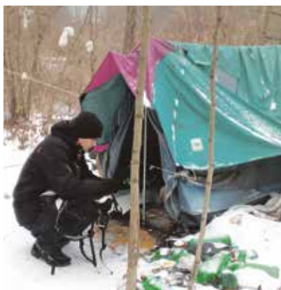
Pro lidi bez přístřeší jsou kritickým obdobím zimní měsíce.

I za lidmi přežívajícími na samém okraji společnosti dochází od začátku tohoto roku terénní sociální pracovníci Charity Ostrava. Klienty nové služby Terénní programy jsou bezdomovci žijící především ve vyloučených lokalitách ve Vítkovicích či Ostravě-Jihu, kteří nevyužívají žádnou ze služeb sociální prevence, jako jsou denní nízkoprahová zařízení či charitní noclehárny. Právě těmto lidem nabízejí terénní sociální pracovníci základní sociální poradenství, pomoc při obstarávání jejich osobních záležitostí, zajištění materiální pomoci a možnost využití návazných sociálních služeb. Smyslem jejich činnosti je podpořit osoby bez