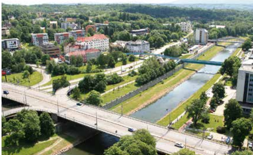
Během opravy mostu Pionýrů po něm nebude jezdit trolejbus 110.

S omezením musí počítat i cyklisté. Podchod pro pěší a cyklisty je na levém (moravskoslezském) břehu uzavřen. Cyklisté úsek objedou po pravém břehu. Obdobně bude uzavřena stezka pro chodce a cyklisty mezi náměstím J. Gagarina a sídlištěm Kamenec. Objížďná trasa vede po ulici U Staré elektrárny. (rs)