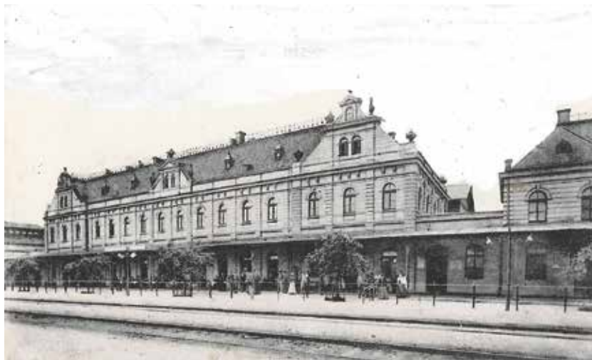
Nádraží ve Svinově na počátku 20. století.