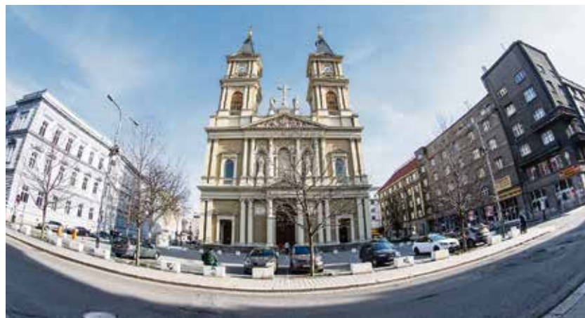
K budoucím investicím patří úprava předprostoru katedrály Božského Spasitele.

občané, dalších 14 pochází od městských obvodů nebo veřejných institucí. Zbývajících 36 pochází od odborníků z pracovních skupin. Jde například o projekt Národního bezpečnostního centra Ostrava, veřejný prostor ve Vysokoškolském kampusu Vysoké školy báňské – Technické univerzity Ostrava nebo „chytrou“ čtvrť u Vozovny v Porubě. Pokračování na str. 3