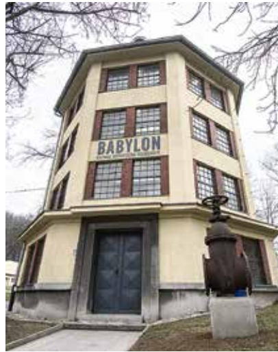
Vodárenská věž, sídlo expozice.

Do Babylonu se návštěvníci dostanou netradičně podzemní štolou, která jej spojuje se strojovnou. I ta prošla