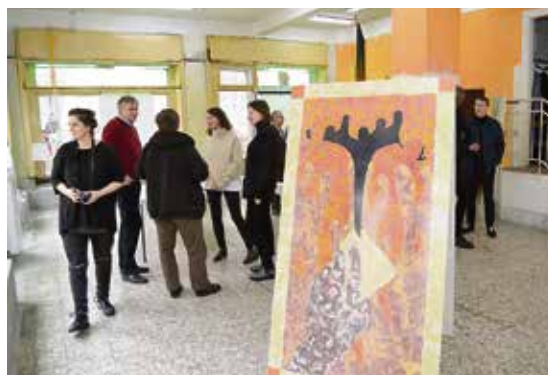
Zahájení výstavy v Českoobrabské ulici.

Galerie Plato našla dočasné zázemí v bývalém obchodě s textilem v Českoobrabské ulici 14, kde vy-