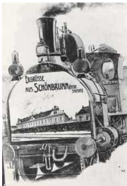
„Pozdrav ze Svinova“ s pohledem na nádraží kolem roku 1900.

na 1848 došlo u Polomí k náhlému zborcení svahu, do kterého narazila lokomotiva osobního vlaku. Při nehodě zahynul strojvedoucí a topič utrpěl vážná zranění. Obdobné problémy jako u Polomí hrozily u obce Slavič, po předchozích zkušenostech zde však tunel zřízen byl. Legenda praví, že byl postaven na přání samotného císaře a další pověst uvádí, že kvůli tomu byl dokonce navršen umělý kopec, ovšem důvodem pro jeho ražbu byly skutečně geologické poměry. Železničnímu