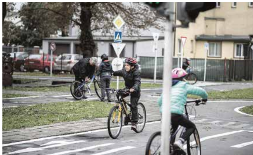
Své zkušenosti v jízdě na kole si mohou děti rozšířit na dětském dopravním hřišti v Orebitské ulici v Přívoze, jehož provozovatelem je městská policie. Hřiště je pro veřejnost otevřeno od 2. dubna do 31. října vždy v pondělí až pátek od 13 do 17 h, v soboty a neděle od 10 do 13 a od 14 do 17 h.