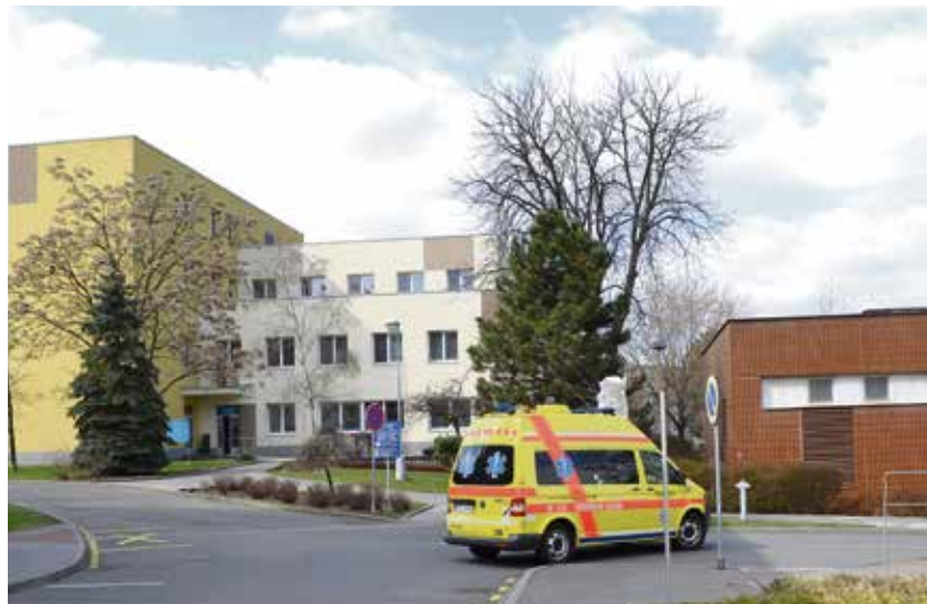
Městská nemocnice projde rozsáhlými úpravami.

Obsahem třetí etapy (2026–2030) je dokončení reorganizace nemocnice. Rozšířena bude geriatric, vystavěna nová patologie, počítá se s úpravou zeleně a zpevněných ploch v areálu. (rs)