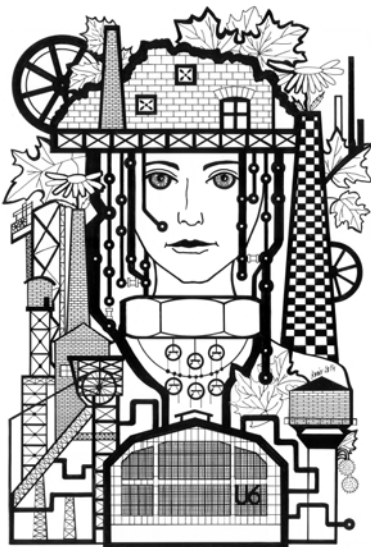
Eva Vítkovického industriálu / Hry na zahradě