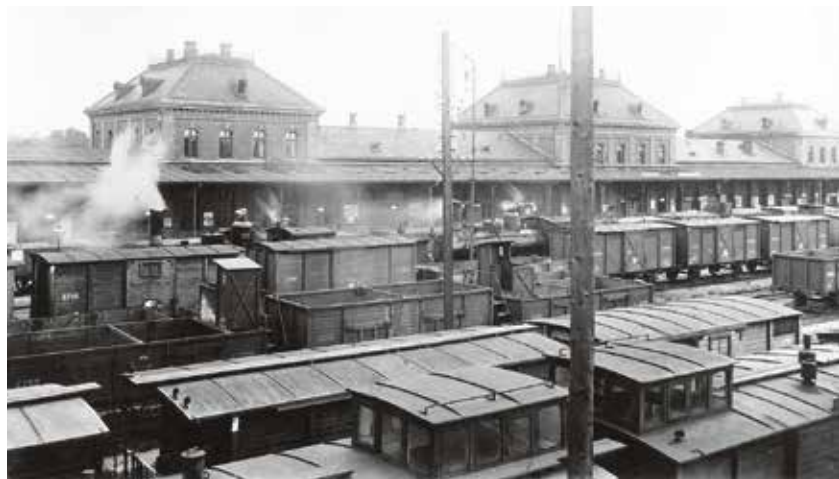
Nákladní vagony společnosti Severní dráhy Ferdinandovy ve stanici Moravská Ostrava (v Přívoze) kolem roku 1900.