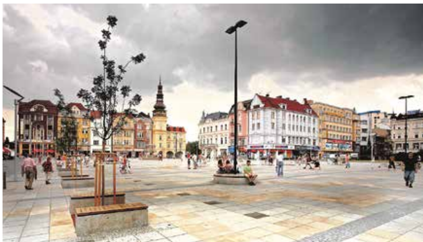
Pokračují snahy o zlepšení životního prostředí ve městě.