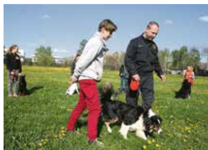
Naučte se zvládat svého psa.

Také letos moravskoslezští policisté zrealizují oblíbený kurz pro mladé psovody KUZMA neboli Kurz zodpovědného majitele městského psa.