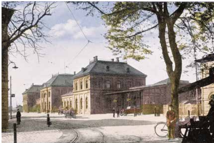
Nádraží v Přívoze na počátku 20. století.

Na úseku z Lipníku do Bohumína se nachází několik mostů, z nichž největší obdiv budí 343 metrů dlouhý a 10 metrů vysoký viadukt s 41 půlkruho-