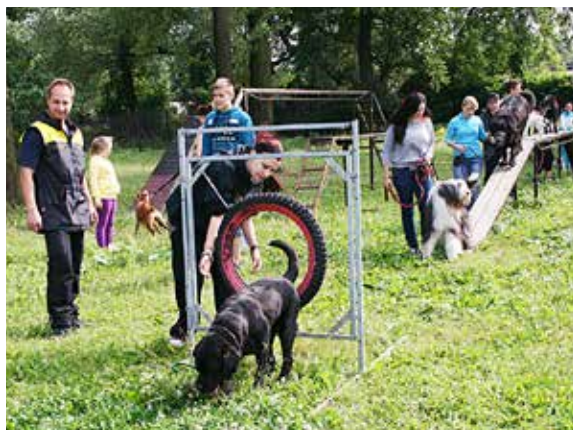
Účastníci kurzů se seznamují s povely a pokyny, jak naučit psa poslušnosti.

Je zdarma, přístupný všem dětem a mládeži ve věku od 12 do 18 let. Nováčkům jsou nápomocni asistenti (absolventi z minulých kurzů), kteří pomáhají překonat prvotní ostych v komunikaci s policisty. V rámci kurzu se účastníci seznamují s policejní prací i názornými ukázkami. Motivací pro mladé psodvůry jsou také následné pravidelné ukázky s policejními psodvůry např.