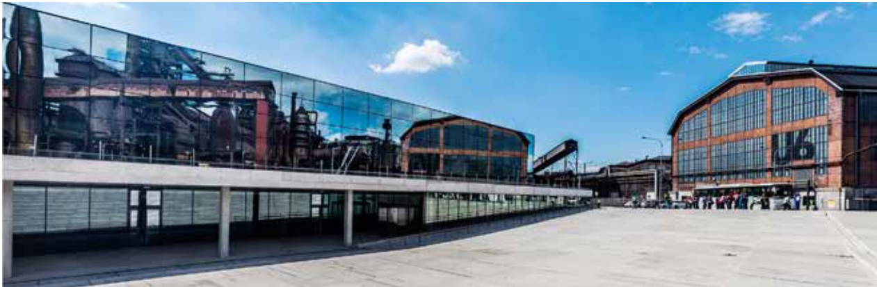
V roce 2014 otevřený Velký svět techniky (vlevo) a jeho menší „bratr“ U6 patří mezi nejvyhledávanější atraktivity Ostravy

Výsledkem náročných prací bude mj. moderní odhlučněná kolejiště, nová nástupiště tramvajových zastávek, chodníky, vozovka. Během prací bude vždy uzavřena pro automobilovou dopravu jedna strana ulice postupně v sedmi úsecích, termíny budou zveřejněny před uzavírkami. Tramvaje pojedou po jedné koleji. Pro pěší bude provoz zachován, v místě překopů vyrostou provizorní lávky, přístup k nemovitostem bude zajištěn. Seznam objízdek najdete na straně 6. (g)