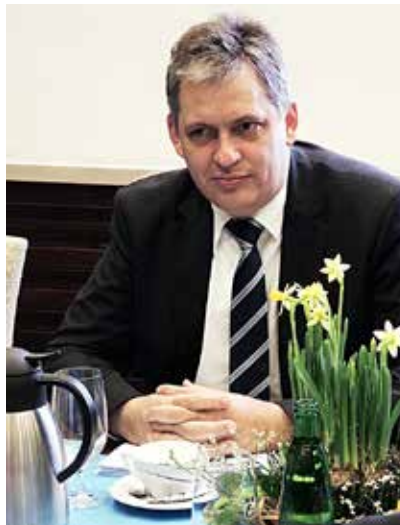
Ministr Jiří Dienstbier při jednání na radnici

Ministr Jiří Dienstbier se při své návštěvě ostravské radnice zúčastnil také zasedání legislativní pracovní skupiny Legislativní mezioborové komise zřízené při Legislativní radě vlády, která projednávala sociální balíček k řešení problematiky ubytoven pro sociálně slabé občany. (bk)