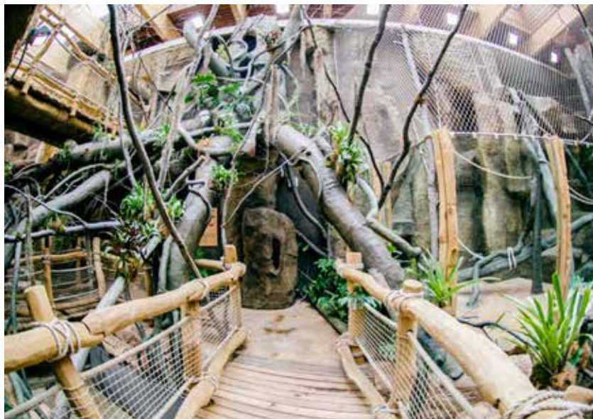
Interiér pavilonu Evoluce je v přírodním stylu a navazuje tak na venkovní výběhy

Velké proměny Zoo Ostrava však nekončí. Hotová je projektová dokumentace nového „bydliště“ pro tygry, kteří teď sídlí ve starých, malých a nevyhovujících