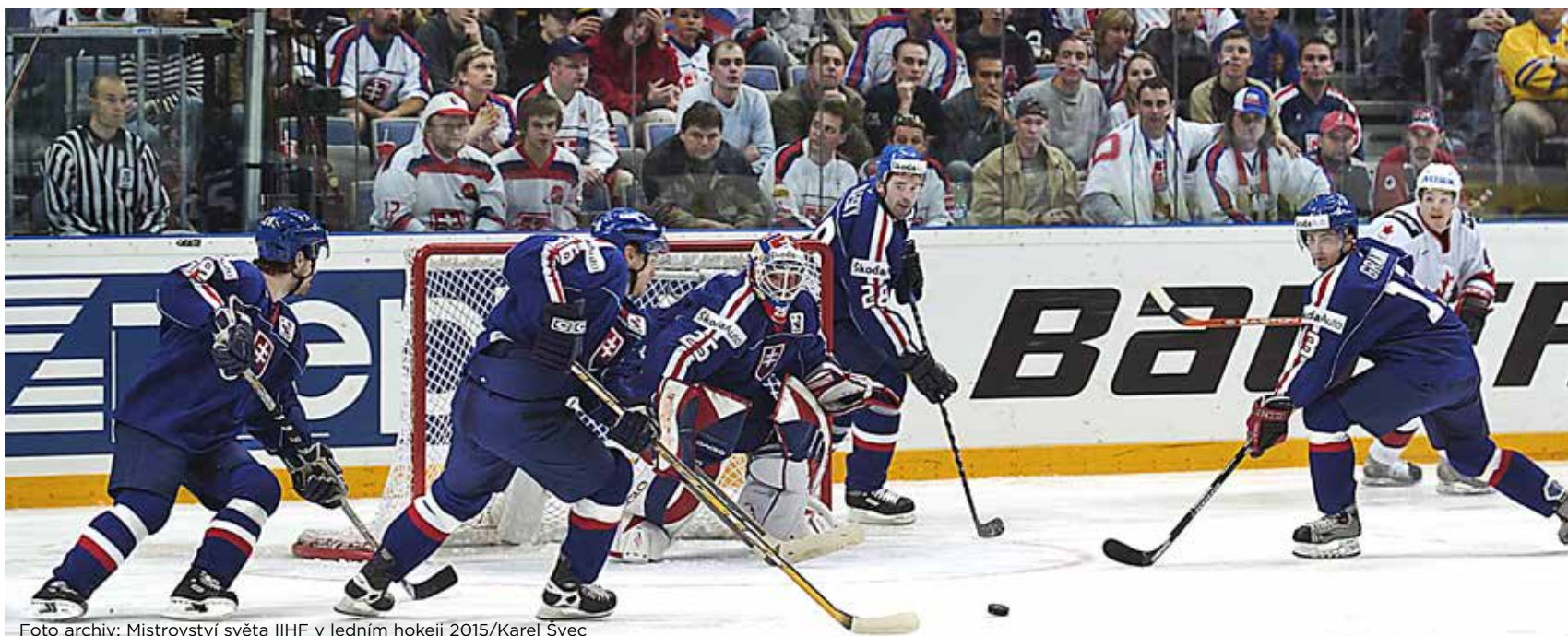
Foto archiv: Mistrovství světa IIHF v ledním hokeji 2015/Karel Švec