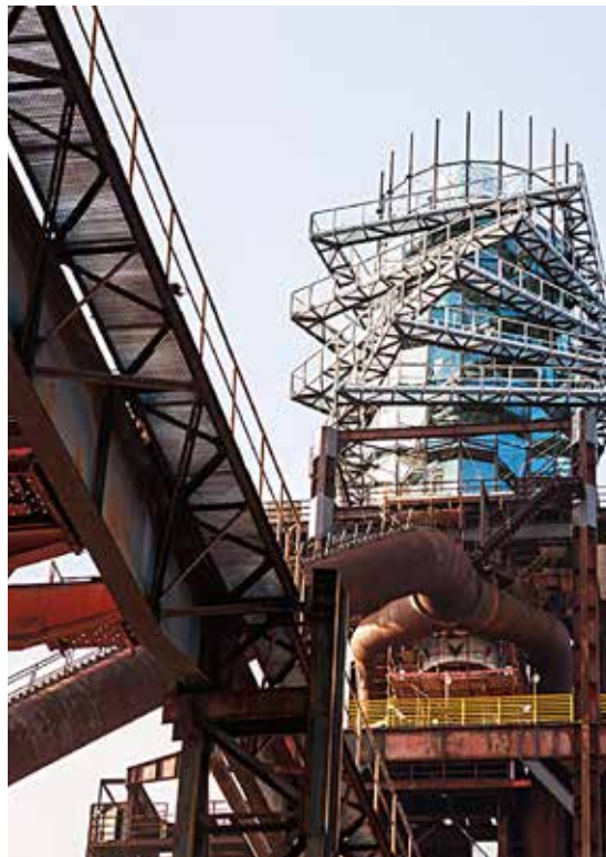
Stezka v koruně pece – tak by se dal nazvat chodník, kterým lze vyjít až do kavárny a vyhlídky nad vysokou pecí. Nebo jet vnitřním výtahem...

plná domácích zvířátek i zrekonstruované sportoviště. Znovu je otevřená cyklostezka mezi Koblovem a Lanekem a na sportovce čekají čtyři venkovní dvorce s novým povrchem, beach volejbal a pétanque. Na 30. dubna je připraven tradiční lampionový průvod po Jantarové stezce od Nové Karoliny až k Vysoké peci č. 1. (ok)