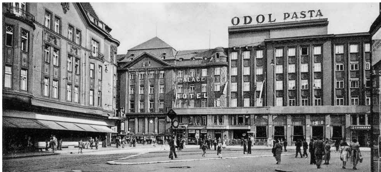
Ruch u hotelu Palace a módního domu Textilia v době po roce 1945

Absolvent oboru Městské stavitelství a inženýrství na Fakultě stavební Vysoké školy báňské – Technické univerzity Ostrava v bakalářském i magisterském stupni studia. Působí jako odborný asistent na Katedře městského inženýrství VŠB-TUO. Ve své profesní praxi se zabývá urbanismem, územním plánováním a regenerací brownfields. Autor několika odborných článků i v zahraničí, řešitel několika vědeckých projektů týkajících se urbanismu.