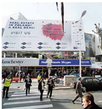
Investiční svět a Cannes patří k sobě

Ostrava se na francouzské Riviéře prezentovala poosmnácté a jako jediné české