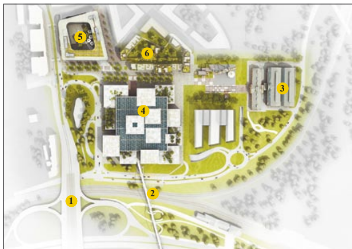
Plán I. etapy výstavby: 1. ulice 28. října, 2. nová lávka, 3. dvojhalí, 4. obchodní centrum, 5. administrativní centrum, 6. bytovky