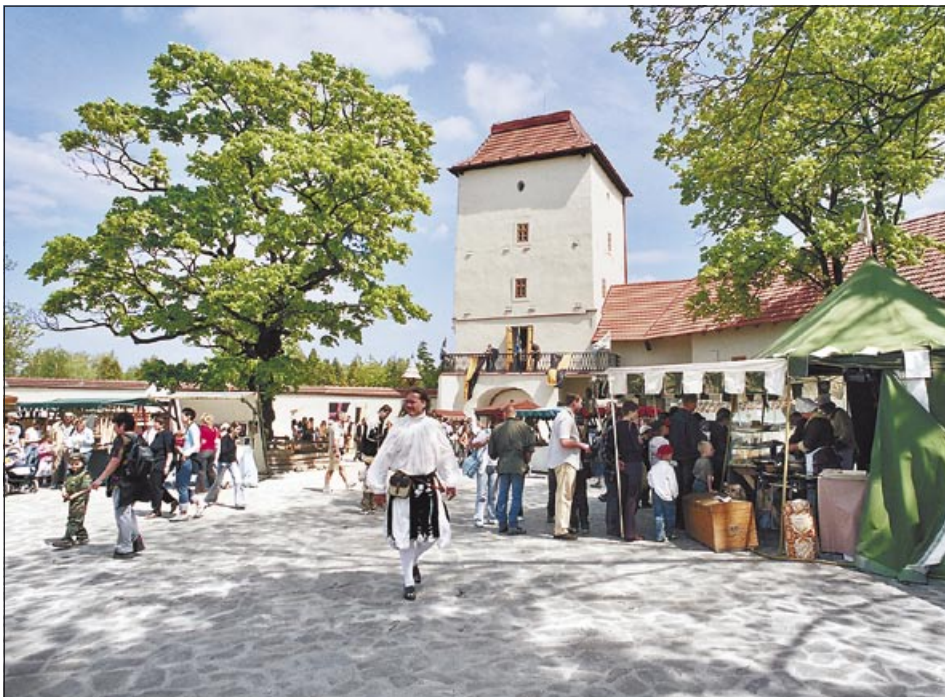
Slezskostravský hrad je vyhledávaným cílem Ostravanů i turistů

Z celého průzkumu vyplývá jednoznačná potřeba a přání zaměřit se na centrum města, které je stále vnímáno jako oblast s vysokým potenciálem pro turistické vyžití obyvatel i návštěvníků i kulturně-společenské aktivity. Uvedené souvislosti korespondují se záměry vedení města a realizovanými projekty - výstavbou Nové Karoliny, rekonstrukcí Českobratrské ulice a dalšími aktivitami. (av)