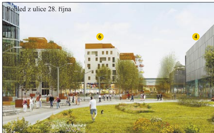
Pohled z ulice 28. října

Ulice by podle jiného návrhu mohly také nést název Lotyšská,