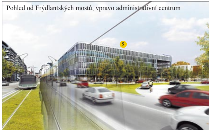
Pohled od Frýdlantských mostů, vpravo administrativní centrum

lou sérií návrhů pojmenování, takže dohromady představuje soubor navrhovaných názvů přibližně patnáct set pojmenování! Klobouk dolů, názvoslovná komise bude mít co dělat. Je však patrné i radostné, že obyvatelé města jeho budoucnost zajímá a chtějí se na ní podílet. Za zaslání návrhů jim patří upřímné poděkování.