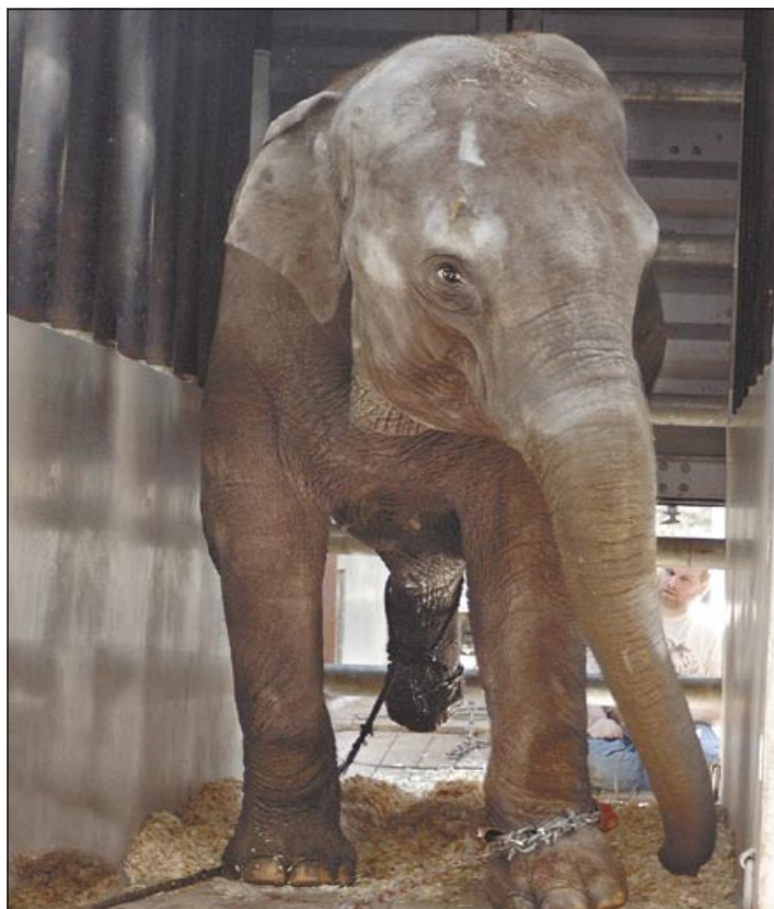
Cestování slonice Vishesh v úzkém kontejneru určitě nebylo příjemné

V ostravské zoologické zahradě vzniká nový informační systém. V areálu byly aktualizovány plány zahrady o tři nové botanické stezky, vyměňují se staré popisky zvířat za nové, objevují se popisky i u některých vybraných druhů