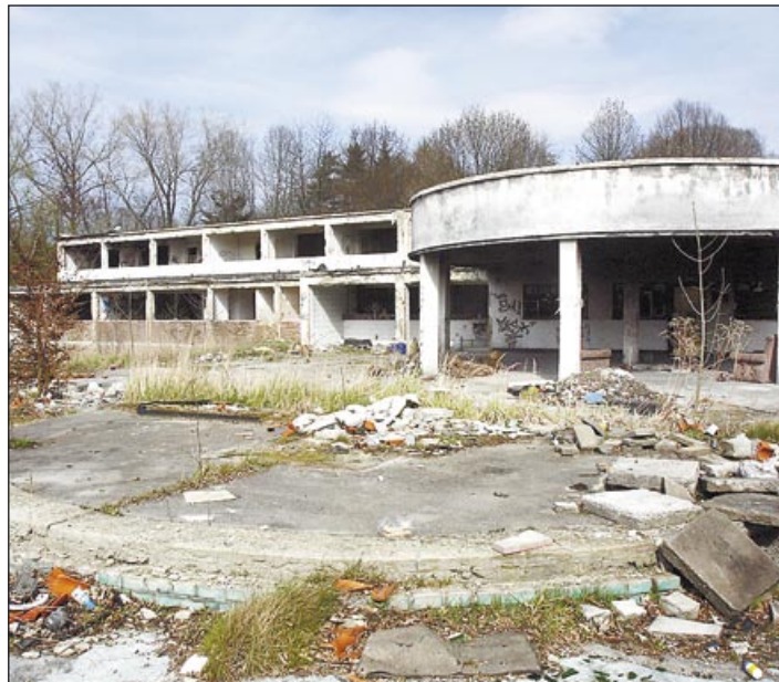
Hulvácké koupaliště mohlo být termálními lázněmi. Škoda. Jak vypadá dnes, ilustrují oba snímky.

jektu v celkovém úhrnu investičního nákladu cca 6 mld. Kč, což je závazek, který, troufám si říct, v České republice nemá obdoby.“ (ok)