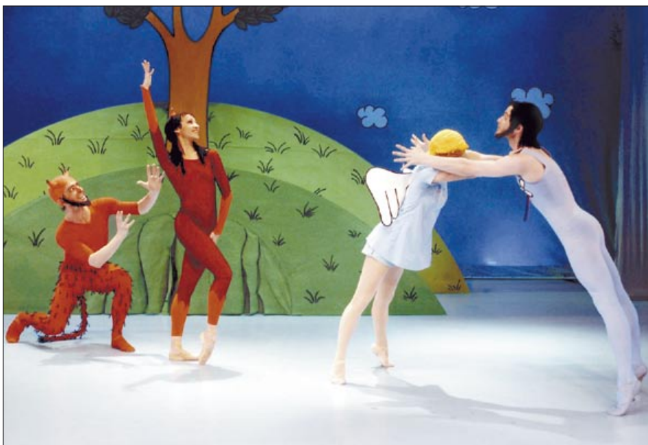
Výprava i kostýmy baletu Stvoření světa nadchla i dospělé diváky

Centrum kultury a vzdělávání, pod které patří ostravské Minikino, ve spolupráci s Koordinační radou seniorů spustilo v březnu projekt Kíno pro seniory. Dvakrát měsíčně tak pořádají v odpoledních hodinách filmová představení pro starší spoluobčany za zvýhodněné vstupné.