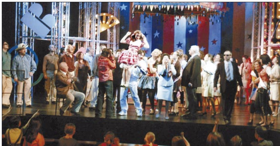
Opera Kolotoč je na repertoáru Divadla Antonína Dvořáka již podruhé