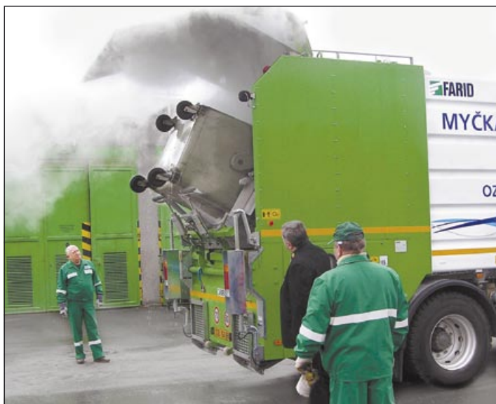
Mytí kontejnerů ocení občané zejména v letních, horkých dnech