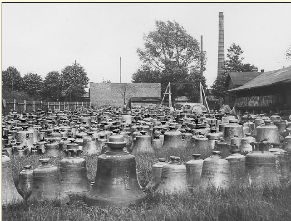
Pro nedostatek surovin zabavovala armáda nejrůznější kovová zařízení a předměty. Na snímku je zachyceno úložiště zrekvírovaných kostelních zvonů v Michálkovicích roku 1916

V letech 1916–1917 sice došlo v souvislosti s vnitropolitickými změnami k uvolnění podmínek v ostravském průmyslu, současně se však celá ekonomika především vlivem nedostatku surovin dostávala do těžké krize. Některá průmyslová odvětví, jako např. koksárenství či ocelářství, dosáhla ještě v roce 1917 svého výrobního maxima, následně však celková produkce začala stagnovat a v posledním roce války došlo v důsledku všeobecné dezorganizace k jejímu prudkému propadu. Válčící velmoci zůstaly na frontách v bezvýhodném klinči, a tak tím, co nakonec rozhodlo o vítězích a porážkách, byl právě zadrhnutý stroj hospodářství. Radoslav Daněk