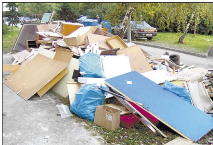
Nevábné zákoutí v ostravských ulicích

Dobrovolné „uklížečky“ naplnily odpadem z lesíku obří kontejner nákladního auta a jen tiše žasli. Mezi nalezenými věcmi byly mimo jiné dětský kočárek, četné pneumatiky, kniha Vzpomínky na J. E. Purkyně, sbírka Ibsenových básní, množství neodmyslitelných plastových láhví, pílka gauče, spacák, střešní krytina, kanystry, dámské kabelky, peněženky, spousty novin, vysavač, stavební odpad... A tak to vypadá ve většině porostů ať chráněných či nechráněných, na územích jakoby „nikoho“, kam do přebujelého náletové a nikdy nekosené zeleně naši čistotní spoluobčané odhazují cokoli. Zkrátka, co Čech, to... Doplňte si sami. (ok)