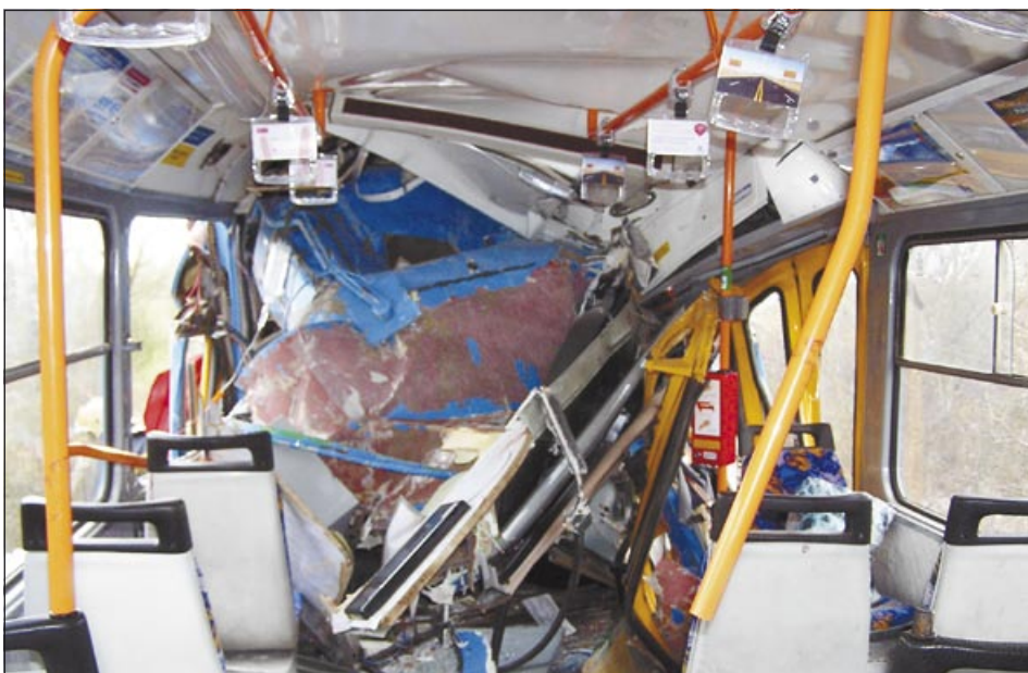
Vnitřek havarované tramvaje dokladuje, v jakém nebezpečí se cestující ocitli

V Ostravě systém dosud fungoval tak, že řidiči protijedoucích tramvají na sebe museli čekat před vjezdem na jednokolejnou trať ve výhybně. Když selhal jízdní řád a některá z tramvají měla zpoždění, měl řidič za povinnost čekající tram-