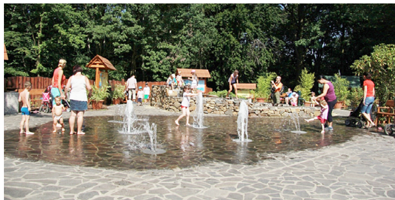
(g) Fontány Vodního světa jsou v horku zejména pro děti příjemnou atrakcí.

Na webu www.zoo-ostava.cz mohou návštěvníci najít celou řadu akcí bohatého programu, 28. srpna bude například v zoo promítání v letním kině.