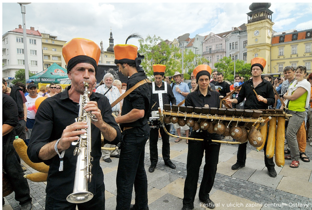
Festivál v ulicích zaplnil centrum Ostravy