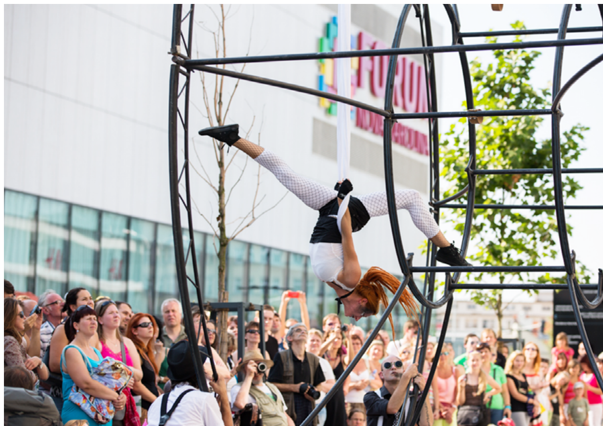
Nedávný festival Colours of Ostrava byl jako vždy doprovázen Festivalem v ulicích v centru, i ten našel nové místo a hlavně zájem diváků na Nové Karolině.

pozemky v území vzrostly na ceně, tedy včetně těch ve vlastnictví města. Pozitivní hodnota je také v nové kvalitní infrastruktuře. Moderní