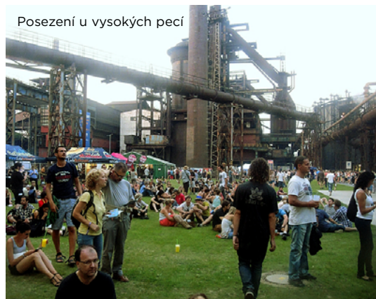
Posezení u vysokých pecí