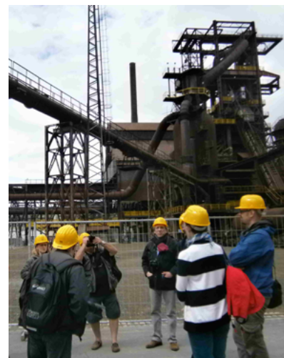
Francouzští hosté při prohlídce Dolních Vítkovic.