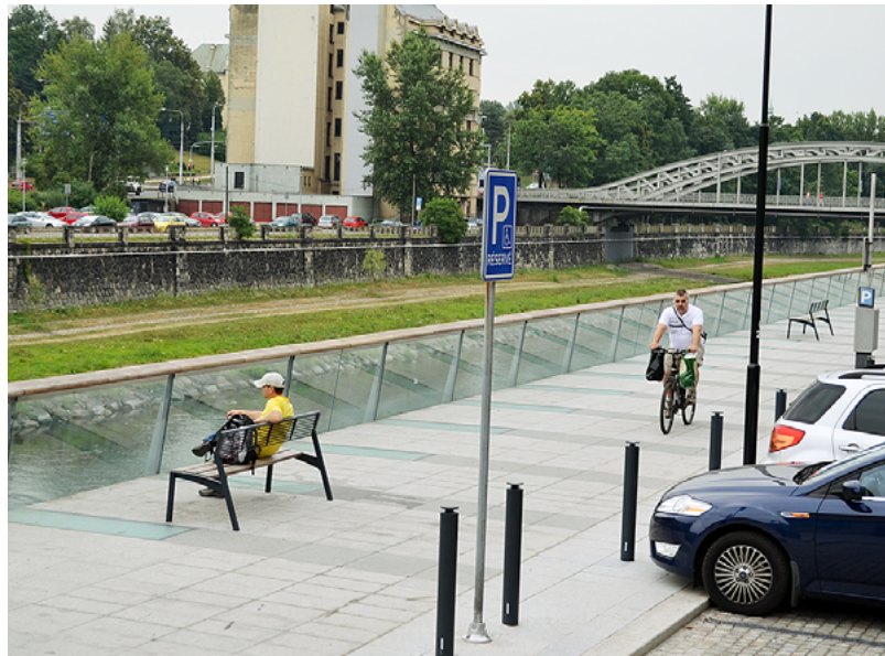
Visuté galerie před budovou krajského soudu na Havlíčkově nábřeží je příspěvkem k oživení okolí řeky Ostravice.

Dvě visuté vyhlídkové galerie ozvláštnily Havlíčkovu nábřeží v centru Ostravy. Stavba zařazená mezi projekty v rámci Integrovaného plánu rozvoje města Ostravy byla realizována za 11 782 tis. Kč s 92,5procentní dotací z evropských fondů. První galerie navazuje na nové parkoviště před budovou krajského soudu, druhá je v ose ulice Matiční. Otevírají nové pohledy na revitalizovanou řeku Ostravicí, Seidlerovo nábřeží a část Slezské Ostravy, díky zabudovaným lavičkám vytvářejí klidovou zónu v blízkosti hlučného centra velkoměsta. Večer je prostor efektně osvětlen reflektory. (vi)