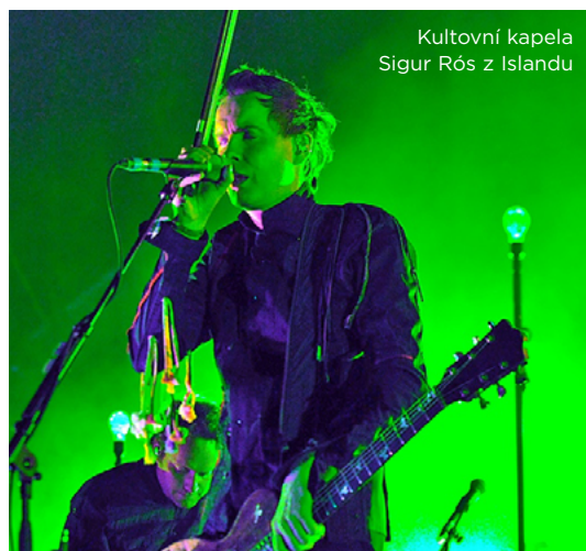
Kulturní kapela Sigur Rós z Islandu