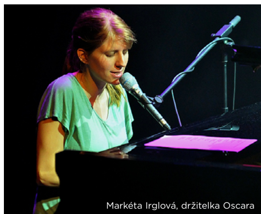
Markéta Irglová, držitelka Oscara