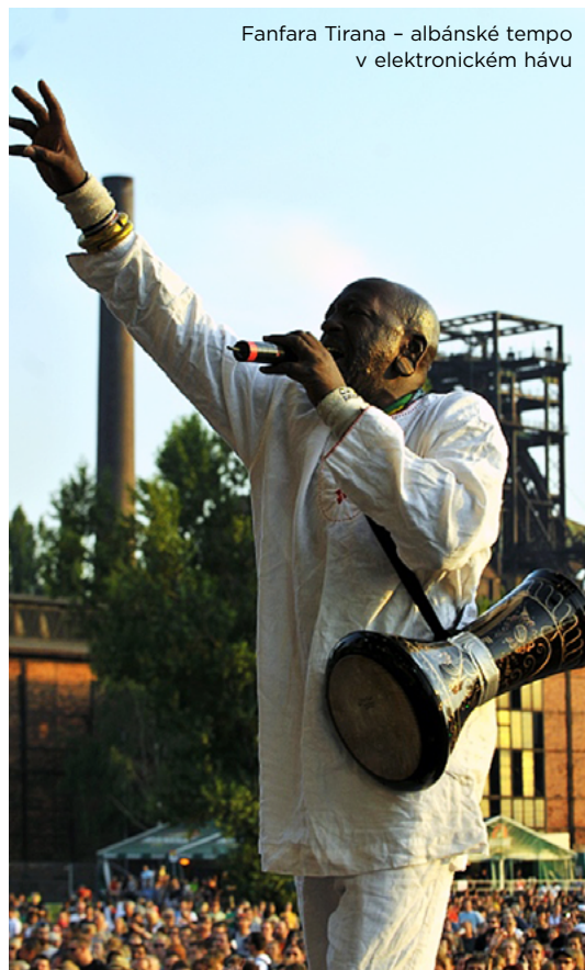
Fanfara Tirana - albánské tempo v elektronickém hávu