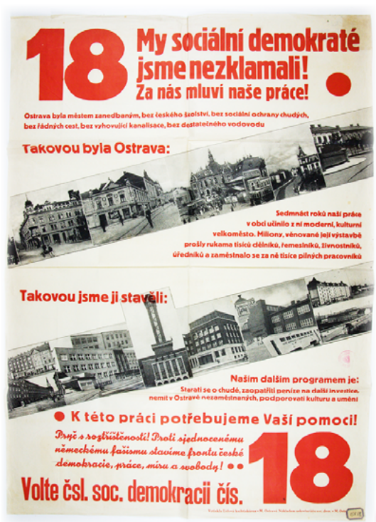
Dny mládeže Jednotného svazu soukromých zaměstnanců (1937).