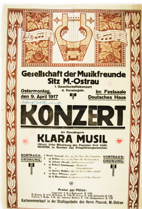
Konzert pro válečné poškozence v Německém domě (1917).