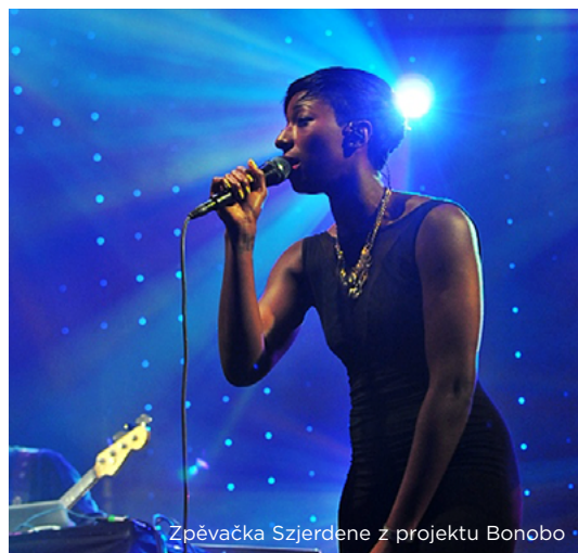
Zpěvačka Szjerdene z projektu Bonobo