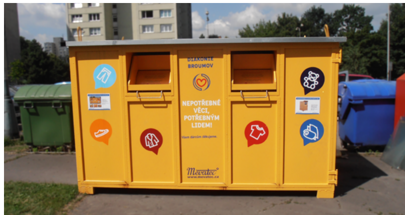
Do žlutých kontejnerů lze umístit šatstvo, příkrývky, ložní prádlo, obuv, tašky, batohy i plyšové hračky.

Bohužel už jsou známy případy, kdy nepovolení lidé vytahují šatstvo z těchto kontejnerů a prodají ho do second handu. Veřejnost by měla podobné případy hlásit policii, protože tento čin je kvalifikován jako krádež městského majetku. Jakýkoli odpad odložený do sběrného kontejneru se stává majetkem města. (g)