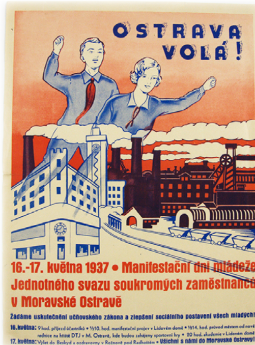
Volební plakát čsl. sociální demokracie (1935)

K předním vydavatelům nepostradatelného veřejného informačního zdroje patřily známé ostravské tiskárny například Julius Kittl,