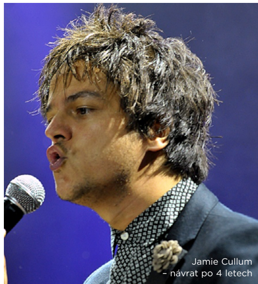
Jamie Cullum - návrat po 4 letech