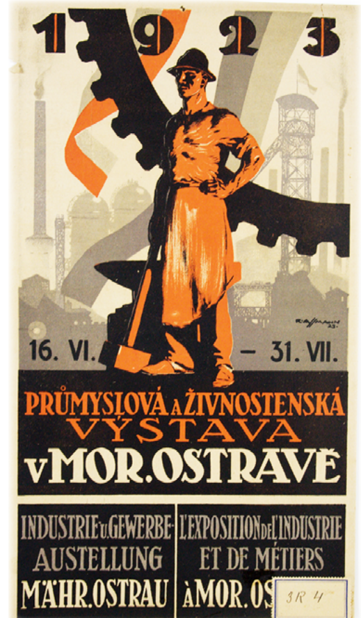
Průmyslová a živnostenská výstava v Moravské Ostravě (1923).

Ke graficky velmi zdařilým plakátům ostravské sbírky se řadí plakát zvoucí na Průmyslovou a živnostenskou výstavu do Moravské Ostravy z roku 1923. Předvolební plakát československé sociálně demokratické strany z roku 1935, který s použitím fotografií srovnává podobu staré a nové Ostravy, upozorňuje na zásluhy strany při její přeměně v moderní a prosperující velkoměsto.