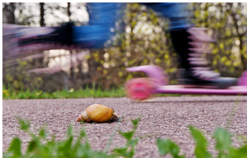
Vítězná fotografie z minulého ročníku soutěže pod názvem Rychlost.

Aktiv BESIP, pracovní skupina při odboru dopravy Magistrátu města Ostravy, vyhlásila 2. ročník prázdninové fotografické soutěže Bezpečně po cyklistické Ostravě s mottem „Zážitek z projížďky na kole po Ostravě a okolí.“