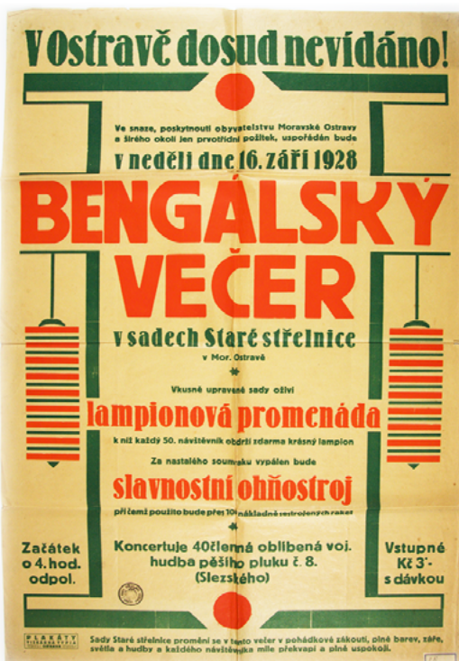
Bengálský večer v sadech Staré střešnice (1928)