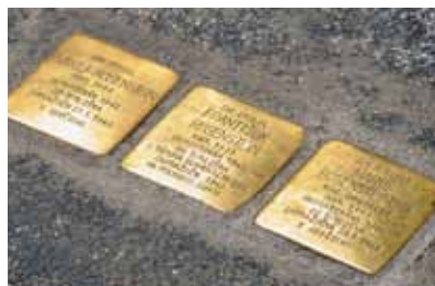
Mosazné destičky v ulicích Ostravy připomínají oběti holocaustu.

Na počátku června se v ostravských ulicích objevily malé destičky, tzv. stolpersteine, které připomínají místa, kde před válkou bydlely oběti holocaustu. Destičky nechali