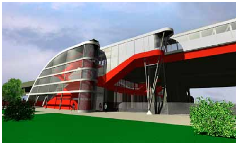
Vizualizace budoucí podoby svinovských mostů napovídá, jak moderně bude lokalita řešena.

Zásadní proměna tak velkého a rušného prostoru znamená pro občany určitá rizika. Pohyb v okolí svinovských mostů vyžaduje od nich obezřetnost, je nutné, aby cestující respektovali vymezené komunikační prostory vymezené pro chodce ve staveništi. Podrobnější informace o projektu naleznete na www.ostrava.cz .