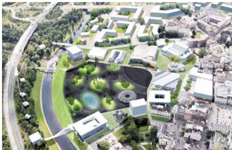
Vizualizace vítězného návrhu nové podoby výstaviště Černá louka, jak ji navrhli architekti kanceláře Maxwan.

V každé ze tří jmenovaných lokalit však už realizace započala. Divadlo loutek Ostrava, které je součástí Klastru Černá louka, zahájilo v červnu práce na moderní přístavbě. Na Nové Karolině rychlým tempem vzniká obchodně-zábavní centrum. Památkově chráněný vítkovický industriál nabízí nový kulturní prostor v bývalém Dole Hlubina, začíná přeměna objektu plynojemu na konferenční a kulturní centrum, součástí lokality je i zdařile rekonstruovaný bývalý Rothschildův zámeček, který už druhým rokem slouží koncertům a dalším společenským akcím. (h, k)