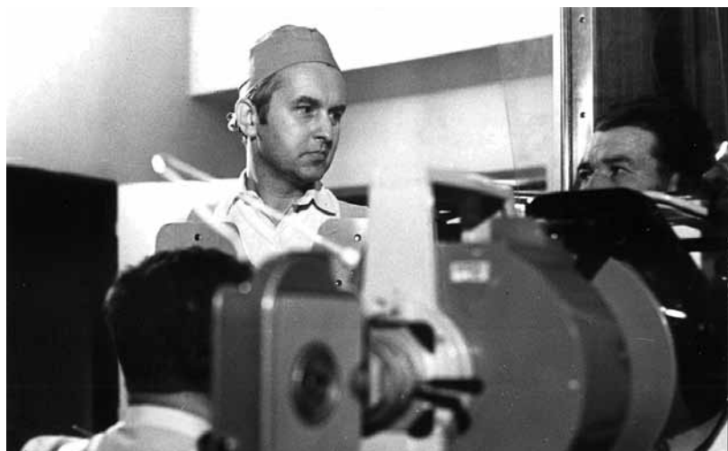
Snímek z Výzkumného ústavu pracovního lékařství z roku 1969