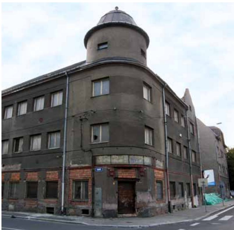
Stará budova na křižovatce ulic 1. máje a Pohraniční se zanedlouho promění v moderní centrum.