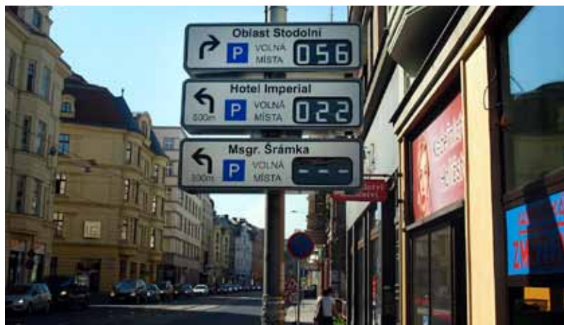
Navigační tabule navádějí v centru Ostravy řidiče na parkoviště

Ve výhledu jsou další projekty rozvoje tohoto systému v Ostravě, které budou řešit například rozmístění desítek detektorů pro měření v dopravě, vytváření zátěžových map, optimalizaci