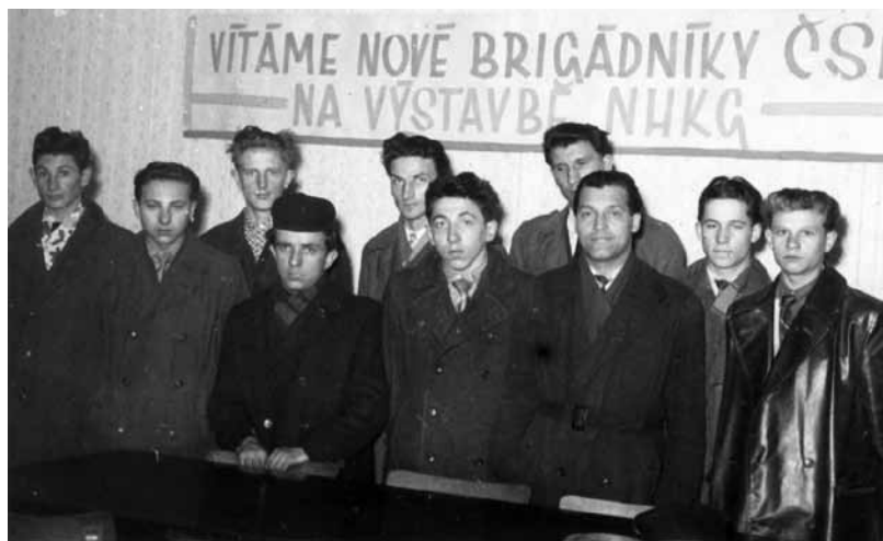
„Naděšení“ noví brigádníci na stavbě NHKG