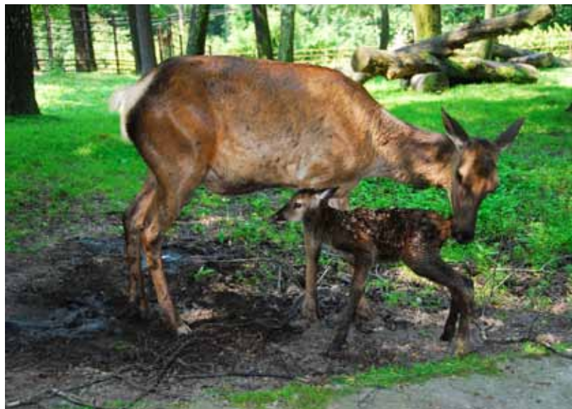
Mládě jelena sibiřského se má čile k světu