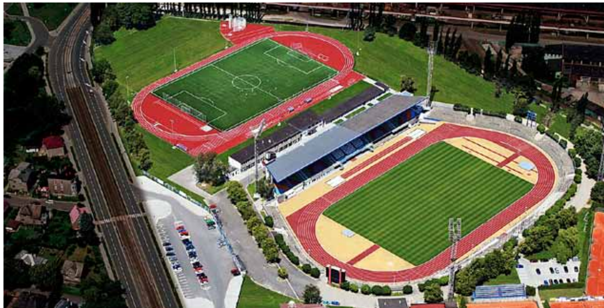
Rekonstrukce se dotkne hlavně dnešních ochozů na stání

Výstavba nového fotbalového stadionu v Ostravě zůstává v dlouhodobějším výhledu. Město o ní stále jedná, hledá nejvýhodnější lokalitu z hlediska majetkových vztahů a dopravní dostupnosti. Kromě varianty ve Svinově se momentálně vyhodnocují některé nabídky soukromých investorů, např. na bývalé průmyslové plochy. Zvažují se způsoby financování, včetně státních dotací, město samotné bez externích zdrojů nemůže stavbu v hodnotě téměř 1,5 mld. korun v současné ekonomické situaci realizovat.