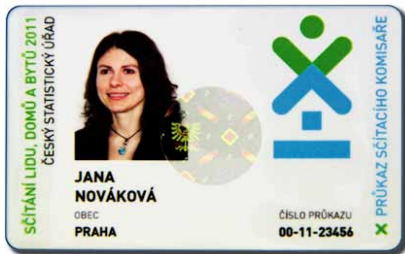
Vzor průkazu sčítacího komisaře

na bezplatnou linku 800 87 97 02, kde je možné termín druhé návštěvy změnit podle vás. Pokud by vás komisař nezastihl ani podruhé,