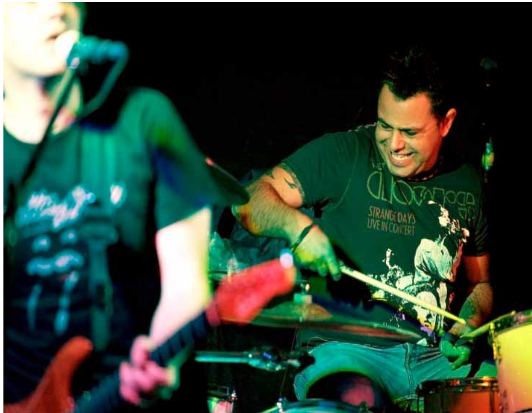
Ilustrační foto z loňského ročníku festivalu

Velký koncert se odehraje v Bonver Aréně 26. března od 18.30 hodin, vstup na akci je zdarma. Další podrobnosti jsou k dispozici na webových stránkách www.irishculturalfestival.com . (p)