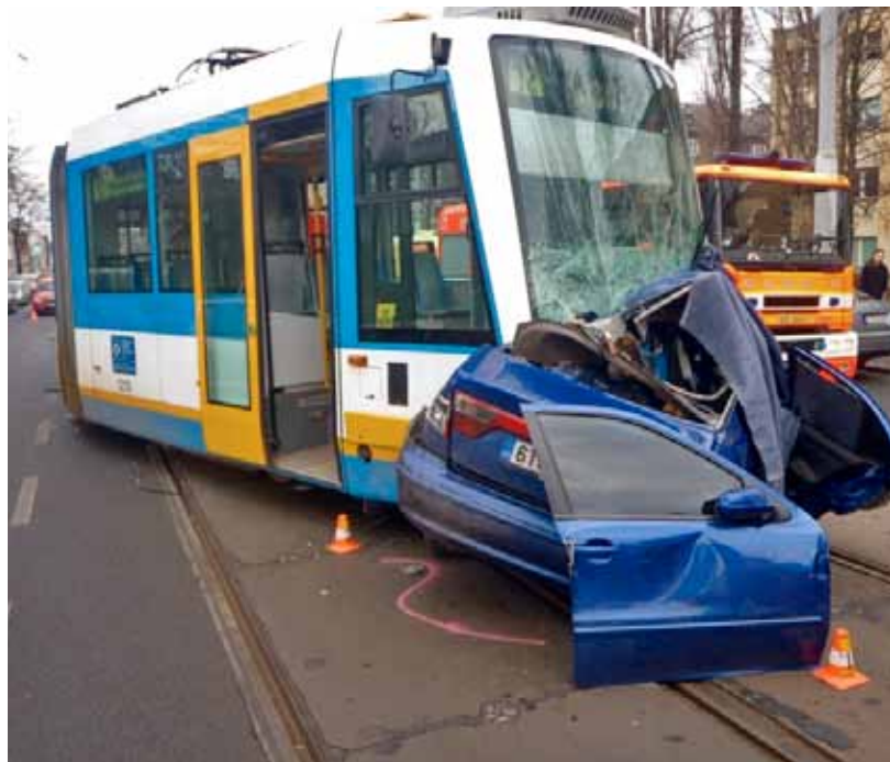
Zejména mladí řidiči existenci tramvají ve městě jaksi nevnímají. A takhle to končí... Ilustrační foto