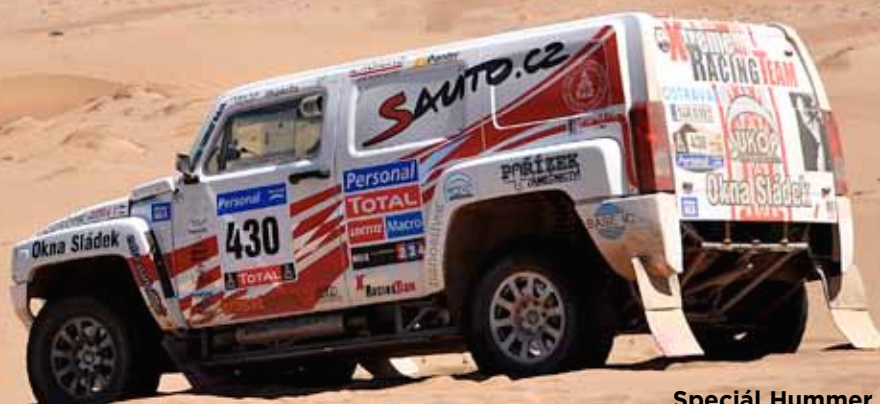
Speciál Hummer H3 EVO s posádkou Sládek-Janáček na trati závodu