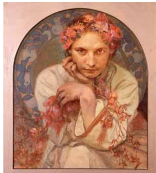
(g) Alfons Mucha – Dívka v květech