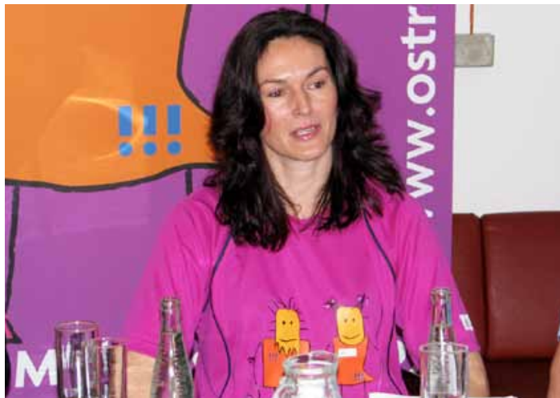
Tváří ME atletů do 23 let v Ostravě bude slavná trojskokanka Šárka Kašpárková.