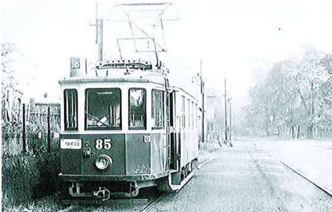
Motorový vůz „Komárek“ na konečné linky č. 8 v Zábřehu-Pískových dolech

Pojďte s Ostravským informačním servisem vystoupat na haldy Emu, která skýtá nádherný výhled na celé město. Můžete z ní vyhlížet příchod jara. Čtyři komentované prohlídky se budou konat 20. března v 10, 11, 14 a 15 hodin. Doporučujeme si vzít pevnou obuv. Sraz je před budovou Nové radnice.