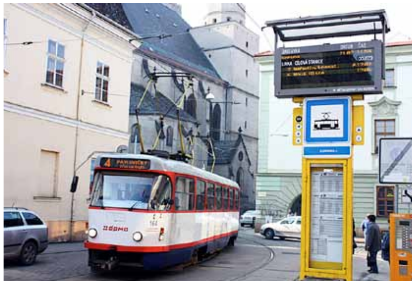
Inteligentní zastávky mají už v Olomouci – na displeji se potřebné informace stále aktualizují.

individuální přepravy,“ řekl náměstek primátora pro dopravu Aleš Boháč. (vk)