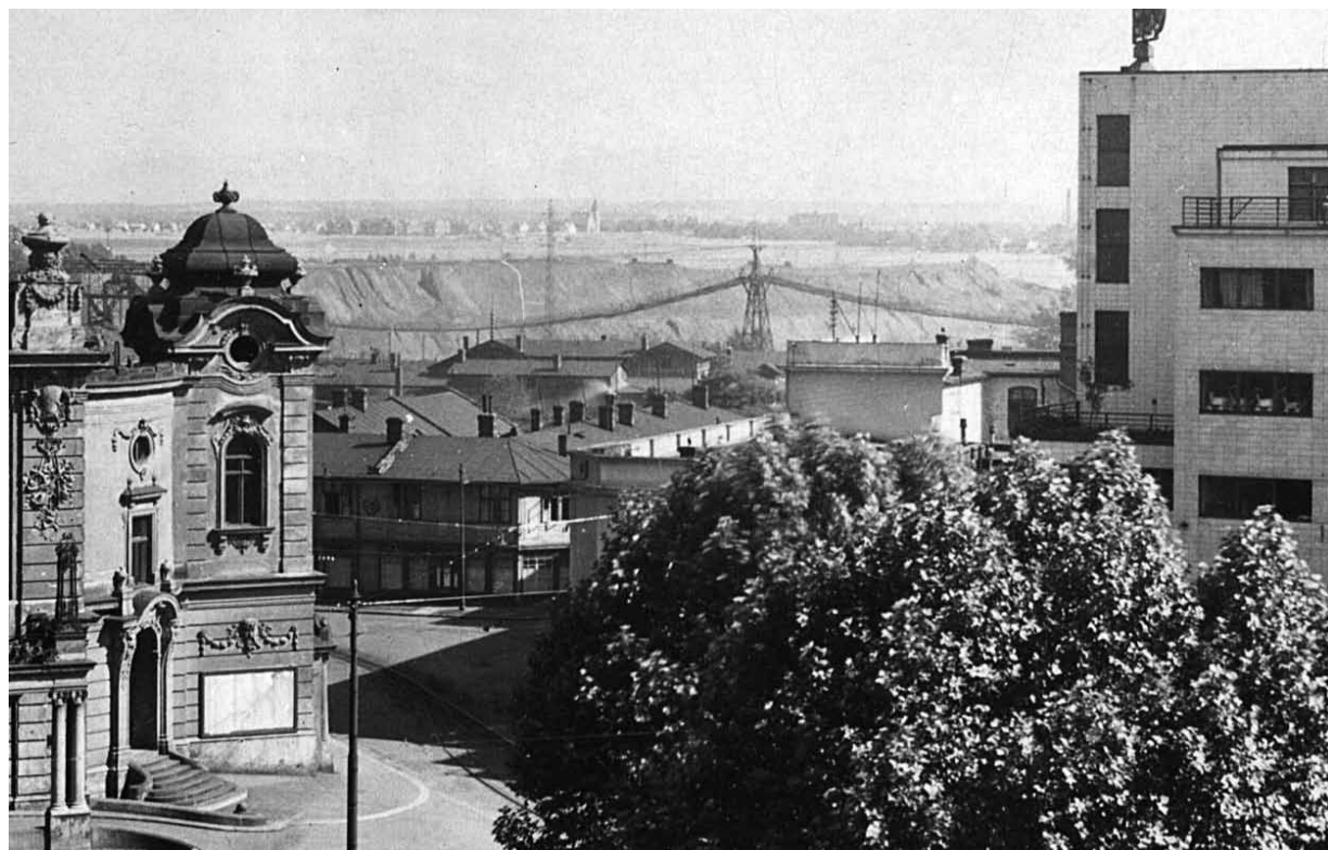
Pohled na budovu Court of Industry (uprostřed). Vlevo je průčelí městského divadla, naproti roh obchodního domu Brouk a Babka.