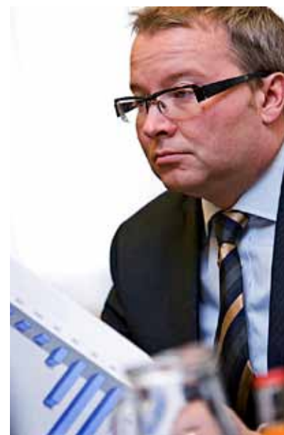
Ministr Tomáš Chalupa

ArcelorMittal (AMO) podepsal dobrovolnou dohodu mezi MŽP a hutní společností směřující k omezení zatížení životního prostředí. AMO se mj. zavazuje dokončit instalaci látkových filtrů na spékacích pásech Aglomerace Sever s cílem snížit emise prachu do 30. 11. 2011, na zbývajících provozech do konce roku 2012. Už dříve pořídila zamestnání v hodnotě 4,87 mil. korun, který darovala TS Slezská Ostrava. V tomto obvodu i v městské části Radvanice a Bartovice přispívá na jeho provoz. ArcelorMittal začne od letošního roku posílat ročně 5 milionů korun do fondu pro ozdravné pobyty dětí z nejvíce znečištěných oblastí Ostravy. (vi)