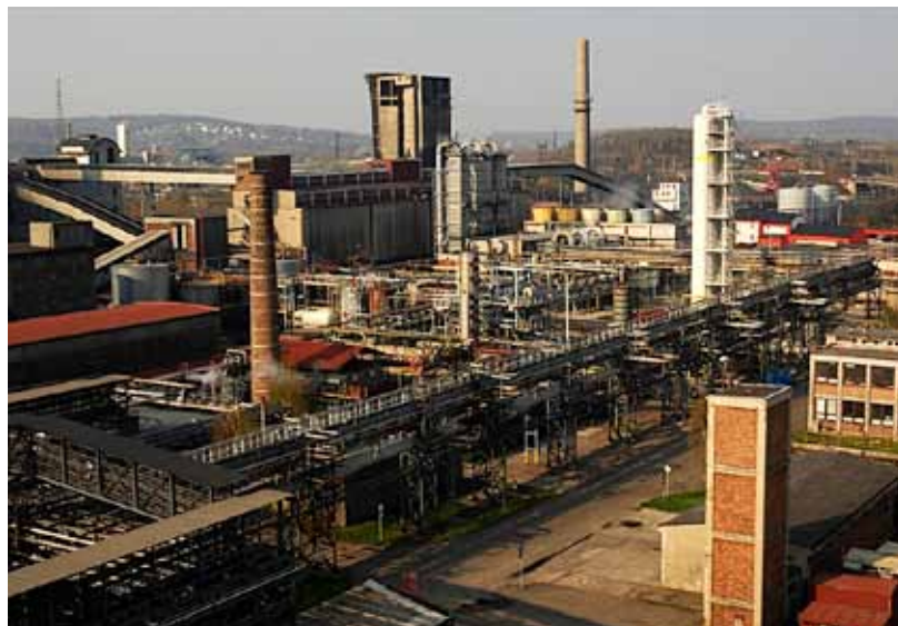
Už dnes je tento snímek Koksovný Jan Šverma historický. Za pár let má být všechno jinak...

zařízení, které se dá ještě využít. Budoucnost by měla přinést demontáž všech technologických zařízení a také sanaci území. Ministerstvo životního prostředí už obdrželo žádost o řešení starých ekologických zátěží, pro tuto tzv. ekozakázku bude vybrána firma. Dekontaminace území po koksárenském provozu není jednoduchá, díky velkému množství vedlejších chemických produktů je půda kontaminovaná do hloubky několika metrů. Jen odstranění stejných škodlivých zátěží na území bývalé Karoliny stálo přes 2 miliardy korun. Po sanaci území by na místě bývalé koksovný Šverma mohla vzniknout lokalita určená pro lehký průmysl. (ok)