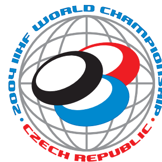
Ve čtvrtek 1. dubna navštívilo halu na 18 tisíc lidí. Nejvíce je to táhlo do šaten hokejistů.