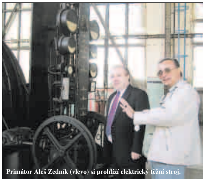
Primátor Aleš Zedník (vlevo) si prohlíží elektrický těžní stroj.

KRASLICE VE FOYERU. Kraslice z vyfouknutých vajíček, papíru, textilu a dalších materiálů zdobí foyer a vyhlídkovou věž Radnice města Ostravy. Návštěvníci mohou v informačním centru ve věži radnice dát do 13. dubna svůj hlas kraslici, která se jim nejvíce líbí. Vyhodnocení soutěže bude 19. dubna.