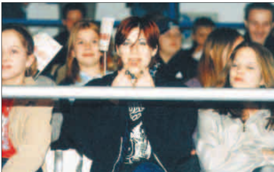
Populární Věra Špinarová roztleskala a roztančila tribuny. Diváci se na Dni otevřených dveří dobře bavili.