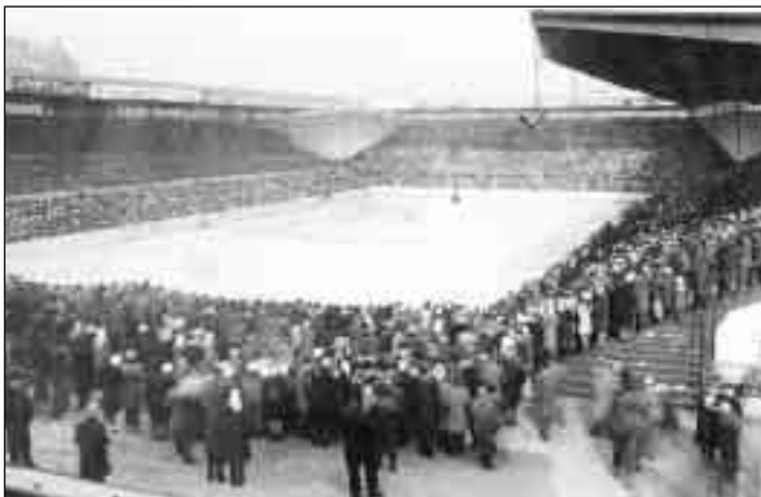
Zimní stadion Josefa Kotase v době, kdy Vítkovice získaly první titul mistra republiky. V roce 1955 byl zastřešen a Ostrava měla jako první město v republice hokejovou halu s úctyhodnou kapacitou 18 000 míst ke stání.