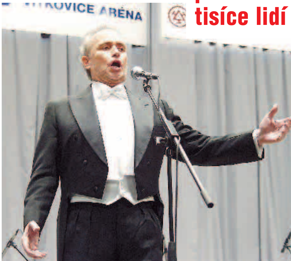
Barcelonský slavík J. Carreras sklídil ovace. Svými výkony nadšené publikum zvedal ze sedadel.