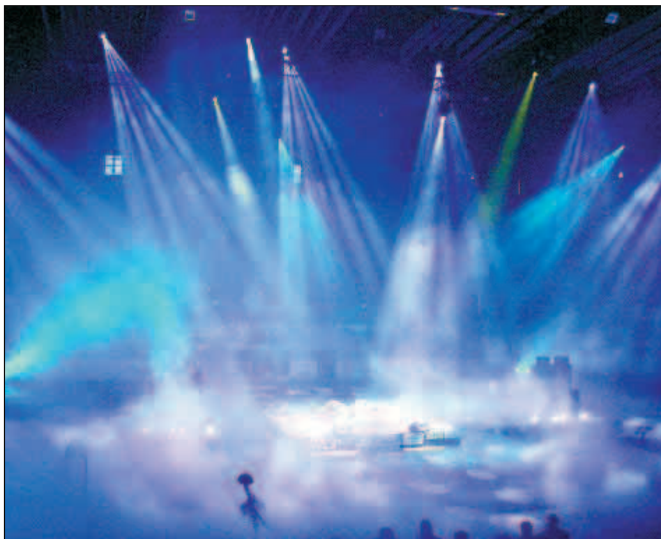
Akci Zkoušíme na Carrerase aneb ČEZ Aréna jede obohatila nevídaná laserová show.