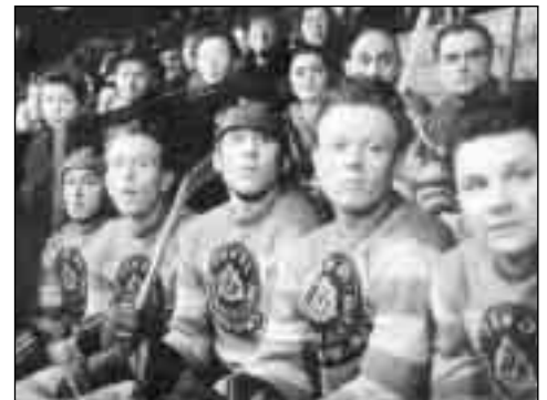
Okamžik soustředění na střídačce.

vitě mohutným pokřikem: Bij! Jediným zaváháním byla prohra s ATK Praha, který měl ve svých řadách deset reprezentantů. Dramatické rozuzlení přinesl poslední hráči