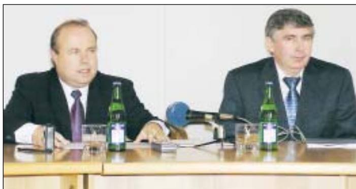
Primátor A. Zedník a náměstek J. Chalupa na tiskové besedě bezprostředně po hlasování o vydání obligací.