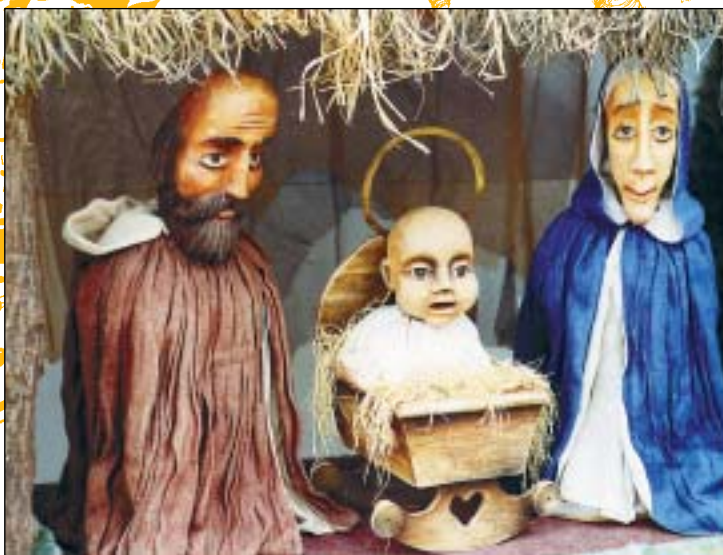
Půjdem spolu do Betléma, 1990