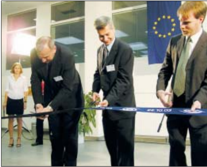
Slavnostní přestřižení pásky se konalo za účasti téměř dvou stovek zástupců kraje, města, Evropské unie, vysokých škol a firem z celého regionu.

M ultifunkční budova Vědecko-technologického parku (VTP) v Ostravě-Pustkovicích byla slavnostně otevřena 20. října po dvanácti měsících od zahájení stavby. Celkové náklady na vybudování tohoto centra parku dosáhly přibližně 117 milionů korun, přičemž Evropská unie dotovala projekt 47,5 milionu korun.