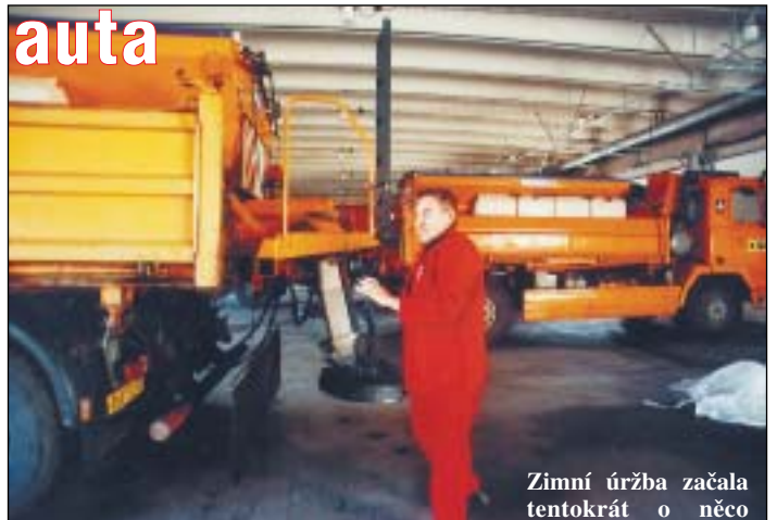
Zimní údržba začala tentokrát o něco dříve. Cestáři vyrazili na silnice už poslední týden v říjnu.