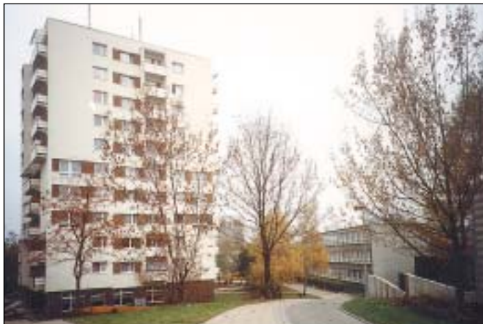
Bydlení v sídlišti Fifejdy I. se stává příjemnějším a kvalitnějším.

„Ostrava má skutečně specifické postavení v rámci ostatních statutárních měst. Je třeba si uvědomit, že městské obvody, jakými jsou Polanka nad Odrou, Krásné Pole, Třebovice, Radvanice a Bartovice, částečně například i Michálkovice nebo Svinov, mají hlavně podobu takzvaného ven-