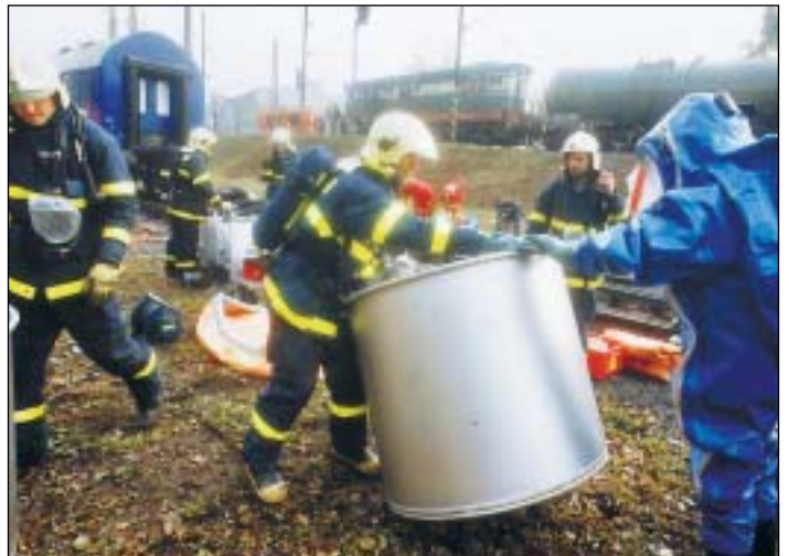
CVIČENÍ ZÁCHRANÁŘŮ. Likvidaci následků dopravní nehody, při níž unikly nebezpečné chemické látky, nacvičovali záchranáři 17. října v Mariánských Horách. Taktického cvičení složek Integrovaného záchranného systému města Ostravy se zúčastnili profesionální hasiči, dobrovolní hasiči z Nové Vsi a Radvanic, záchranná zdravotnická služba, městská policie, dopravní služba Policie ČR, havarijní komise Českých drah, vodo-hospodářské orgány státní správy a další. Záchranáři nasimulovali situaci, kdy se na železničním přejezdu srazil nákladní automobil s železniční cisternou a z obou vozidel unikly nebezpečné látky.