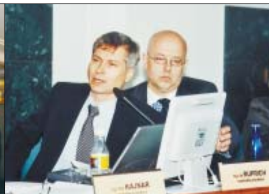
Do téměř tříhodinové diskuze, v níž zazněla argumentace pro i proti vydání obligací, se aktivně zapojili členové zastupitelstva i obyvatelé města.