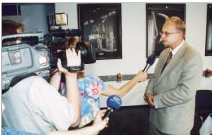
Dobrou zprávu týkající se olejových lagun přijel do Ostravy 12. června sdělit přímo ministr životního prostředí Libor Ambrozek.

Likvidaci čtyř nádrží s více než 350 000 m 3 nebezpečných odpadů po bývalém podniku Ostramo už od roku 1996 připravuje Diamo, s.p. Jako podklad pro realizaci sanačních prací byla vypracována analýza rizik, podrobný průzkum obsahu lagun a jeho další využitelnosti a studie proveditelnosti sanačního zásahu. Česká inspekce životního prostředí (ČIŽP) v roce 2001 vydala rozhodnutí specifikující postupy a podmínky odstraňování této ekologické zátěže. Vyhlášení výběrového řízení na samotnou sanaci lagun