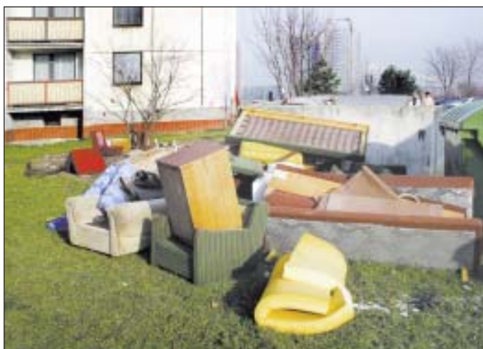
I takto někdy, bohužel, vyhlížíje prostranství před obytnými domy.

Systém nakládání s komunálním odpadem pro občany města Ostravy zajišťuje statutární město Ostrava prostřednictvím společnosti OZO Ostrava s.r.o. ( www.ozoostrava.cz , 800 159 238).