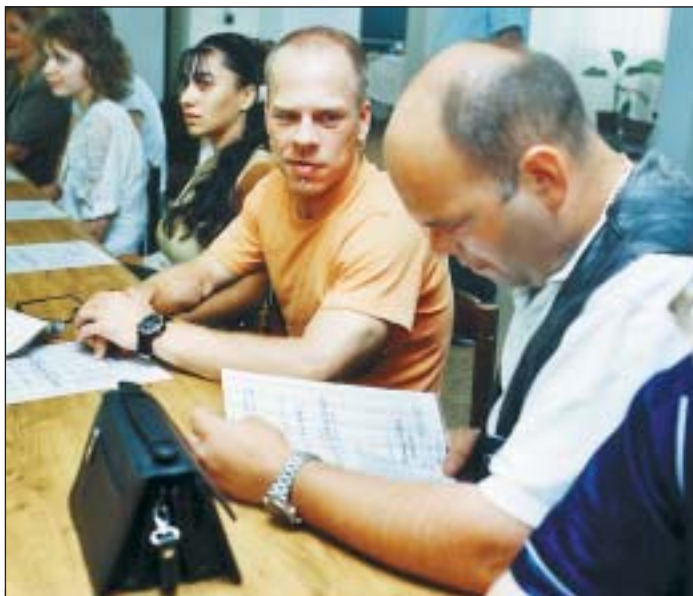
Slavnostní vyřazení absolventů kurzu Praktikum pro život.

firmy samozřejmě dát práci zdravotně postiženým lidem, že by to měla být věc jejich cti,“ říká pan Mirek, mladý muž, jeden z absolventů předchozích kurzů. Vedení Střediska pracovní rehabilitace totiž umožňuje i lidem, kteří kurz skončili, pokračovat v docházce, setkávat se, věnovat se oblíbeným činnostem. Dnes je jich už celkem pětatřicet a nechyběli ani na slav-