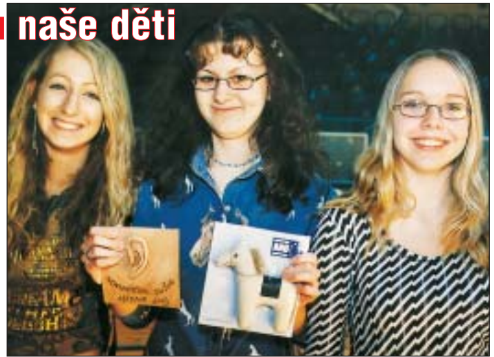
Úspěšné mladé redaktorky Novinářského ouška.

Jednoho dne se ale objevila neznámá bakterie. Onemocnělo mnoho koček a klasické léky nezabíraly. Epidemie už zachvátila celou Evropu. Vědci přátelských koček se spojili a hledali nový lék. Hrdé kočky nic takového neudělaly.