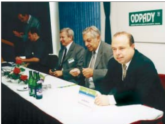
ODPADY 21. Hotel Atom od 21. do 23. května hostil 3. ročník mezinárodní konference Odpady 21 s podtitulem Odpadové hospodářství středoevropských zemí v období přípravy jejich vstupu do Evropské unie. Hlavní organizátoři, Sdružení pro rozvoj Moravskoslezského kraje a FITE, Ostrava, a. s., v rámci doprovodného programu uspořádali také seminář s odborníky na odpadové hospodářství čtyř partnerských měst: Ostravy, Miškolce, Košic a Katowic.