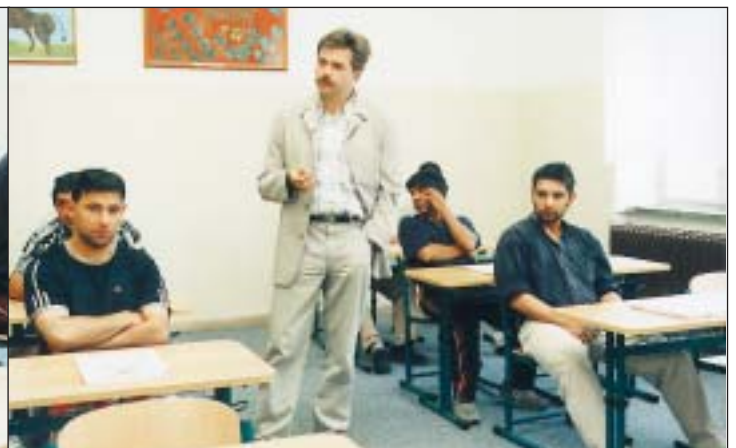
Účastníci kurzu zednické práce získávají i základní informace například o tom, na co si dát pozor při uzavírání pracovní smlouvy. Po teoretické části v učebně absolvují základní praxi na cvičném pracovišti a poté na stavbách zajišťovaných romskými firmami.