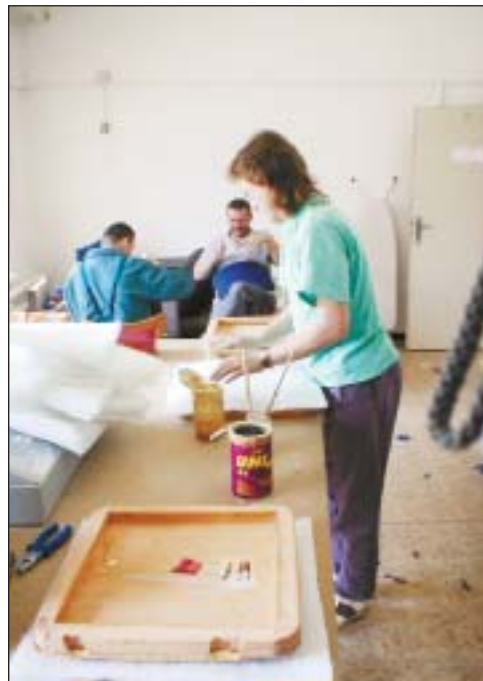
Pohled do čalounické dílny v Centru pracovní rehabilitace v Ostravě-Třebovicích, které provozuje Střední odborné učiliště stavební a dřevozpracující v Ostravě-Zábřehu. Právě v tomto centru si nezaměstnaní lidé ověřují svou řemeslnou zdatnost.

chota mladých lidí učit se, ale i omezenost jejich rodičů, kteří je v tom ještě v mnoha případech podporují. (SB)