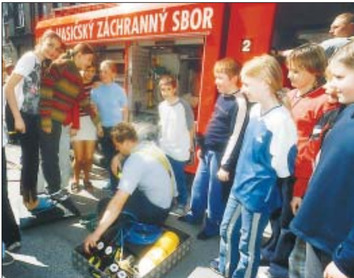
DNY OTEVŘENÝCH DVEŘÍ. Hasičský záchranný sbor Moravskoslezského kraje pořádal 2. a 3. května Dny otevřených dveří na stanicích v celém regionu včetně čtyř ostravských. Návštěvníci si ze zájmem prohlédli techniku a vybavení, které hasiči používají při své každodenní práci.