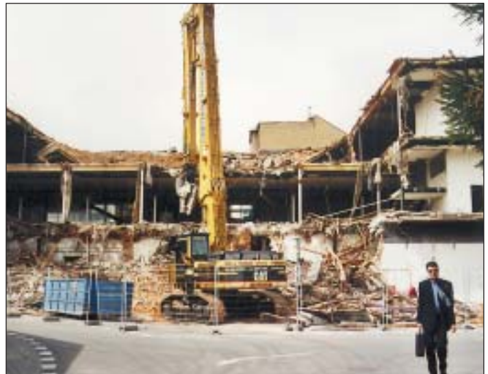
OBCHODNÍ DŮM BYL ZBOURÁN. Koncem dubna byla zahájena na Černé louce demolice obchodního domu Kramer.

České společnosti, které spolupracují s firmami ve Spojených státech amerických, mohou na internetových stránkách www.ecolinks.org najít informace, za jakých podmínek lze získat cestovní grant. (m)