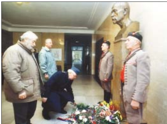
ČESTNÁ STRÁŽ U BUSTY PREZIDENTA. Slavnostní vzpomínkový akt u příležitosti 153. výročí narození filozofa, sociologa, politika a prvního československého prezidenta Tomáše Garrigua Masaryka se konal 7. března ve foyeru Nové radnice. Kytice u jeho busty při této příležitosti položili představitelé statutárního města Ostravy, zástupci politických stran a dalších organizací a sdružení.