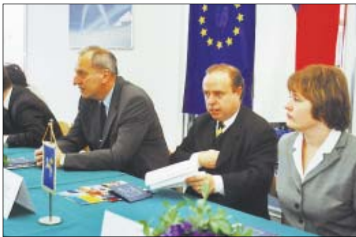
Oficiální prezentace mošnovské průmyslové zóny se zúčastnili rovněž hejtmán Evžen Tošenovský a primátor Aleš Zedník.

Po dokončení bude v průmyslové zóně k dispozici šest tisíc metrů čtverečních administrativních, výrobních a skladových ploch, které budou využívat zejména malé a střední firmy. Společnost pro využití letiště Mošnov už dnes registruje tři desítky žádostí o pronájem prostorů. V současné době v dokončené části průmyslové zóny za 47 milionů korun podniká 45 firem s 270 zaměstnanci.