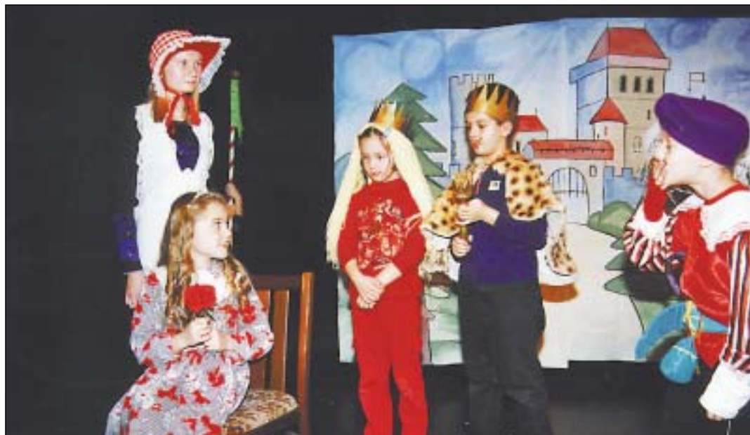
DĚTI V HLAVNÍ ROLI. Komorní scénu Aréna koncem listopadu zaplnili účastníci přehlídky dětské tvorby Arénka. Do devátého ročníku se přihlásilo patnáct souborů z městských i mimoostravských škol a institucí.

„Zdejší pedagogové jsou nároční, ale jejich požadavkům odpovídají výsledky žáků. Během loňského roku uspořádali šestačtyřicet besídek, osm hudebních podvečerů, patnáct žákovských koncertů, čtyřia dvacet mimořádných koncertních vystoupení, děti hrály v zahraničí i se studenty Janáčkovy konzervatoře. Za více než pětáctýřicet let existence škola vychovala řadu vynikajících umělců, kteří našli uplatnění