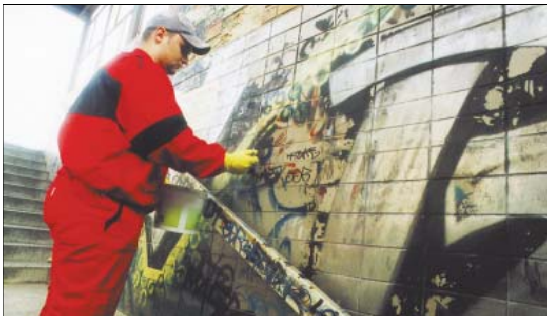
I takto „vyzdobené“ plochy lze uvést do původního stavu pomocí speciálních přípravků velmi rychle.

V září bylo provedeno rozsáhlé čištění v obvodu Ostrava-Jih a v Moravská Ostrava a Přívoz. Například náklady spojené s očištěním