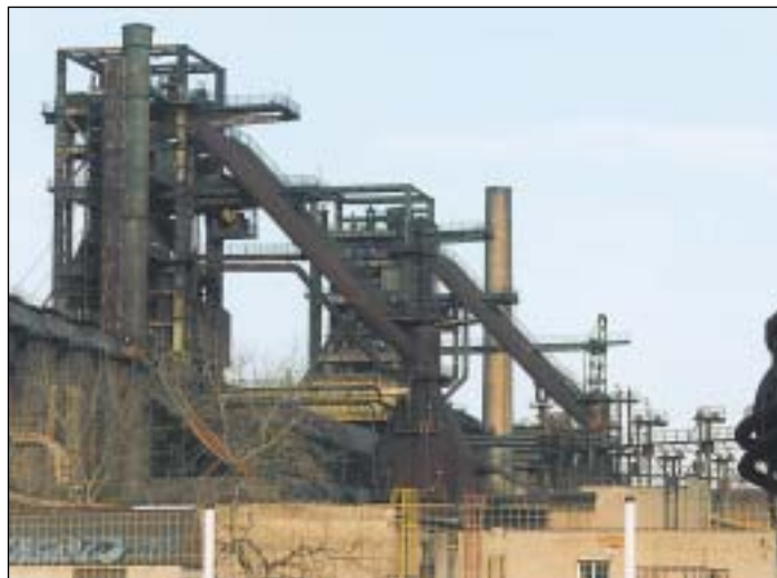
Tato část Dolní oblasti byla letos vyhlášena národní kulturní památkou technického charakteru.

Dolní oblast Vítkovic není zdaleka jediným rozvojovým prostorem, což je silným argumentem a dalším důvodem pro investiční uměřenost. „Projekt nemůže vysávat akce, které je rozumnější i ekonomičtější lokalizovat do jiných částí města. Bylo by prima, kdyby se nám podařilo aktivity spojené s volným časem přenést také za řeku Ostravicí do areálu slezsko-ostrovského hradu. Černá louka si už našla svůj jasný výraz, který je charakterizován výstavnickou činností a hlavně snahou o zapojení do života centra. Okolí hradu na své využití teprve čeká. Je nereálné očekávat příchod jednoho investora, který tu za rok postaví obdobu vídeňského Prátru. Budeme spokojeni, když se nám podaří po dohodě s vlastníky pozemků připravit majetkové, dopravní a další podmínky tak, abychom sem postupně přivedli privátní aktivity,“ uvádí náměstek primátora. Myslí si, že podobný model by bylo rozumné uplatnit také v prostoru kolem Staré radnice, kde si pamětníci jistě vzpomínají na známé lauby. „Opusťme představu zástavby tohoto místa jediným obrovským administrativně-spoločenským objektem. Připravme předpoklady pro realizaci rozvolněné výstavby, opět z privátních prostředků, a citlivě navazující na původní zástavbu včetně již zmínovaného podloubí,“ navrhuje Ivan Knižátko. (Maj)