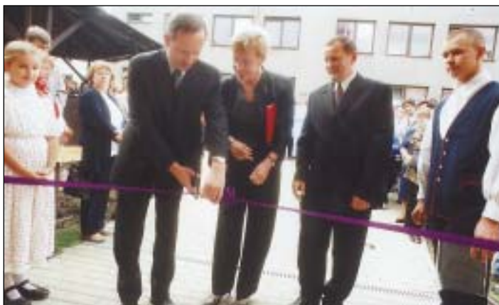
NOVÁ TĚLOCVIČNA. Slavnostním přestřižením pásky se otevřely dveře nové moderní tělocvičny všem školákům ze ZŠ v Bílovecké ulici ve Svinově. Investorem akce za 21 mil. Kč bylo město Ostrava, zhotovitelem, který dokončil objekt za pouhých deset měsíců, SV UNIPS, s. r. o.

„Bolavým místem regulace zůstává absence záchytných parkovišť. Tuto funkci v současné době plní jen parkovací objekt akciové společnosti Garáže Ostrava na Černé louce. Problémem je také parkování servisních organizací a opravárenských firem v případě havarijních situací. V návaznosti na platnou legislativu žádné výjimky z nařízení města neexistují, proto tyto případy městská policie zohledňuje a řeší individuálně. Naopak velmi pozitivně hodnotí nový způsob parkování lidí, kteří zde trvale bydlí. Výrazně se zlepšila průjezdnost ulic i zásobovací možnosti - tedy dostupnost vozidel k prodejnám,“ říká L. Stuchlík. Zároveň uvádí, že už dnes je připravována druhá etapa regulace parkování motorových vozidel. V ní půjde o rozšíření nového parkovacího systému do dalších částí města. Počítá se s vybudováním záchytných parkovišť na okraji centra s návazností na městskou hromadnou dopravu. Motoristům budou poskytovat docela levné parkování - 30 korun denně (takový je předpoklad), a to pouze za to, že odstaví vozidlo mimo centrum města. (m)