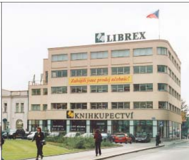
Na první pohled vypadá obchodní dům stále stejně.