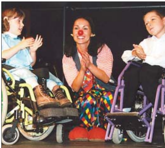
DIVADLO PATŘILO DĚTEM. Česko-francouzské dny v Ostravě jsou jednou z akcí, která tradičně získává podporu z městských grantů. Jubilejní desátý ročník se konal v září a byl zaměřen na integraci handicapovaných osob formou kultury a volnočasových aktivit. Snímek pochází z prezentace v divadle loutek.