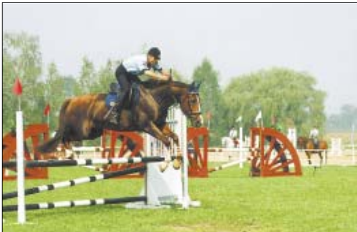
Soustředění jezdce i koně nad jednou z překážek.

Jezdecký areál ve Staré Bělé se poslední srpnovou sobotou stal dějištěm pátého ročníku Setkání jízdních policí spojeného s jezdeckými soutěžemi. Díky účasti bratislavských strážníků šlo tentokrát o setkání mezinárodní. Do startovní listiny se kromě nich a hostitelů z Ostravy zapsali také příslušníci městské policie (MěP) z Brna, Pardubic a Policie České republiky (PČR) z Brna a Zlína.