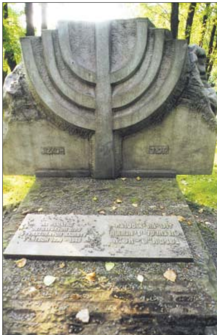
Památník obětem holocaustu v sadu M. Horákové.

Nacističtí představitelé přicházeli s návrhy „konečného řešení židovské otázky“. Ostrava díky tomu získala jeden smutný primát v podobě vůbec prvního židovského tran-