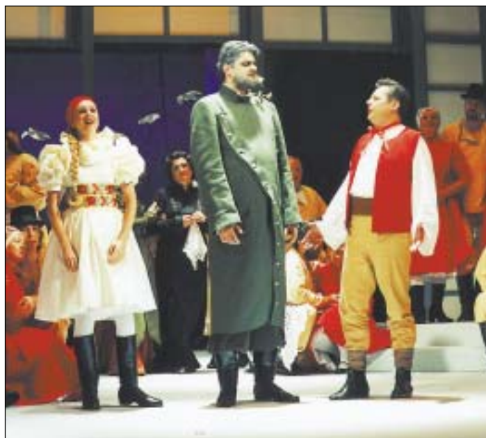
Snímek z poslední premiéry předcházející sezony v NDM, opera Dvě vdovy Bedřicha Smetany .

„V současné době se zpracovává projektová dokumentace, v roce 2003 by rekonstrukce měla začít a v září 2004 bychom se mohli přestěhovat z dosavadních prostor na Masarykově náměstí. To je ideální předpoklad. Jaká bude skutečnost teprve uvidíme. Společné sídlo knihovny a divadla považují za velmi šťastné řešení, které bude ku prospěchu kultury ve městě i návštěvníků obou zařízení. Spolupráci jsme si už několikrát vyzkoušeli, například v rámci Evropského svátku hudby nebo dětského festivalu Arénka a vždy fungovala bezchybně. Obě organizace navíc mají společného zřizovatele - statutární město Os-