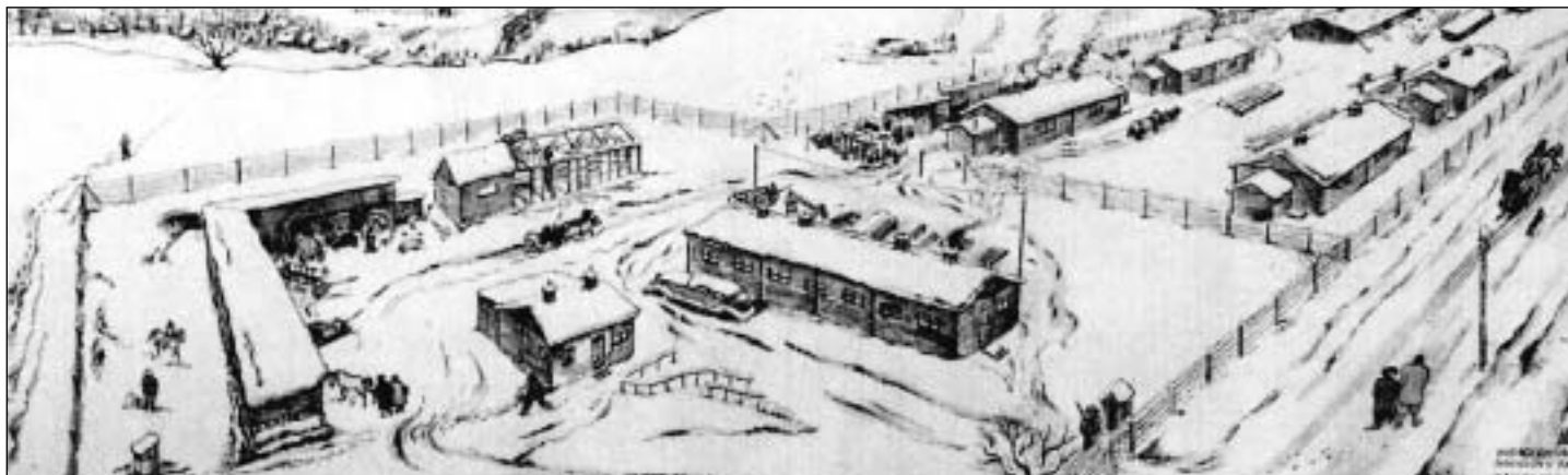
Koncentrační tábor v Nisku nad Sanem.