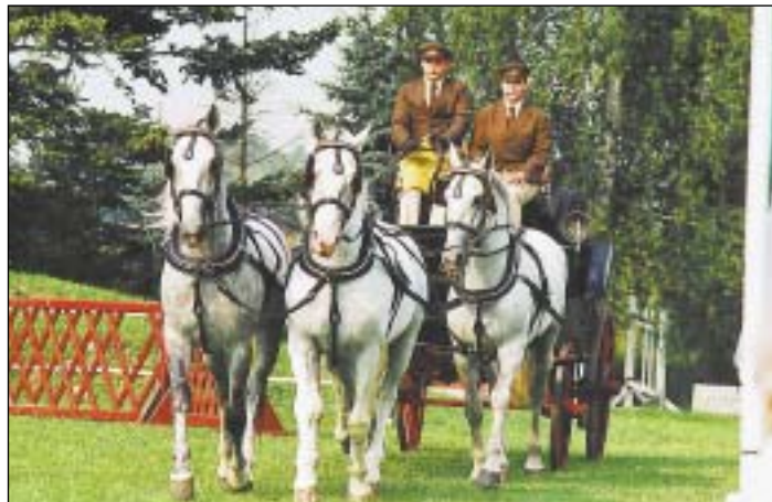
Pýcha Národního hřebčína Kladruby nad Labem – čtyřspřeží běloušů.

Zvláštností sobotních závodů byla skutečnost, že policejní koně nejsou cvičeni pro parkurové skákání. Jejich hlavním posláním je pomoc strážníkům při hlídkové činnosti