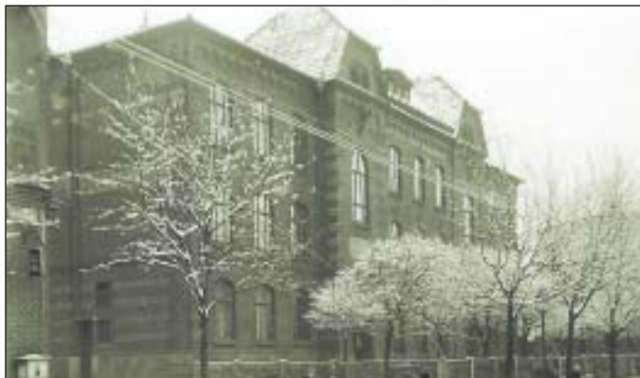
Obecná škola v Přívoze - poslední zastávka před transporty.

postupně shromažďováni s povoleným zavazadlem v Habrmannově obecné škole v Přívoze (dnes střední škola v ulici Na Mlýnici) v relativní blízkosti nádraží. 18., 22., 26. a 30. září 1942 začala pro většinu účastníků těchto nedobrovolných transportů do Terezína cesta bez návratu,“ dodala B. Przybylová.