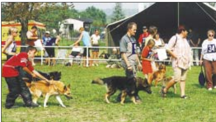
Všichni na start!