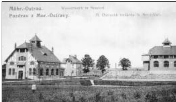
Objekty vodárny, které postavilo město Moravská Ostrava v roce 1890.