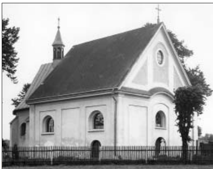
Filiální kostel sv. Bartoloměje.