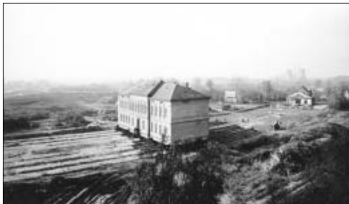
„Škola na kolečkách“ a její přesun z důvodu výstavby nové komunikace.