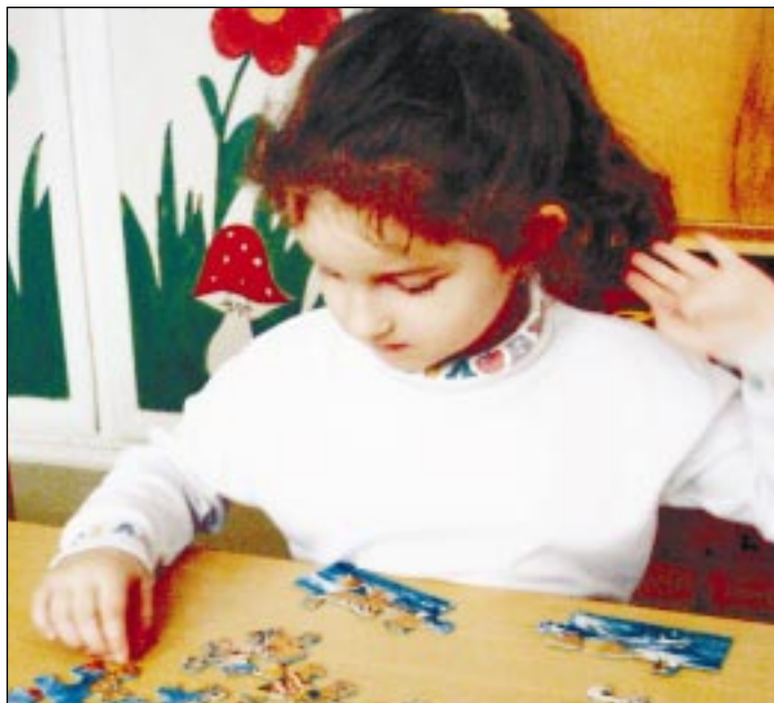
PUZZLIÁDA. Mateřská škola na ul. Čs. exilu 670 v Ostravě-Porubě v březnu hostila čtvrtý ročník soutěže pro handicapované děti ve skládání puzzle.

Ekonomická stránka, tedy to, zda je provoz předškolních zařízení hospodárný, je ožehavým problémem. Potvrdila to i ing. Kuchařová: „Nepříznivý demografický vývoj je dostatečně znám, dětí ubývá a problém ekonomiky provozu nabývá na intenzitě. Každé rušení školky pochopitelně vyvolává nesouhlasné reakce ze strany rodičů v dané lokalitě a nepříjemné je také pro statutární město Ostrava, jako zaměstnavatele pedagogů i správních zaměstnanců. Jenže čísla hovoří jednoznačně. Ve školním roce 1999/2000 bylo na území města 111 školek s 8 414 dětmi. Následující školní rok už bylo dětí pouze 7 859 a školek 107. Letošní čísla uvedená v úvodu tohoto článku dokládají další snížení počtu dětí. Ke konci letošního školního roku proto předpokládáme uzavření jedné mateřské školy.“ (ol)