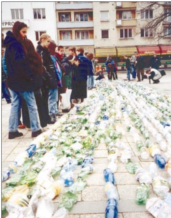
Předcházející ročníky oslav Dne Země v centru města se setkaly s velkým zájmem.

Tisíce organizací a milióny jednotlivců na celém světě oslaví v dubnu svátek Modré planety. První Den Země zorganizovali američtí studenti 22. dubna 1970, aby prosadili přijetí nových ekologických