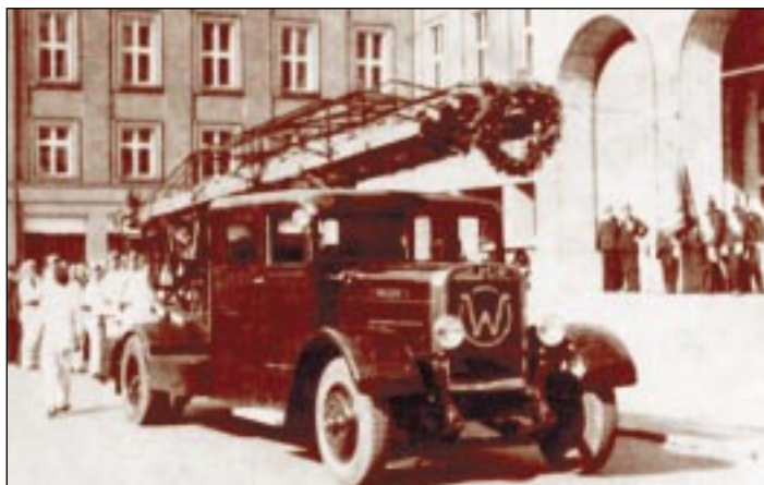
Slavnostní předání automobilového žebře dobrovolnému hasičskému sboru (1935) před Novou radnicí.