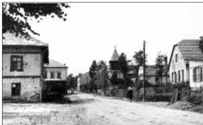
Martinov (dnes ulice Martinovská) v roce 1945

„Kulturní život v Martinově po roce 1918 představovala především vystoupení Sokola, ochotnického kroužku a DTJ. V roce 1922 si ale občané začali stěžovat, že vedení obce povoluje příliš mnoho tanečních zábav a poskytuje tak příležitost k marnivosti a utrácení peněz. Bylo jich celkem třiadvacet. Kronikář však správně upozornil, že dospělí sice povolovali účast na zábavách svým dětem, ale hojně a rád je navštěvovali také. Stížnost byla nakonec vyřešena v prosinci 1922 radikál-