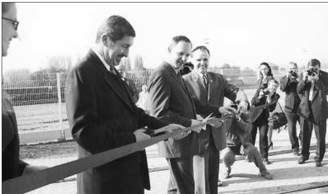
Primátor města Ostravy Čestmír Vlček přestřižením pásky otevřel novou vozovnu.