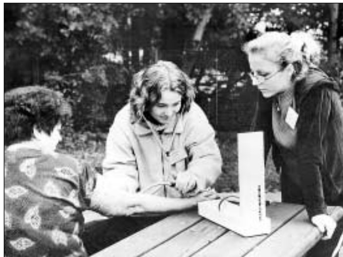
O preventivní akci zdravotníků je mezi občany zájem.

Bližší informace zájemcům poskytnou pracovníci je možno získat na oddělení podpory zdraví Krajské hygienické stanice Ostrava, tel. 063/611 85 05 nebo 0606 73 83 22. (ŠÁ)