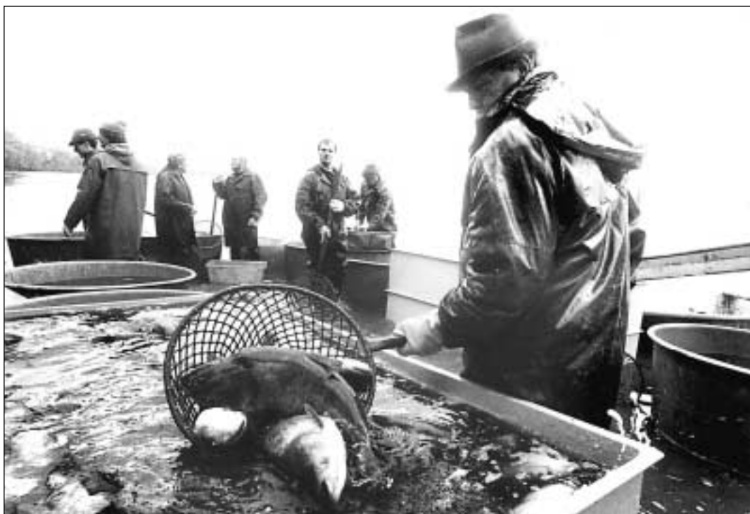
O osudu šupináčů je už i letos rozhodnuto...

Zajímalo nás, jak náročná je taková zkouška, zvláště, když po jejím složení získá stráž statut veřej-