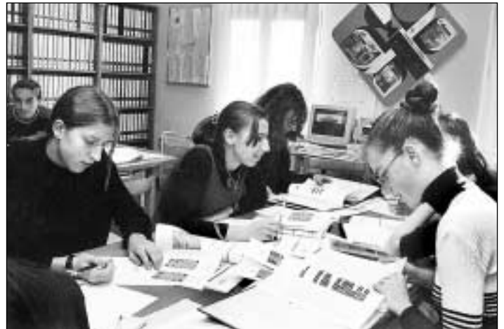
Každoročně tisíce žáků ostravských základních, speciálních a zvláštních škol si ve středisku pro volbu a změnu povolání ujasňují, čím být.

Kromě řady jiných důvodů, proč usilovně pracovat na strategiích rozvoje kraje a strategii rozvoje lidských