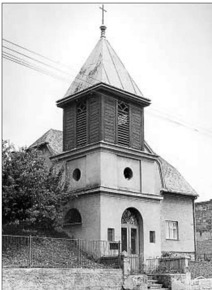
Kaple postavená v roce 1931

ním rozhodnutím obecního výboru o povolení pouze dvou zábav, a to s ohledem na počet dvou místních hostinců s tím, že čistý zisk poplyne do obecní pokladny,“ uvádí B. Przybylová. Obě akce skončily nečekaně deficitem. Organizátoři zábav zaúčtovali do nákladů všechno možné. A proto už 21. ledna 1923 bylo rozhodnutí zrušeno a nahrazeno novým usnesením. V něm bylo napsáno: „...Převládá dosud mínění, že se nesmí pro obec nic z ochoty udělati, nýbrž že je povinností každého občana prováděti podniky, pořádané ve prospěch obce tak, aby obec z nich ničeho neměla.“ (M, B)