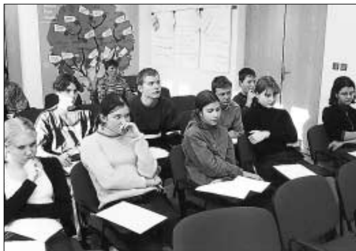
Rozhodovat o své budoucnosti v patnácti letech je obtížné.