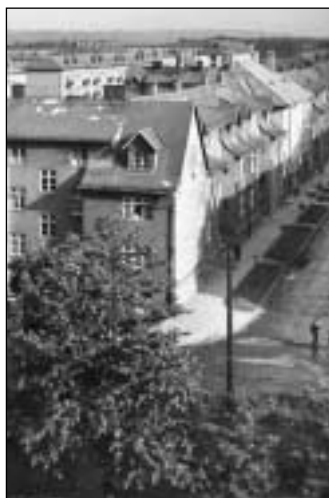
Pohled na tzv. Šídlovec