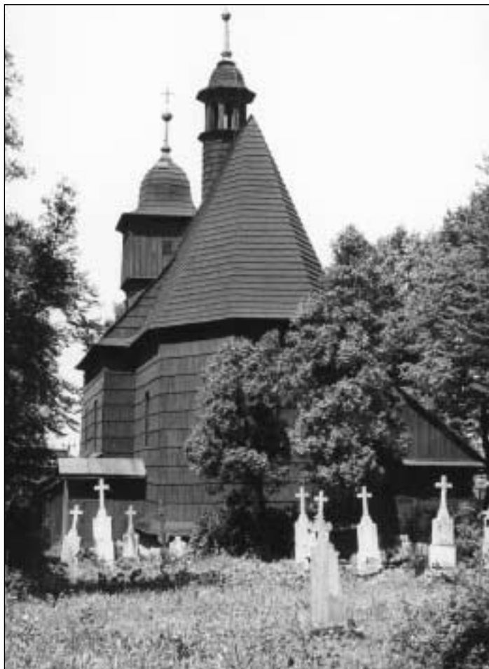
Dřevěný kostelík sv. Kateřiny

Zahájení těžby uhlí i výstavba vítkovických železáren se Hrabové dotýkaly jen druhotně, i když v těchto nových provozech našla zaměstnání většina zdejších obyva- tel. A zase pracovníci dolů a žele- záren začali v Hrabové bydlet. Nicméně část místních občanů do- cházela za prací do blízké vrati- movské celulózky. (M, B)