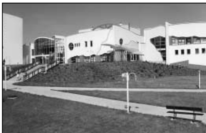
Klímkovická jodová sanatoria mají už dobrou pověst i v zahraničí, účastníkům regionálního dne se rovněž zamlouvala.

Jantarová stezka byla od pradávna obchodní trasou ze severu na jih Evropy a spojnici mezi Baltem a Jadranem. Dodnes se podél této