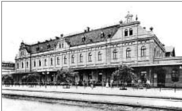
Pohled na nádražní budovu počátkem 20. století.

„Do života této zemědělské obce výrazně zasáhla výstavba komunikací. Vůbec první hospodářský rozmach přineslo Svinovu po-