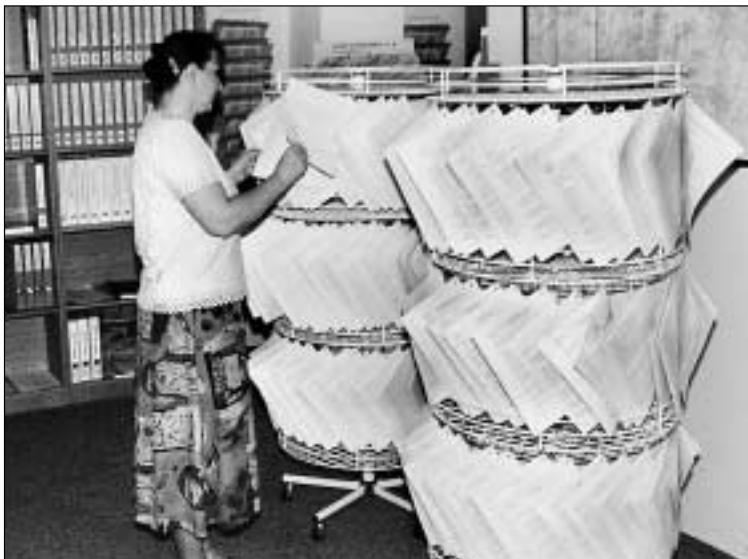
Ilustrační foto: archiv.

znam i jejich schopnost orientovat se na trhu práce. Při jednáních s potenciálními zaměstnavateli by měli umět co nejlépe prezentovat své kvality, znát nejen svá práva a povinnosti ve vztahu k zaměstnavatelům, ale také práva a povinnosti zaměstnavatelů k nim. Nezbytná je rovněž jejich představa o podmínkách samostatného podnikání a povědomí o institucích, které jim mohou při vstupu na trh práce pomoci. Absence těchto schopností, znalostí a dovedností je jedním z velkých a častých handicapů absolventů při hledání pracovního uplatnění.