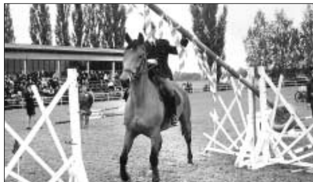
Zvládnout bez výraznějšího zaváhání překážky speciálního parkuru vyžadovalo notnou dávku odvahy, ale hlavně perfektní souhru jezdce i koně.

Po slavnostním nástupu a dekorování nejlepších bylo dost důvodů ke spokojenosti.