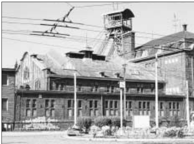
Důl Michal je snadno přístupný městskou dopravou, na konečnou zastávku do Ostravy-Michálkovic návštěvníky zaveze autobus č. 49 a trolejbusy č. 101 a 104.

Za dobu své historie prošel důl mnoha stavebními i provozními úpravami. Nejdůležitější byla přestavba z let 1913 - 1915, kdy byly nově vystavěny všechny nadzemní budovy a dále došlo ke koncentraci těžby z okolních menších dolů a k plné elektrifikaci provozu. V nově vybudované strojovně tak bylo umístěno strojní zařízení z roku 1912, tj. první elektrické těžní stroje, kompresory a rotační měniče elektrického proudu.