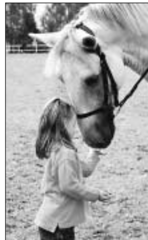
Nezbytná kostka cukru přišla k chuti...