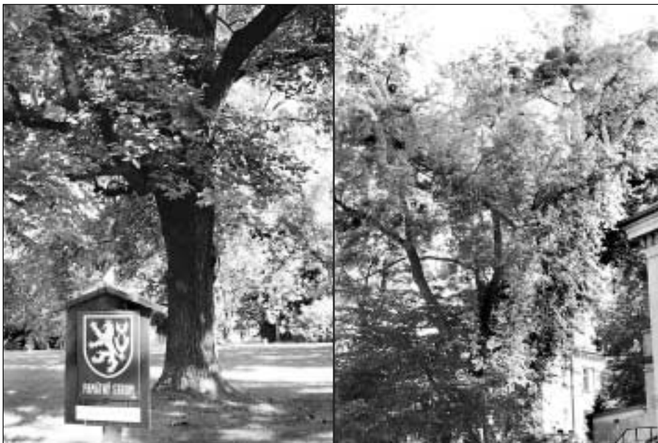
Vlevo liliovník tulipánokvětý v třebovickém parku, vpravo javor stříbrný v zahradě MŠ v ul. Blahoslavova.

Přestože je péče o památné stromy především povinností vlastníka (viz ustanovení 7 odst. 2 zákona č.