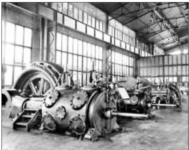
Pohled do původní strojovny dolu.

V rámci Dnů evropského dědictví můžete navštívit Důl Michal 8. a 9. září 2001 zdarma.