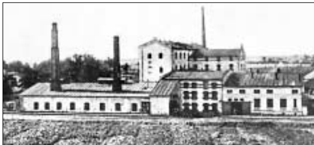
Komplex parního mlýna s velkopekárnou.