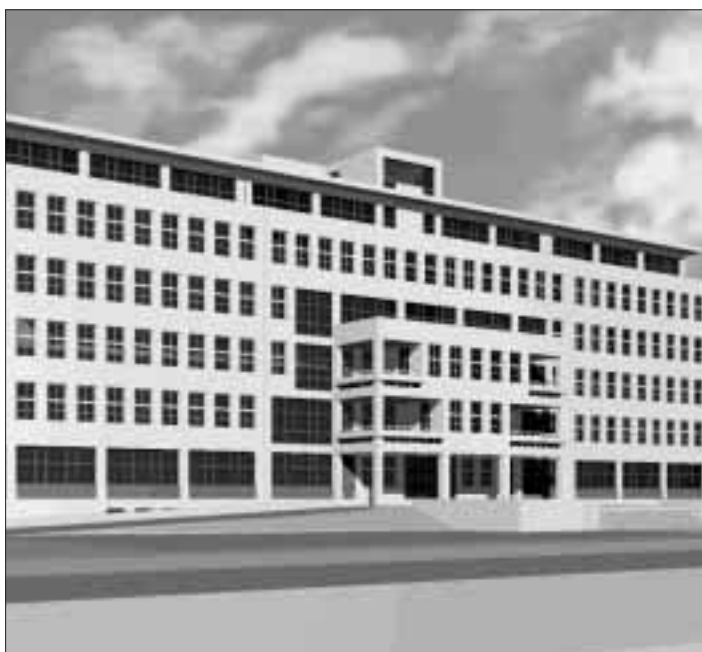
Sídlo krajského úřadu Ostravského kraje. Takto je zpracoval v ArchiCADu Ing. arch. Petr Čvanda z Ateliéru Idea, s. r. o.