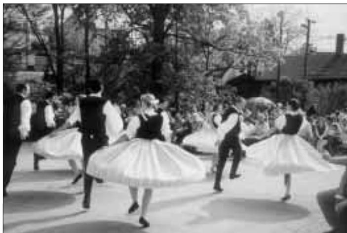
Roztančená Májová Plesná.