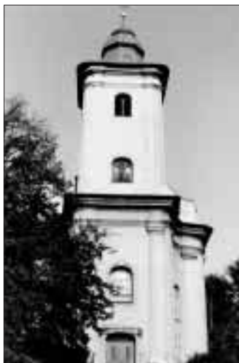
Kostel sv. Jakuba Staršího.

v roce 1938 tato úplně česká obec odtržena od Československé republiky a stala se součástí Sudetské župy. Po osvobození v roce 1945 byla Plesná nejdříve začleněna do okresu Hlučín, v roce 1960 do okresu Opava, v roce 1976 byla připojena k Ostravě. Až do roku 1993 byla součástí městského obvodu Poruba, z něhož se vyloučila na základě výsledku referenda. K 1. lednu 1994 se stala Plesná samostatným obvodem města Ostravy. (M, B)