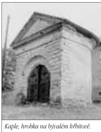
Kaple, hrobka na bývalém hřbitově.

Jak dodává, Plesná patří k nejstarším doloženým vsím na Ostravsku. „Poprvé je připomínána 17. prosince 1255 v závěti znojenského purkrabího, moravského maršálka, brněnského podkomo-