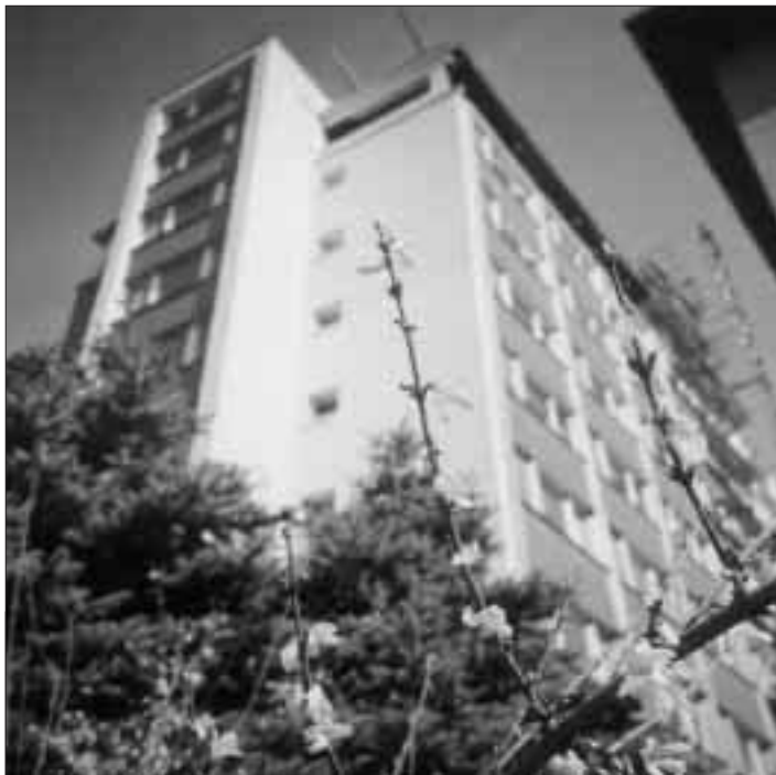
Milovými kroky se blíží otevření Domu na půl cesty.

Nová ulice je situována v lokalitě za kolejemi VŠB-TU a bude procházet budovaným areálem Vědecko-technologického parku. Začíná na křižovatce s ulicí Studentskou a bude prodloužena až ke křižovatce s ulicí Kránsopolskou. Pojmenování dosud nepojmenované ulice v Pustkovci je velmi naléhavé z prostého důvodu – v červnu tohoto roku totiž dojde ke kolaudaci provozní budovy společnosti Ingeletic v areálu parku a budoucí uživatelé budou potřebovat zapsat své sídlo do obchodního rejstříku. Přesná adresa je nezbytností