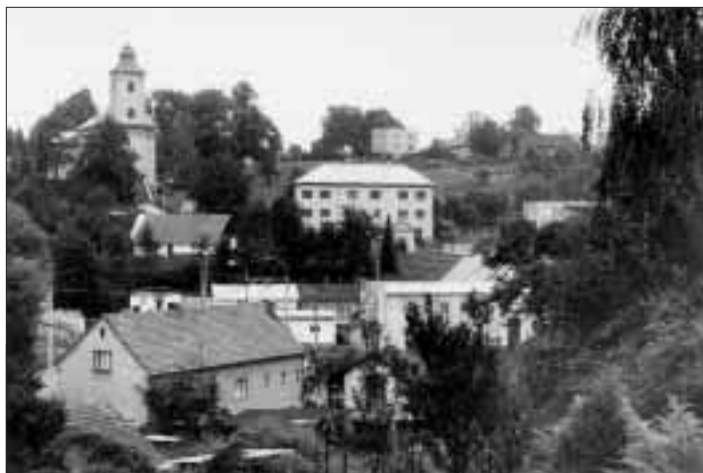
Pohled do ul. Dobroslavické (kostel sv. Jakuba Staršího, bývalá škola, dnes základní umělecká škola, v budově je také obvodní zdravotní středisko, v popředí je upravená kaplička, která stojí v parčíku 28. října).