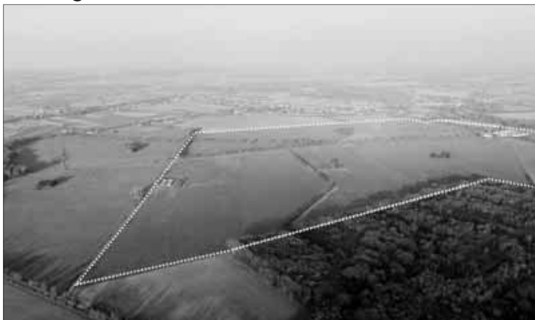
Pakliže vše dopadne podle předpokladu, Šilheřovice se stanou významným centrem lehkého průmyslu s možností několika tisíc pracovních míst.

„Prověřili jsme velmi důkladně všechny plochy určené územním plánem k využití pro lehký průmysl na území Ostravy. Bohužel jsme dospěli k názoru, že tak velká