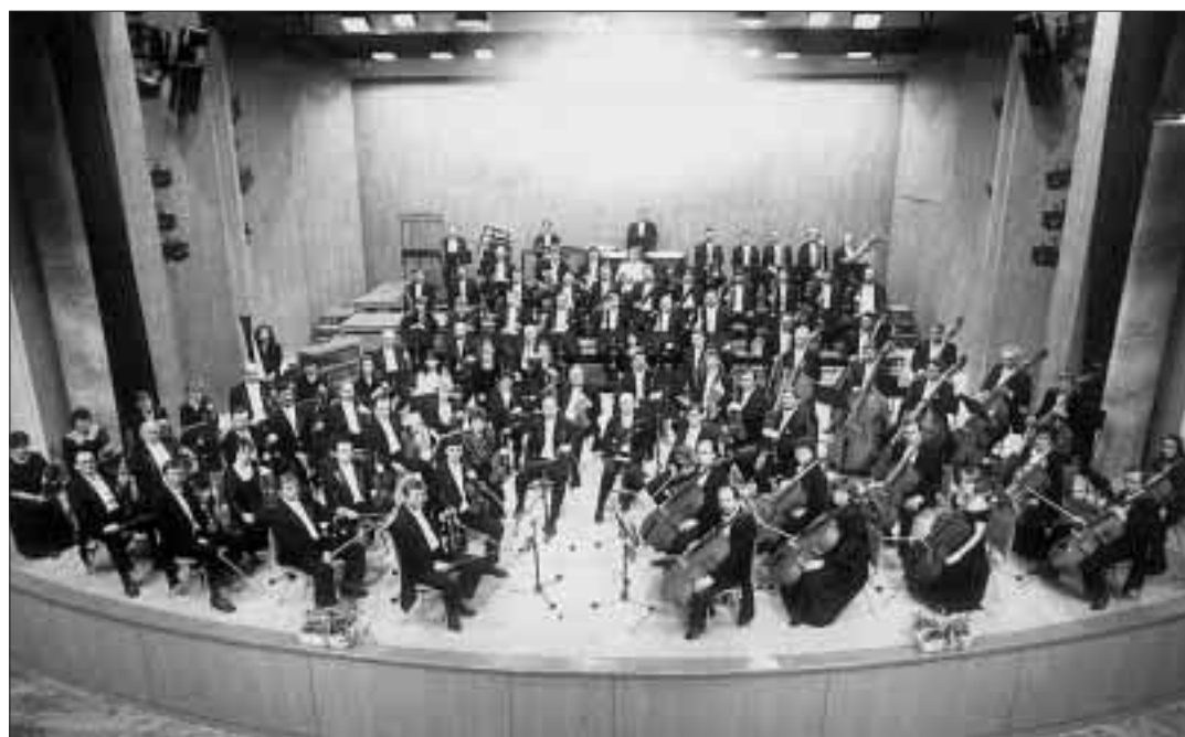
Janáčková filharmonie Ostrava.

„Česká hudba je poněkud zvýrazněna, a to v konfrontaci s hudbou dalších národních kultur – německou, dánskou, polskou... Také program závěrečného koncertu je po letech věnován českému dílu – Svatebním košilím A. Dvořáka, jinak velmi sporadicky uváděnému. Česká soudobá hudba je logicky včleněna do jednotlivých programů a nevytváří tak ‚rezervaci‘ či cosi výjimečného, s ničím neslučitelného – výjimkou je tradiční matiné skladatelské soutěže Generace, která