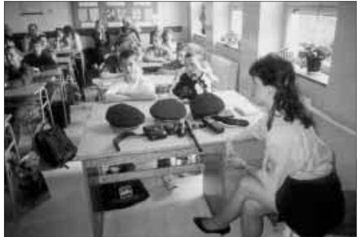
Besedy členů občanského sdružení Faust vhodně doplňují přednášky preventivistů z řad Policie ČR a strážníků Městské policie Ostrava.

● Vem si žlutou tužku, namaluj mi hrušku, a pod hrušku talíř, sláva, ty jsi malíř! Tyto verše Františka Hrubína by mohly být mottem v záhlaví výtvarné soutěže Beruška, kterou už počtvrté vyhlašuje Dětské centrum Ústavu sociální péče pro mentálně postižené Ostrava. Soutěž je určena pro děti i dospělé ze speciálních vzdělávacích a sociálních zařízení z celé republiky. Na obrazy i trojrozměrné práce na letošní téma Z pohádky do pohádky