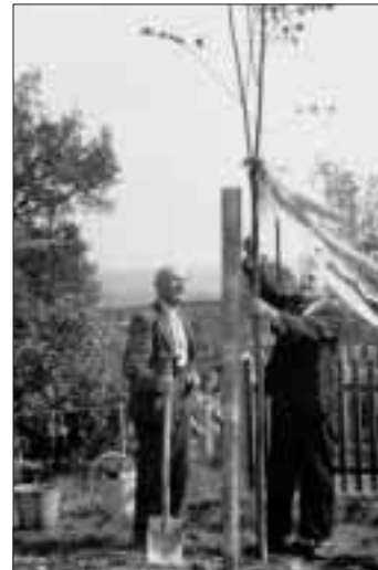
Sázení Lípy svobody 12. května 1946.

a dokládá údaje o počtu obyvatel v určitých časových obdobích. Například v roce 1840 měla obec 482 obyvatel, na konci 19. století to bylo 775 a v roce 1910 už 1 028 osob. V šedesátých letech 20. století žilo v Hošťálkovicích ve 300 domech a zhruba 500 bytových jednotkách přes 1 600 obyvatel. (MaB)