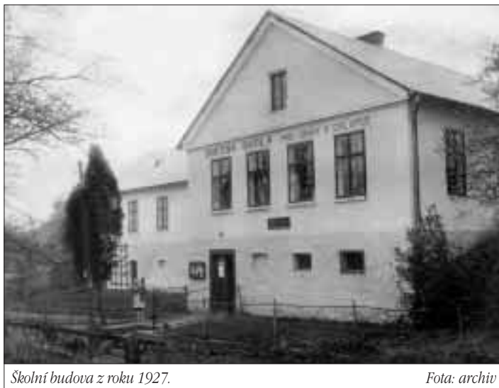
Školní budova z roku 1927.