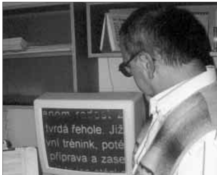
Účelovou dotaci ve výši 120 000 Kč získala také obecně prospěšná společnost Tyfloservis zajišťující služby nevidomým a slabozrakým.

Podrobný jmenovitý seznam subjektů, jimž byly uděleny granty a účelové dotace, bude zveřejněn na webové stránce města a v březnu 2001 také ve zvláštní příloze Ostravské radnice. (S)