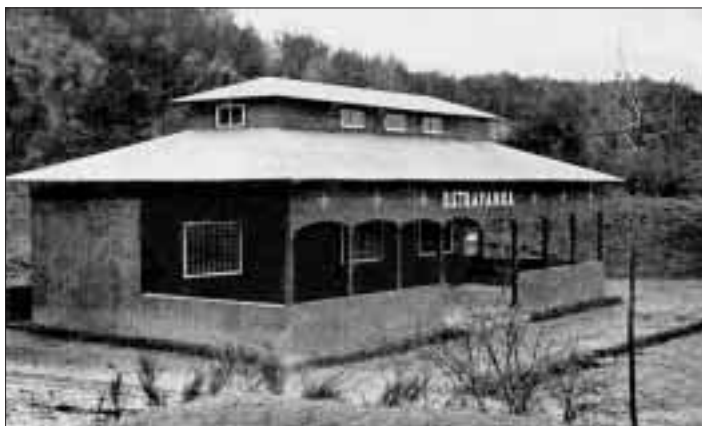
Dělnické letovisko Ostravanka v Hošťálkovicích. Archiv města Ostravy se obrací na pamětníky s žádostí o přesnou lokalizaci tohoto objektu a bližší informace o něm.