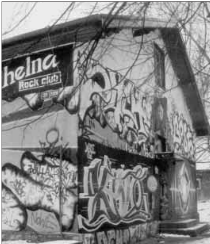
Kontaktní street centrum naleznete v budově bývalého rockového klubu Cihelna na Mariánskohorské ulici č. 29 v Ostravě-Přívoze.