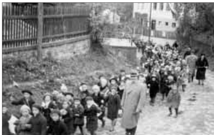
Průvod žáků obecní školy. Dne 4. 10. 1936 se konala slavnost položení základního kamene ke stavbě nové školy.