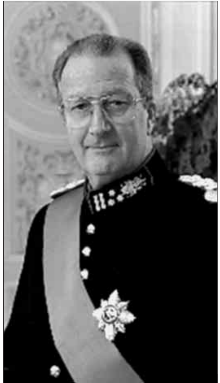
Jeho Veličenstvo Albert II., král Belgů.

Ve dnech 24. až 26. října přijede na státní návštěvu České republiky belgický král Albert II. s královnou Paolou. Městu Ostravě se dostalo té mimořádné cti uvítat vzácné hosty na závěr jejich třídní návštěvy, tedy ve čtvrtek 26. října.