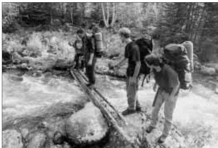
Členové expedice při přechodu jednoho z ramen řeky Velkij Čivirkuj.