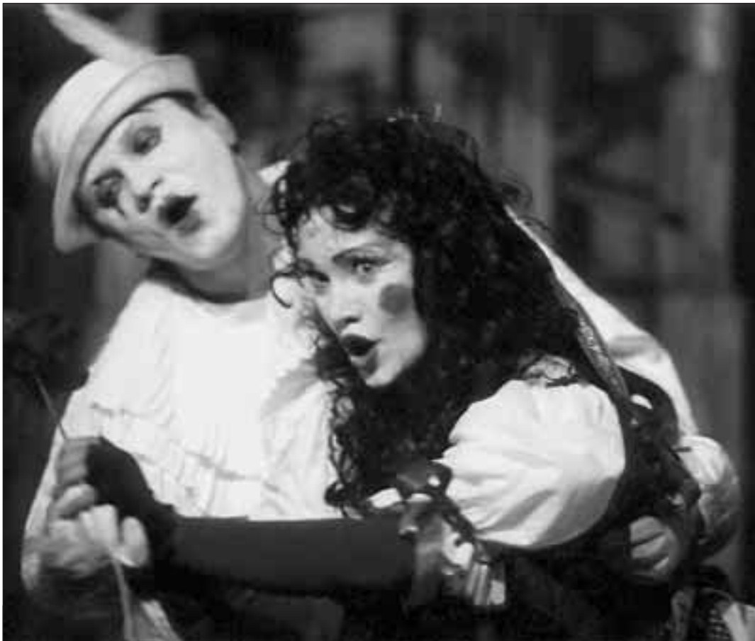
Národní divadlo moravskoslezské zahajuje právě svou 81. sezonu. Divadlo a jeho diváky v ní čeká mimo jiné „nové“ Divadlo Antonína Dvořáka, kam se před koncem roku 2000 vrátí operní, činoherní a baletní soubor. Do zrekonstruované budovy bude přenesena i první ostravská inscenace opery-baletu Bohuslava Martinů Divadlo za bránou, která stačila v závěru loňské sezony už za necelý měsíc své existence nadchnout část ostravských diváků. Pokud vás zajímá, jaké to je, když se v opeře létá, tančí, mluví, zpívá, improvizuje a hraje pantomima, pak právě na vás Divadlo za bránou čeká 20. a 26. září - tentokrát však ještě stále v divadle Jiřího Myrona... (pb)

Předplatitelské legitimace případně vstupenky na jednotlivé koncerty nové sezony si můžete zajistit v pokladně DK Vítkovice nebo v Městském informačním centru Ostrava. Lahůdkou pro milovníky hudby bude patrně už 20. října v 19.30 hod. ve společenském sále DK Vítkovice mimořádný slavnostní koncert k inaugurační varhan.