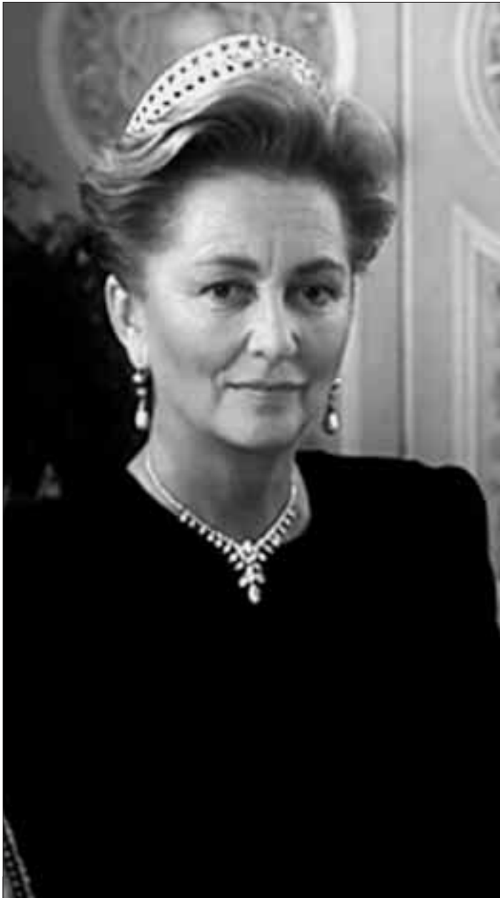
Její Veličenstvo královna Paola.