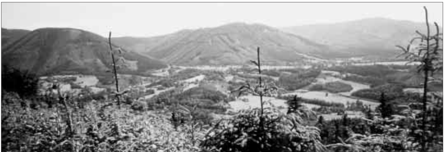
Nastávající - meteorology slibované krásně - babí léto bude v Beskydech bezesporu také letos velmi půvabné.