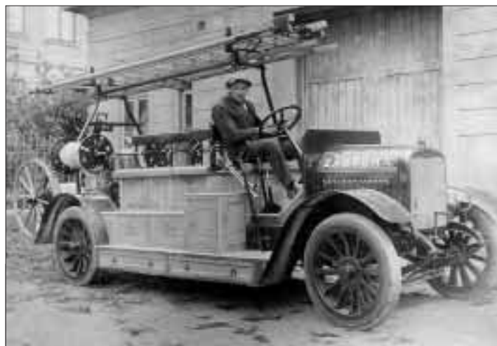
První automobilová stříkačka českých hasičských sborů na Ostravsku, kterou používali od roku 1924 zábřežští dobrovolní hasiči.

● Vítkovická nemocnice Blahoslavené Marie Antoníny, a. s., upozorňuje občany na nové telefonní číslo nemocniční ústředny - 563 31 11. Po celých 24 hodin denně je v provozu rovněž tel. linka Centra informací a služeb - 563 36 66, prostřednictvím které lze objednat např. pizzu, pacienta k plánované hospitalizaci i jednotlivým vyšetřením, doprovod pro klienty v areálu nemocnice, ale i převoz pacienta sanitním vozem či ubytování s ošetrovatelskou péčí za úhradu.