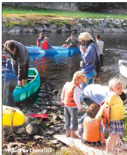
Vodáci na Ostravici