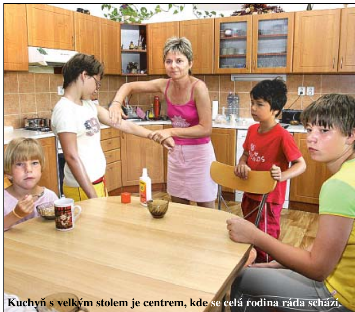
Kuchyň s velkým stolem je centrem, kde se celá rodina ráda schází.

„Bětko se u nás zklidnila,“ řekla náhradní matka. Podle ní je nejdůležitější pro všechny děti pocit, že na ně táta a máma mají čas, mají je rádi a že je jejich problémy skutečně zajímají. Pohlázení, slovo pronesené v ten pravý okamžik dělá divy. Hodně pomáhá také rodinná rada, kde o problémech hovoří všichni, ať už se týkají těch nejmladších, s nimiž jsou ještě starosti jednoduché, nebo těch dospívajících, kde už se často rozhoduje o jejich budoucnosti. Udělují se i tresty. Třeba za lež nebo nesplněný úkol se strhává týdenní kapesné. Rodinná rada však řeší i větší výdaje nebo, kam se pojedou na dovolenou. Letos prožijí srpen