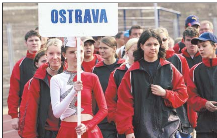
Ostravští školáci nastupovali do závodu s velkým odhodláním.