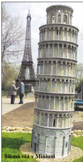
Šikmá věž v Miniuni

■ 4. – 13. srpna Hotel Imperial, pláž před hotelem – Beach party