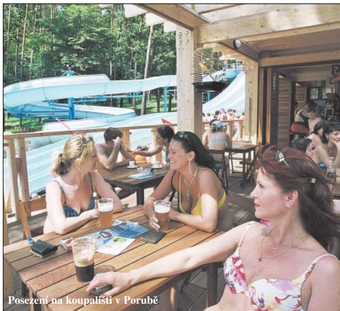
Posezení na koupališti v Porubě

Od května do září nabízí ostravští vodáci půjčování lodiček a kanoí na slepém rameni řeky Odry pod Landekem pro školy, organizované skupiny i jednotlivce. V případě zájmu zajistí výcvik, sjezdy a půjčování vodních plavidel v centru města. (ta, kon)