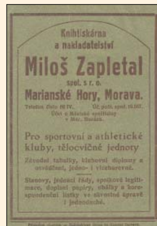
Reklamní letáky knihtiskárny Miloše Zapletala.