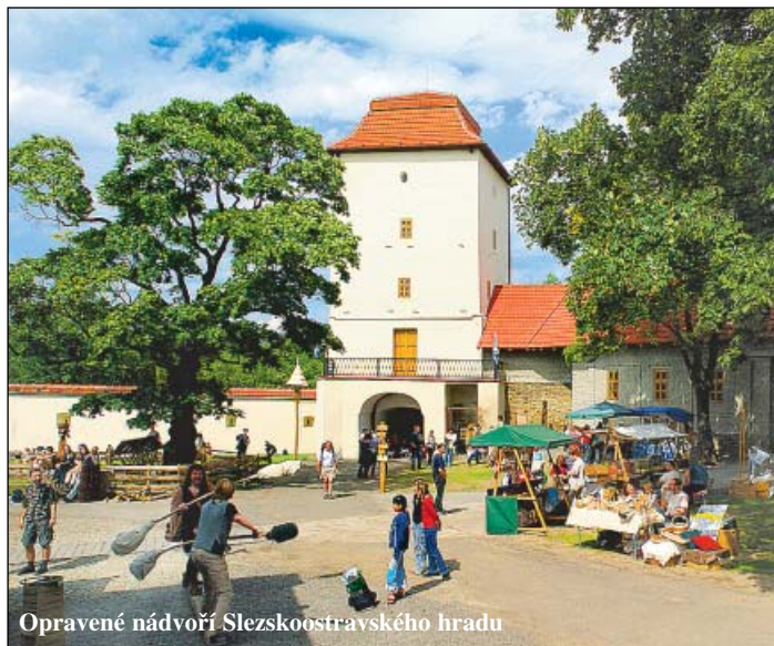
Opravené nádvoří Slezskoostravského hradu

Hustá síť cyklostezek zajišťuje milovníkům horských i silničních kol nevšední zážitky ve městě i v okrajových částech Ostravy. K poznávání nových míst láká 180 kilometrů značených tras, z nichž 75 procent vede po méně frekventovaných silnicích