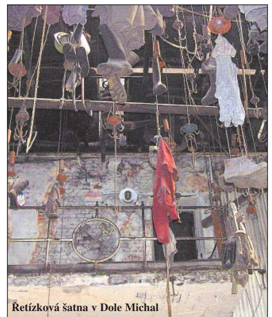
Řetízková šatna v Dole Michal