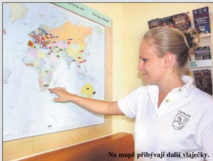
Na mapě přibývají další vlajčky.

Otevřeno: po-pá 7 – 20.30 hodin so 7 – 12 hodin a 12.30 – 15 hodin ne 12.30 – 16 hodin a 16.30 – 20.30 hodin