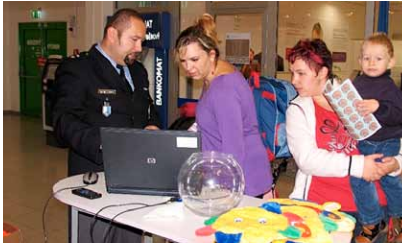
Nakupující v obchodních centrech byli často překvapeni záběry kamer, které zachytily rafinovanost i bezostyšnost zlodějů.

aktivity jsou jednou z účinných metod snížení kriminality. Zvyšují povědomí občanů o možnosti obrany před zloději, kapsáři a dalšími pachateli. Nejúčinnější, nejlevnější a nejjednodušší ochrana je nedávat pachatelům příležitost, aby nás mohli okrást. Akce navazuje na úspěšné projekty Městského ředitelství Policie ČR Společně proti kriminalitě a Vem si mě. (ps)