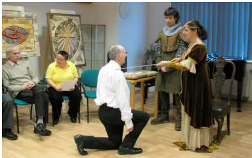
Pasování na čtenáře sklidilo velký úspěch