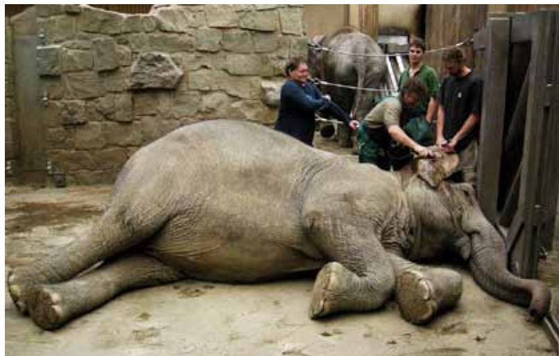
Nácvik starší samice Johti na odběr krve z ušního boltce

lidé provádějící veřejně prospěšné práce proškoleni. Obvod také nainstaluje nové stojany na sáčky, které mohou pejskaři pro své miláčky použít. Desítky košů na tento odpad existují už dávno, lidé se však uklidit do nich odpad příliš nehrnou. V současnosti probíhají intenzivní kontroly, městští strážníci jsou pozornější a neukáznění majitelé psů jsou sankcionováni. Pokuta za tento přešupek může dosáhnout až 1 000 korun. (jk)