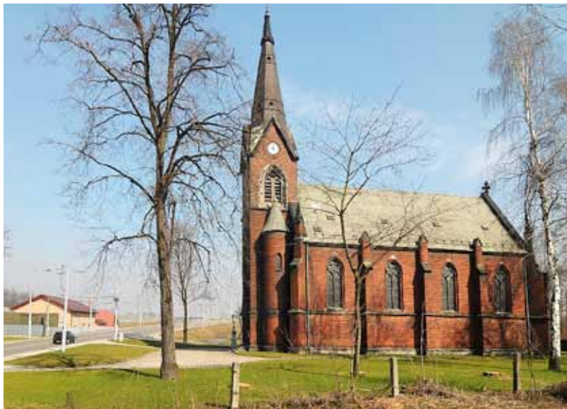
Městská část Hrušov bývala výstavnou lokalitou i s mnoha měšťanskými domy. Kostel sv. Františka a Viktora (vysvěcen v roce 1893) z rezného zdiva je jednou z mála zachovaných budov.

Rozvojová zóna Hrušov nabídne po dokončení plochu o rozloze 40 hektarů. Při nedostatku míst v již existujících průmyslových zónách jde o významnou lokalitu vhodnou pro podnikání malých a středních firem. Předností je ideální dopravní napojení, bezprostřední blízkost dálnice D1 a železniční trati do vnitrozemí ve směru na Polsko a Slovensko. Nespornou výhodou je 51procentní majetkový podíl města Ostravy