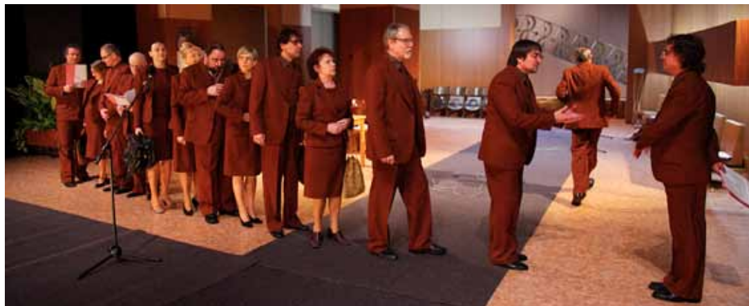
Inscenace Gottland má také zajímavě řešenou scénu a kostýmy