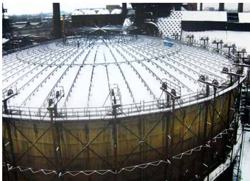
Zvon plynojemu byl do třicetimetřové výšky vyzdvížen o symbolických „kolumbovských“ 1492 centimetrů.

proměny plynojemu budou v rámci oživení a nového využití národní kulturní památky Dolní Vítkovice pokračovat budování prohlídkové trasy vysoké pece č. 1, rekonstrukce tzv. VI. kompresorovny na interaktivní muzeum a další projekty. (vi)