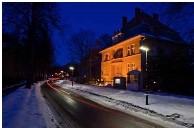
Osvětlení Blahoslavovy ulice (vpravo je budova generálního konzulátu Polska) po instalaci pouličních lamp z LED diod.

Na území města Ostravy jsou už vytipovány další lokality, kde by využití současné LED technologie bylo přínosné. Nejen esteticky, ale především ekonomicky. „V prvním plánu máme komunikace, které navazují na Blahoslavovu ulici. V současné době tyto lokality mapuje projektová kancelář. Dá se říci, že výzkum a vývoj LED technologií jde rychle kupředu. Není proto vyloučeno, že se v blízké budoucnosti dočkáme LED technologie, která bude vyhovující a dostatečná i při využití na klasických vysokých stožárech veřejného osvětlení,“ uzavřela Zatloukalová. (jm)