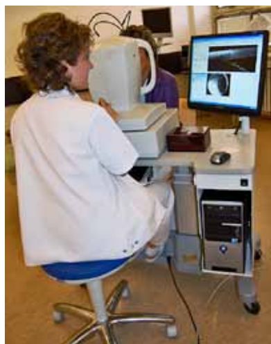
Vyšetření je nebolestivé, přesné, trvá relativně krátce.

Vyšetření na moderním přístroji není hrazeno z veřejného zdravotního pojištění, pacient jej platí sám. Na vyšetření může pacienty objednat oční lékař nebo se mohou objednat sami na recepci oddělení oftalmologie MNO nebo telefonicky na čísle 596 192 263. (r)