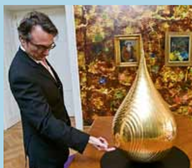
SMUTEK I RADOST. Zlatá slza LacrimAu, unikátní exponát českého pavilonu na loňské světové výstavě v Šanghaji, byla