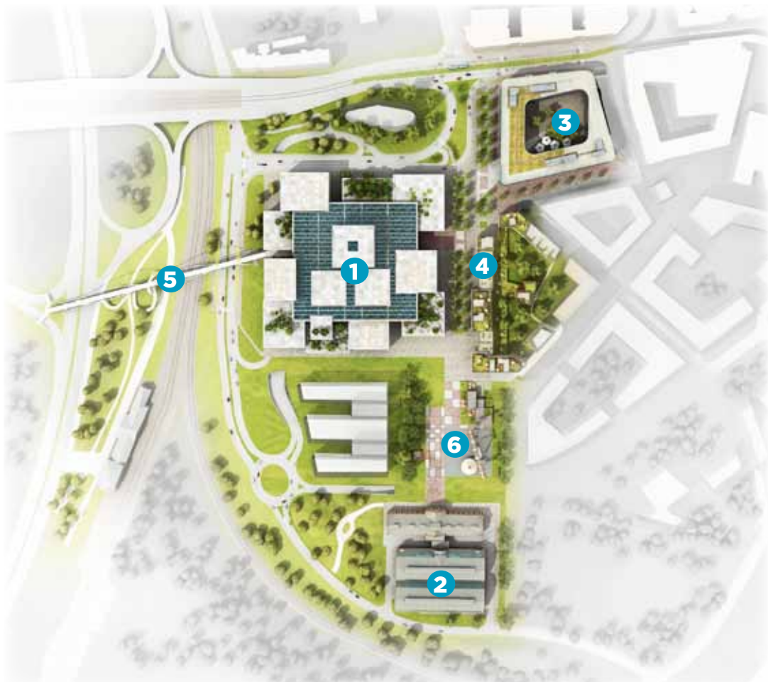
Vizualizace objektů I. etapy výstavby Nové Karoliny: 1. obchodně-zábavní centrum, 2. Dvojhalí, 3. plánovaný administrativní objekt, 4. obytné domy, 5. lávka, 6. náměstí.