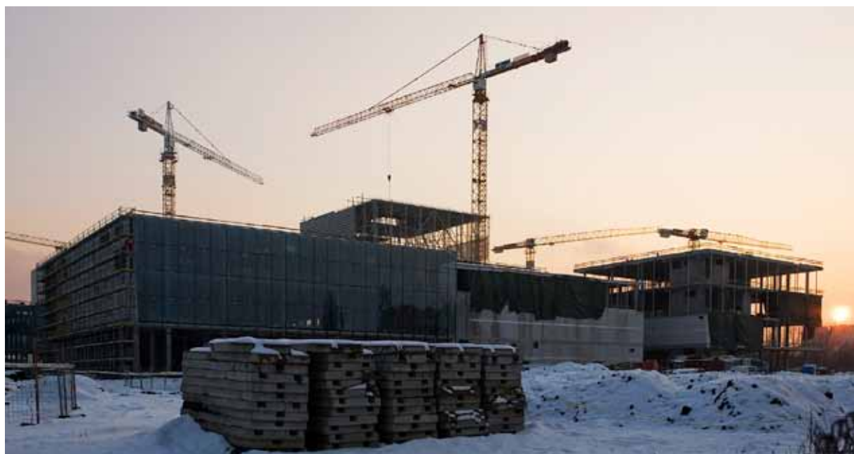
Ze severní strany z ulice 28. října je zeď budoucího obchodního centra už zasklená, práce pokračují rychlým tempem. Vlevo od centra by měl v budoucnu stát administrativní objekt.

„Je užitečné se držet faktů. Během původní developerské soutěže se posuzovaly aspekty jednotlivých nabídek. Cena byla tehdy jednotná, hodnotily se tedy reference, stabilita, zkušenosti a zejména konkrétní urbanistické koncepty nabídek zúčastněných společností. Výsledná smlouva Multi Development s Ostravou tedy obsahuje zejména celkový urbanistický koncept, fázování, základní objemy a jejich funkce v etapách. Probíhající I. etapa má nabídnout obchodní, administrativní a obytné plochy,