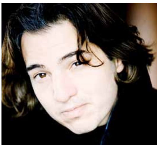
Turecký klavírista Fazıl Say

Určitě nadchne koncert 4. června poprvé v zámku Kunín, ale i koncert k 200. výročí narození Ference Liszta ve dvoraně zámku Hradec nad Moravicí 31. května, kam budou z Ostravy vypraveny autobusy, které dovezou posluchače ještě před koncertem na prohlídku zámku, kde pobýval Beethoven i Liszt. Vše podrobně na www.janacuvmaj.cz . (K)