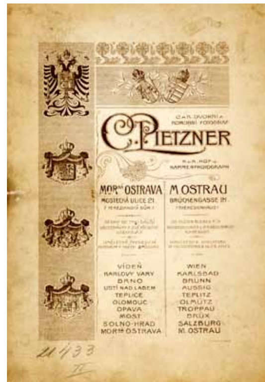
Zadní strana fotografie s reklamou ateliéru