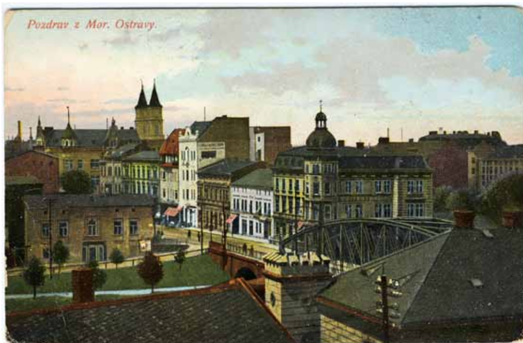
Pohled na dům s věžičkou ze Slezské Ostravy, počátek 20. století