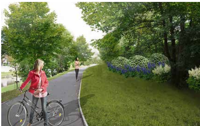
Vizualizace budoucí podoby nábřeží.

„V nejbližších týdnech tady začne výsadba nové zeleně v rámci připravovaného projektu „Revitalizace nábřeží řeky Ostravice“, díky kterému dojde ke komplexní úpravě a řešení veřejného prostoru,“ uvedla náměstkyně primátora pro životní prostředí Kateřina Šebestová. (ph)