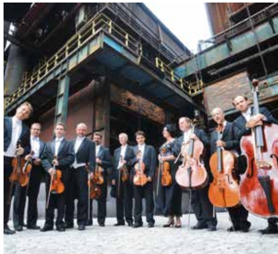
Janáčkův komorní orchestr patří k hudební špičce.

Koncert Janáčkovy komorního orchestru, který se řadí ke stálým ostravské hudební scény a jeho výkony patří tradičně k tomu nejlepšímu z její nabídky, je na programu 23. dubna od 19 hodin ve společenském sále Domu kultury města Ostravy.