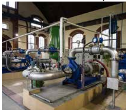
Interiér vodárny v Ostravě-Nové Vsi.

Registrace účastníků probíhá až do 30. dubna na internetových stránkách www.dopracenakole.cz . (mg)