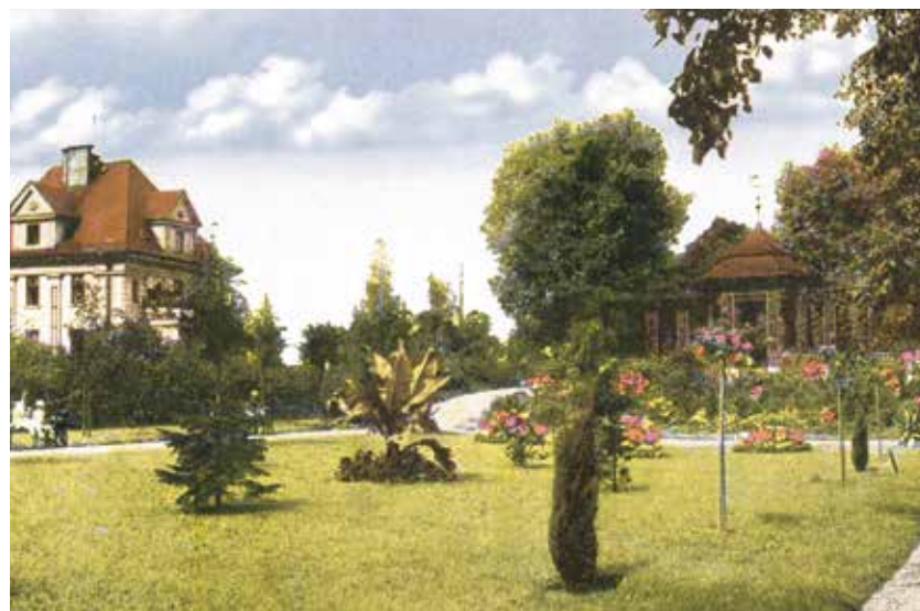
Nově založená část sadu s hudebním pavilónkem.