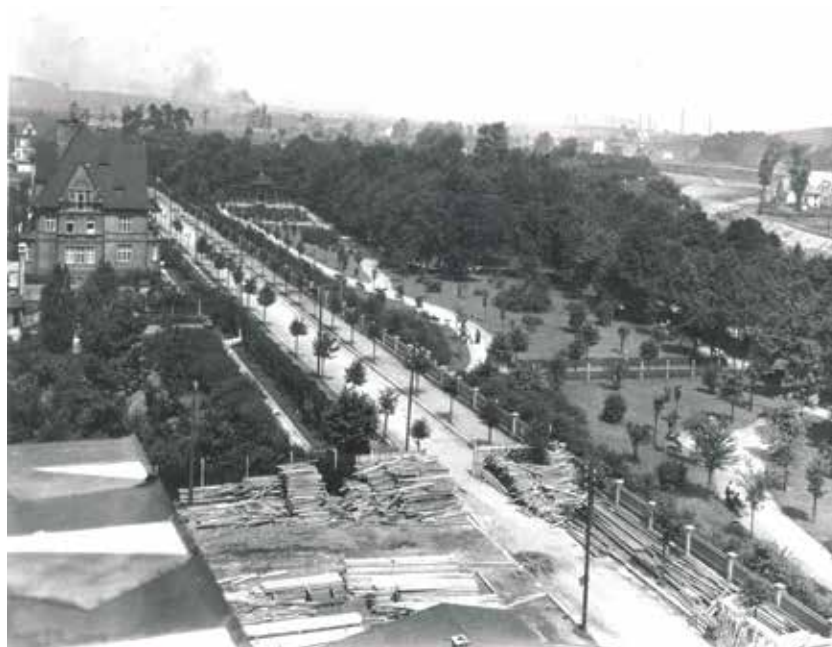
Pohled z rozestavěné Nové radnice, 30. léta 20. století.

Zárodky dnešních Komenského sadů se začaly vytvářet na přelomu století v bezprostředním okolí areálu Nové střelnice, který vyrostl v letech 1891 až 1892 u řeky Ostravice na místě tehdy zvaném Cingl (dnes zde stojí Nová radnice). Okolní louky se staly nedělním dostaveníčkem ostravských rodin, které se mohly zastavit ve výletní restauraci na malé občerstvení nebo si poslechnout koncert některé