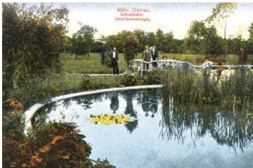
Jubilejní park císaře Františka Josefa, asi 1910.

Původní návrh předpokládal také vybudování palmového skleníku s kavárnou, k čemuž však nedošlo (v letech 1945–1946 zde vyrostl památník Rudé armády). Počítal rovněž s tenisovými kurty, třemi dětskými hřišti, pavilóny, vyhlídkovou terasou, jízdárnou aj. Z původních 7 hektarů se sad zvětšil až na 32 hektarů a stal se tak jedním z největších městských sadů v celé republice. Celkově si rozšíření Komenského sadu vyžádalo přes 4 miliony korun. Šárka Glombíčková