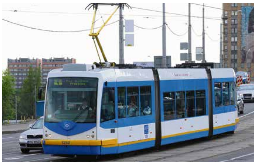
Rozpočet na mytí interiéru tramvají se navýší o další milion korun.

Dopravní podnik Ostrava pokračuje ve svém úsilí zajistit svým cestujícím co nejčistší interiéry a exteriéry vozidel a prostory zastávek. Proto navýšil rozpočet na úklid vozidel ze současných 4,4 na 8,8 milionu korun. Jako první v Česku bude také používat speciální technologii na odstraňování žvýkaček z nástupních ostrůvků. V příštím roce budou vyměněny mycí portály na Hranečníku, ve středisku Tramvaje Moravská Ostrava a na trolejbusích. Nová mycí jednotka na středisku trolejbusů bude na rozdíl od té stávající samoobslužná, rychlejší a výkonnější. O jeden milion korun se navýší roční rozpočet na mytí interiérů tramvají. Cílem je častější úklid na smyčkách a také mytí podlah ve vozidlech. (rs)