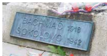
Deska připomínající bitvy u Bachmače a Sokolova.

mostatného praporu, který zpočátku odolával německé přesile, později se stáhl. Účastníci vzpomínkového aktu k oběma bitvám si vyslechli podrobný popis činnosti našich vojsk a poté k pomníku položili kytice.