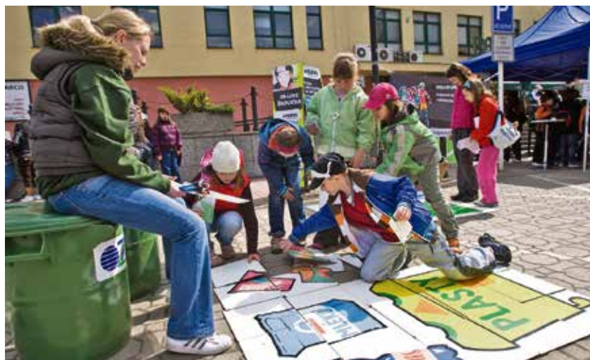
Den Země znamená pro děti zábavu i poučení.

V úterý 24. dubna se Den Země koná v přírodě – ve Výukovém centru Bělský les. SVČ Ostrava-Zábřeh připravuje s Ostravskými městskými lesy a zelení, SPŠ chemickou akademika Heyrovského a dalšími školami a organizacemi soutěže, ekodílny, tvo-