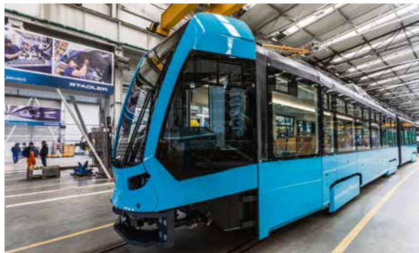
Zbrusu nová tramvaj Stadler Tango NF2 nOVA.

Má modulární konstrukci, ergonomickou kabinu řidiče a je plně klimatizovaná. Otočné podvozky s flexibilním rámem zajišťují hladký chod vozidla a nízký hluk i při vyšších rychlostech. Tramvaj je nízkopodlažní a přizpůsobená osobám s omezenou pohyblivostí, pojme až 188 cestujících. Čelo tramvaje je tvarováno tak, aby zvýšilo ochranu chodců. Při případné kolizi zabrání vtažení osoby pod vůz. (ph)