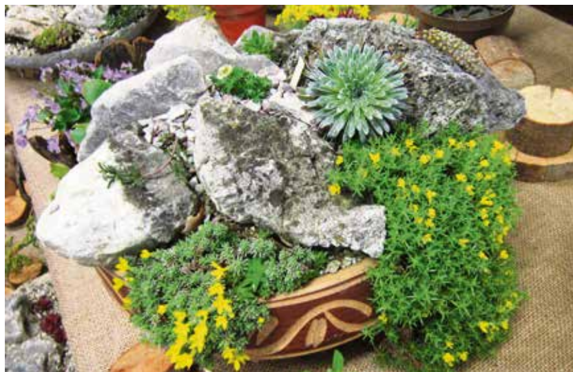
Ukázka malé pestré skalky.

Skalka se dá osadit tak, aby kvetla téměř celý rok. Některé druhy bramboríků vykvetou již v lednu a předběhnou dokonce sněženky. Dobré je zasadit druhy, které kvetením na sebe