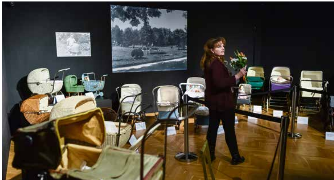
Výstava kočárků v Ostravském muzeu.

Výstavu doplňují panenky a kočárky pro ně, dětské oblečky nebo křídlicí souprava. Chodbu zaplnily historické fotografie maminek a tatínek s kočárky. „Požádali jsme ostravskou veřejnost, aby nám zapůjčila tyto snímky. Těším se, jak se budou návštěvníci na fotkách hledat a poznávat jednotlivá místa,“ usmála se ředitelka Jiřina Kábrtová. Výstava v Ostravském muzeu potrvá do 3. června. (rs)