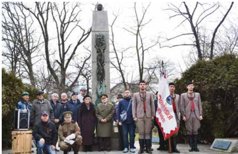
Účastníci vzpomínkového aktu k 100. výročí bitvy u Bachmače a 75. výročí bitvy u Sokolova.

Je náhodou, že o 25 let později ve stejném termínu, tj. od 8. do 13. března, bojovaly československé jednotky během druhé světové války u ukrajinského města Sokolovo. Jednalo se o první bitvu 1. československého sa-