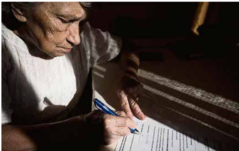
Podomní prodej je na území Ostravy zakázán.

„Jedinou možností je nedělat ukvapené závěry a nereagovat na vybájené nabídky ze strany prodávajícího. Vždy je výhodnější si v klidu a za pomoci rodinných příslušníků či přátel zvážit danou nabídku a zkontrolovat u konkurence „výhodnost“ nabídky. Jediněná akční nabídka není vždy tak vy-