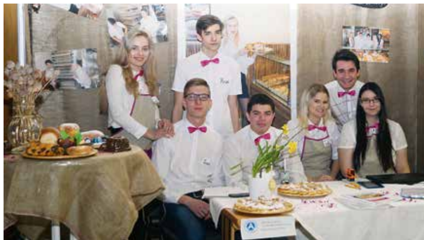
Prezentace firmy Koláčky naší Anežky středoškoláků mariánskohorské obchodní akademie.

Dobré tradice se mají dodržovat. A tak již podesáté Obchodní akademie v Ostravě – Mariánských Horách zorganizovala veletrh fiktivních firem se zahraniční účastí. Konal se tradičně na výstavišti Černá louka. Ve čtvrtek 22. března 2018 si soutěžící připravili své stánky a po slavnostním zahájení začalo obchodování.