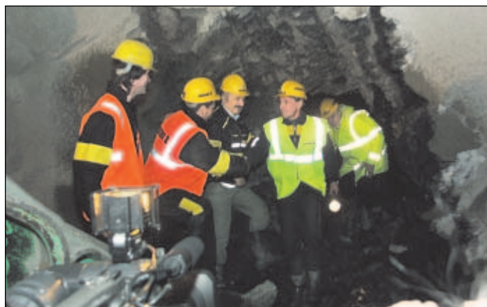
RAŽBA TUNELU. Součástí stavby dálnice D47 na trase Bílovec – Ostrava je tunel Klimkovice. Jeho ražba začala v dubnu tohoto roku. Raziči 12. prosince propojili první tubus tunelu, který má být 1 087 m dlouhý a vyžádá si finanční krytí přes 2,4 miliardy korun.