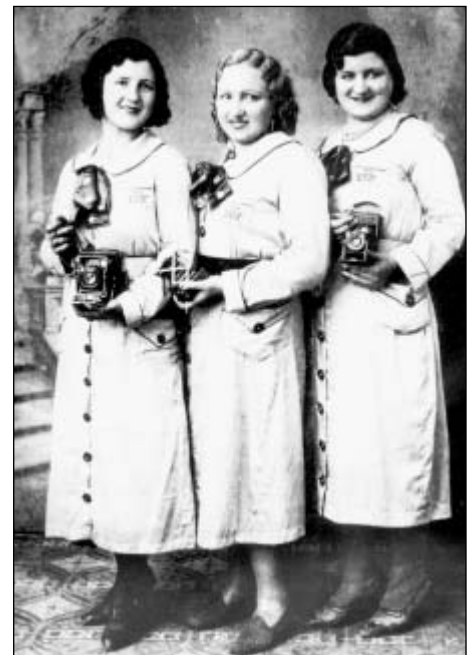
Snímek je z knihy 150 let španělské fotografie autora Publio López Mondéjara.