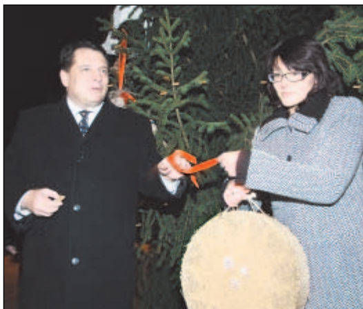
Žáci ostravských škol se zapojili do soutěže o nejkrásnější vánoční ozdobu. Čtyři nejhezčí postoupily do Prahy. Na vánoční strom před úřadem vlády je pověsil premiér Jiří Paroubek.