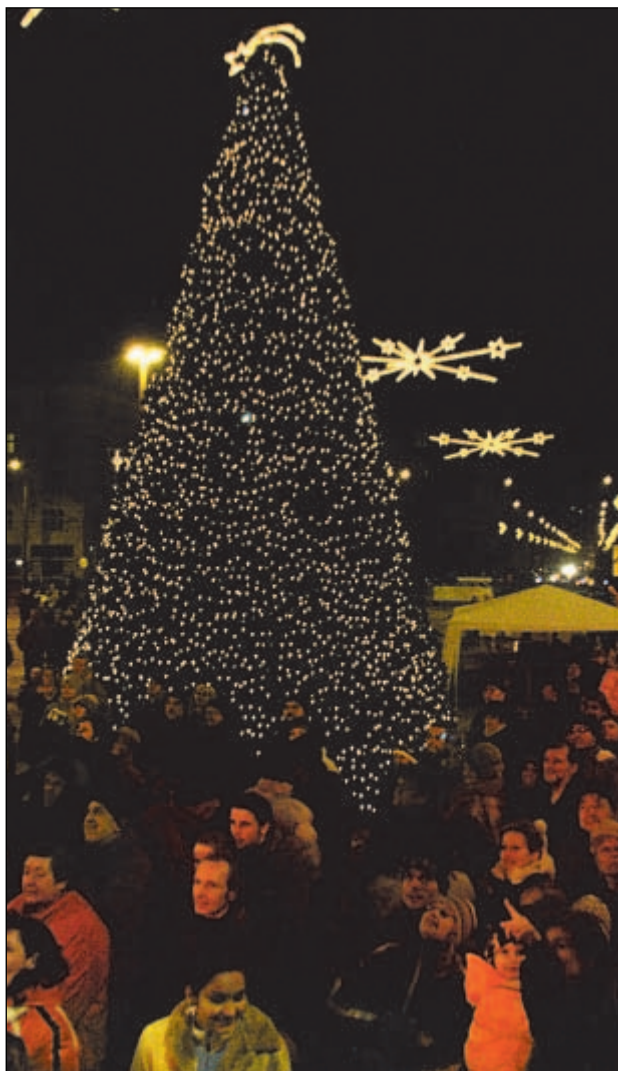
Vánoční strom se rozzářil 10. prosince v 17 hodin.

Koncert, který přilákal na Prokešovo náměstí stovky malých i dospělých Ostravanů, se uskutečnil 10. prosince v rámci akce Ostravské Vánoce 2005. Ve vstupní hale radnice se u živého stromu ověšeného ručně vyrobenými ozdobami