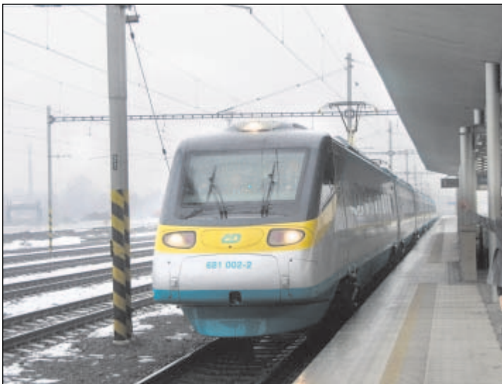
Vlaky SC Pendolino nabízejí nejrychlejší spojení mezi Ostravou a Prahou. Na trati dosahují rychlosti až 160 km/hod. zejména díky speciální technologii pro naklápění vagonů.