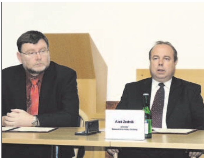
Zprava: Primátor Ostravy Aleš Zedník a primátor Opavy Zbyněk Stanjura.