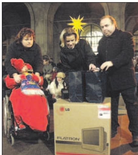
Dětem ze Speciální školy Diakonie ČCE Ostrava předal ceny primátor Aleš Zedník.