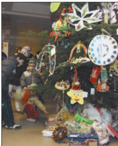
U stromku ozdobeného dětskými výtvy bylo stále živo.