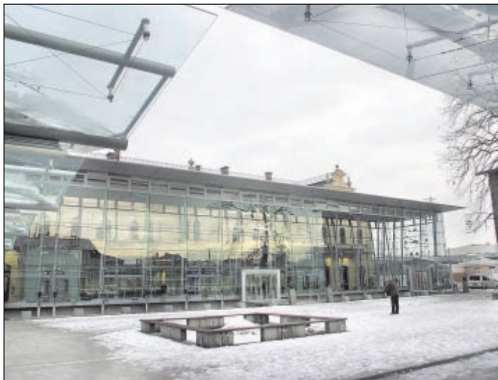
Rekonstrukce a dostavba odbavovací haly a revitalizace přednádražního prostoru železniční stanice Ostrava-Svinov si vyžádala 233 milionů Kč. Propojení se svinovskými mosty by mělo být hotovo do tří let.