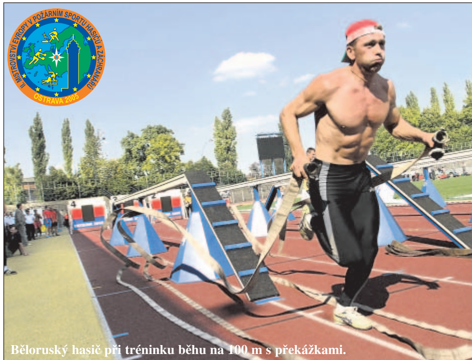
Běloruský hasič při tréninku běhu na 100 m s překážkami.

Městský stadion ve Vítkovicích se stal dějištěm významné sportovní události. Hasiči i záchranáři čtrnácti zemí světa přijeli do Ostravy bojovat o medaile, prohloubit své