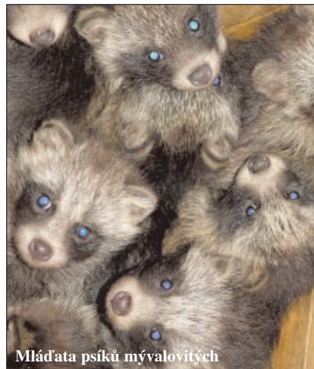
Mláďata psíků mývalovitých

„Obrovský zájem vzbudily večerní projíždky zoovláčkem. Tuto atrakci jsme tedy prodloužili do konce září. Přivítali jsme čtvrtmiliontého návštěvníka a na svět přišlo několik mláďat, z nichž se mnohá v lidské péči rozmnožují jen vzácně. Velkým úspěchem je také získání členství ve Světové asociaci zoologických zahrad a akvárií (zkráceně WAZA), které svědčí o vysoké úrovni kvality chovu včetně veterinární péče, zapojení do záchranných programů i vzdělávacích aktivit. Pevně věříme, že členství v takto prestižní organizaci napomůže rovněž k prezentaci Ostravy ve světě,“ zhodnotil končící léto S. Derlich. (k)