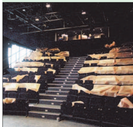
Sedadla v hledišti jsou ještě zakrytá, ale na jevišti se již zkouší nová inscenace.