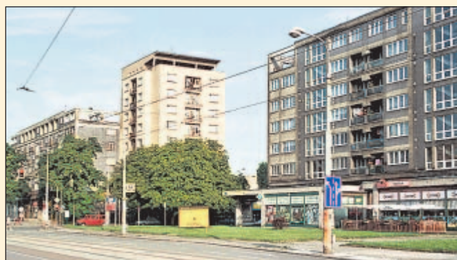
Na prostranství před lékárnou Primula a pizzerií Havana v Mariánských Horách stál dům čp. 171 – první sídlo české dvouleté obchodní školy.

Významný mezník v dějinách dvouleté obchodní školy v Mariánských Horách znamenal školní rok 1937/1938, kdy došlo k jejímu sloučení s Obchodní akademií v Moravské Ostravě, založené roku 1919. Obchodní škola se přestěhovala do budovy obchodní akademie na nároží dnešní Českosobratrské a Sokolské třídy. (M&E)