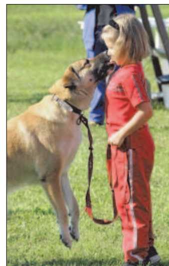
Nedílnou součástí akce policíí bylo také setkání pěstounů pejsků z útulku v Ostravě-Třebovicích.