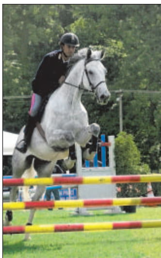
Italští policisté velmi oceňovali kvalitu závodu a schopnosti domácích koní a jezdců.