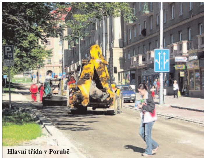
Hlavní třída v Porubě

Současně se uskutečnila také oprava Alšova náměstí. Konkrétně šlo o výměnu povrchu vozovky, předláždění pěších komunikací, zlepšení možnosti parkování a dodání laviček do jeho středové části. Náklady na úpravu pravé části Alšova náměstí dosáhly 3,4 milionu korun. Hlavní třída byla opět zprovozněna v obou směrech 3. září. (iv)