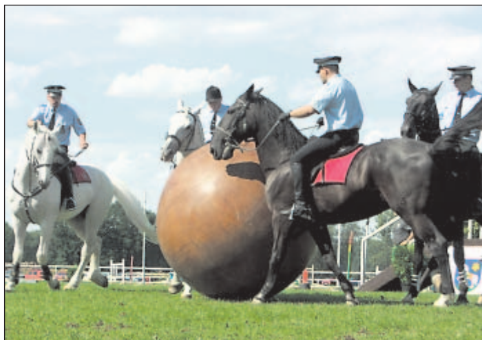
Desetiminutová ukázka pushballu dvou vraníků a dvou běloušů skončila stavem 4:0 pro vraníky.