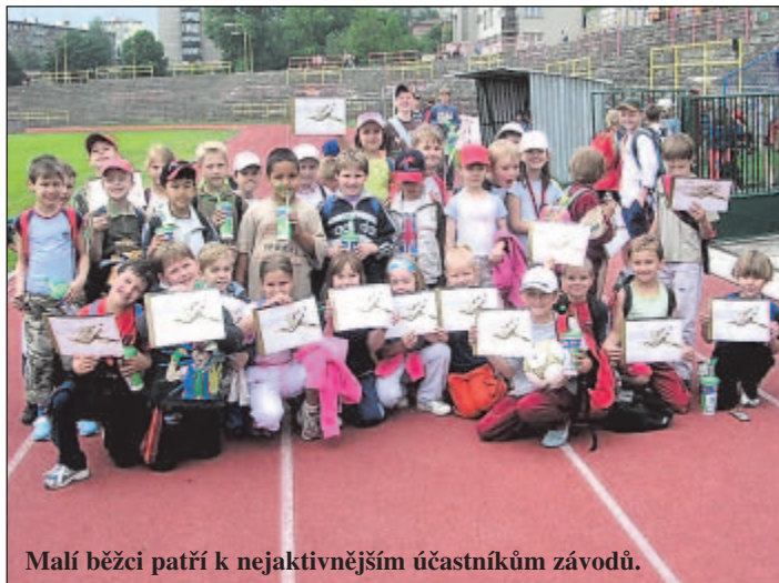
Malí běžci patří k neaktivnějším účastníkům závodu.

Poprvé v historii měli příznivci delších tratí příležitost účastnit se náročného maratonského běhu v ulicích centra Ostravy. Přibližně čtyři stovky závodníků vyrazily 4. září na šestiapůlkilometrový okruh vedený centrem města (ulice Sokolská a Komenského sady). Běžci z Česka, Polska, Slovenska i Portugalska, Ruska a Keni zdolávali čtyřicet dva kilometrů dlouhou trať za velkého zájmu přihlížejících diváků. Zvítězili všichni, kdo se zúčastnili. (k)