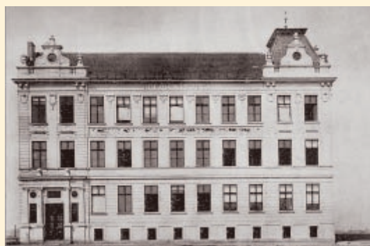
Budova obchodní školy v dnešní ulici Marie Pujmanové v Mariánských Horách, postavená v letech 1906 – 1908.