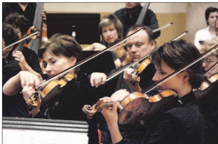
Na zahajovacím koncertu hrála díla současných skladatelů také Janáčkovy filharmonie.

Letošní ročník byl zaměřen také na tvorbu světoznámého inovátora J. Cage. Účastníci nastudovali jeho dílo Atlas Eclipticalis s Winter Music ve verzi pro čtyři klavíry. (ta)