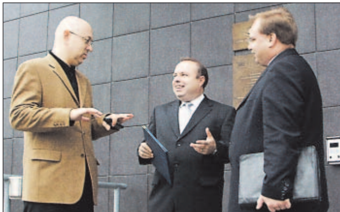
Diskuzního fóra na téma podpora malých a středních podniků v Ostravě se zúčastnili také nám. primátora V. Ruprich (vlevo), primátor A. Zedník (uprostřed) a starosta Ostravy-Poruby M. Novák (vpravo).

D iskuzní fórum na téma Podpora malých a středních podniků - konkrétní kroky k plnění jedné z priorit programového prohlášení vlády, se uskutečnilo v pondělí 8. listopadu