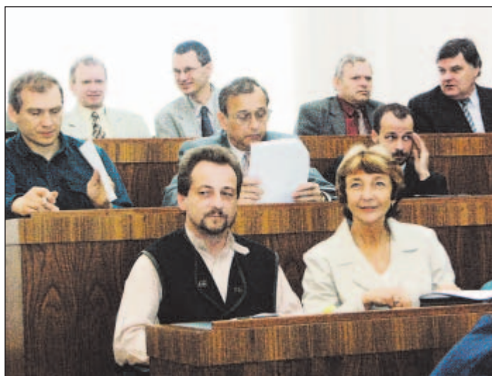
Dvoustranu připravila: M. Václavková