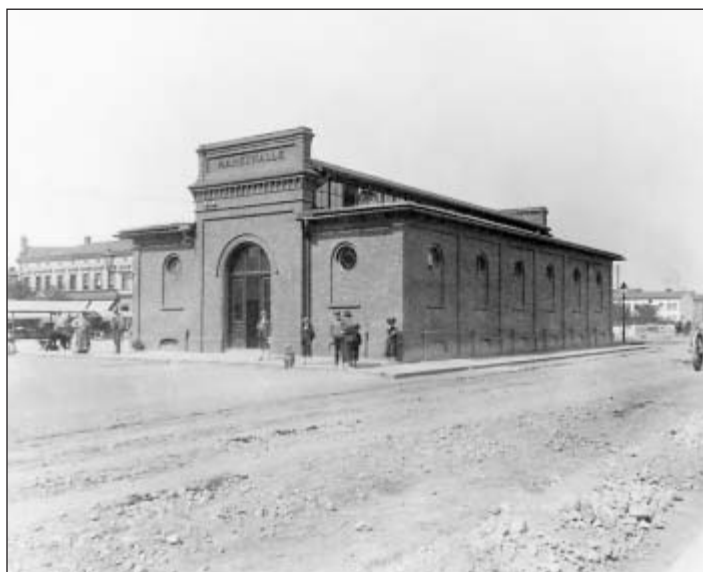
Markthalle v roce 1905 ...

„V roce 1899 byla Vítkovickými železárnami vystavěna budova další tržnice takzvané Markthalle. Později byla předána do užívání obci. Uvnitř bylo umístěno 11 otevřených prodejních míst a 5 míst sklepních. Stanoviště v této tržnici byla pronajímána drobným pěstitelům a řemeslníkům z blízkého okolí. Stavba o rozměrech 21,8 m x 12,3 m dodnes stojí mezi ulicemi Tržní, Jeremenkovou a Halašovou a od roku 1988 je památkově chráněna,“ poznamenává A. Barcuch s tím, že od starší tržnice se liší jen tím, že střední část jejího trojosého průčelí je převýšena nepřehlédnutelným tabulovitým štítem. Obě tržnice totiž byly z neomítaného červeného zdiva a měly stejnou architektonickou kompozici. (A&M)