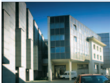
2000 - Divadlo Antonína Dvořáka