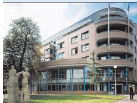
1996 - Integrovaný dům