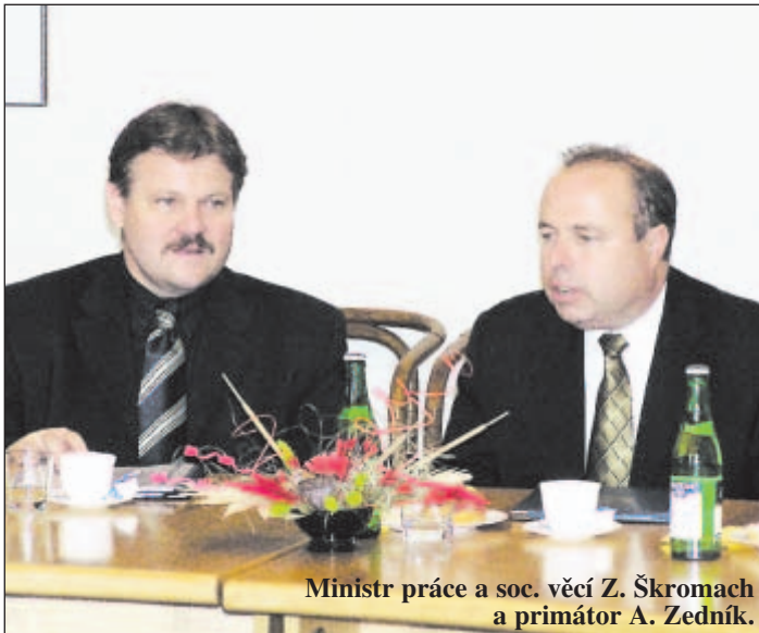
Ministr práce a soc. věcí Z. Škromach a primátor A. Zedník.

M inistr práce a sociálních věcí Zdeněk Škromach navštívil v pátek 22. října Ostravu. Při této příležitosti zavítal do Nové radnice,