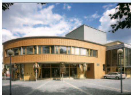
1999 - Divadlo loutek Ostrava

Deset ostravských staveb se zatím honosí titulem Dům roku. Vítězné objekty všech ročníků městské soutěže byly prezentovány na výstavě fotografií ve foyeru Nové radnice (1. až 12. 11.).