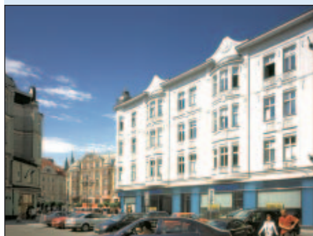
2001 - Cestovní centrum Fischer Ostrava