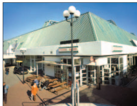
1998 - Zimní stadion Ostrava-Poruba