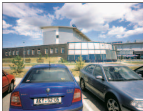
2003 - Multifunkční budova VTP