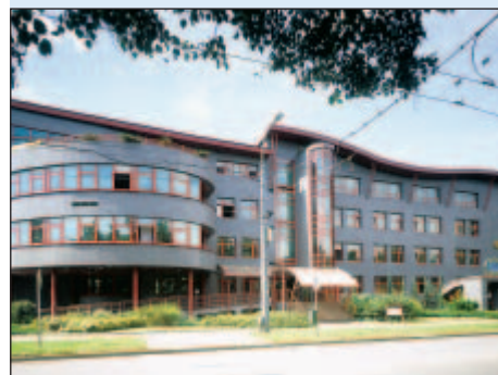
1995 - Administrativní budova ICEC s.r.o.