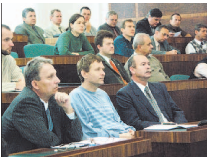
Do debaty o rozvojových otázkách města se zapojila odborná, ale i laická veřejnost.