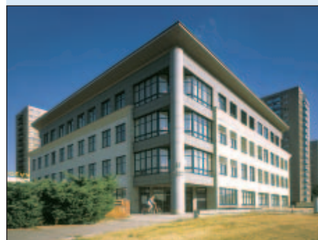
1997 - Finanční úřad Ostrava-Jih