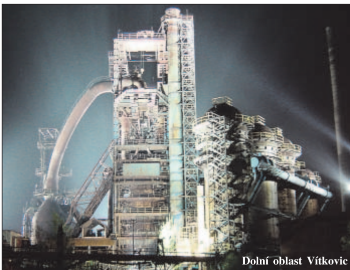
Dolní oblast Vítkovic