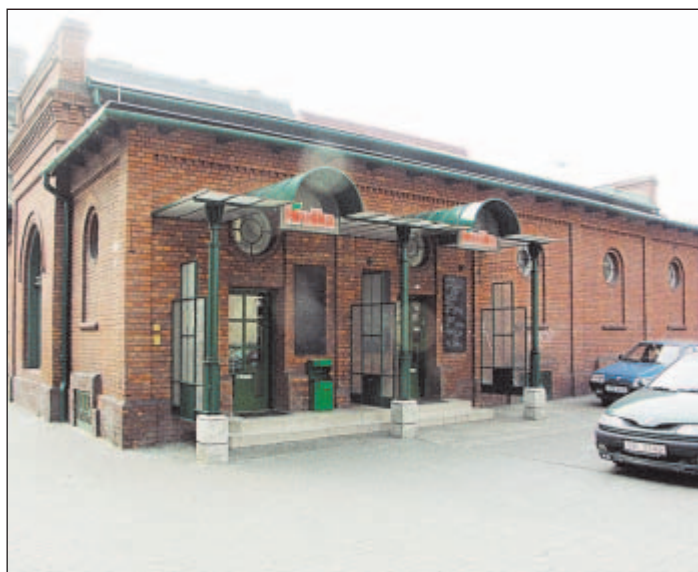
... o 99 let později.