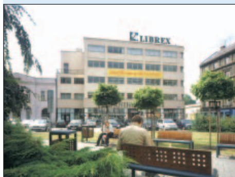
2002 - Dům knihy Librex