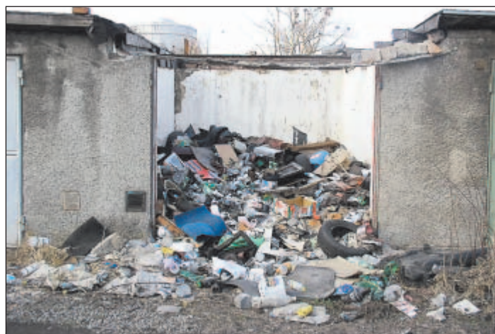
NEPROVEDENÍ POVINNÉ ÚDRŽBY STAVBY. Dochází k znehodnocení objektu, následuje výzva vlastníka ke zjednání nápravy do stanoveného termínu.