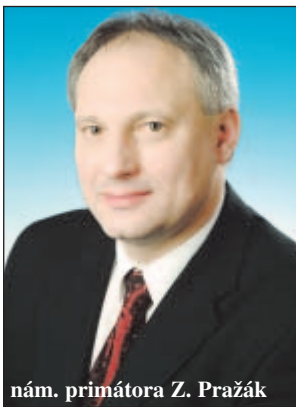
nám. primátora Z. Pražák

Výstavbu těchto dvou objektů považuji za důkaz zájmu města postarat se o ty, kteří již nemohou žít samostatně bez potřeby stálé péče a zajistit ji na úrovni moderního světa. Víím však, že to zdaleka není všechno, co ještě pro seniory můžeme udělat. Naši snahou je zejména usilovat o rozšíření a zkvalitnění terénních služeb, aby lidé mohli pokud možno co nejdéle žít ve svém vlastním domácím prostředí, ale to už je jiné téma, na které se však do budoucna rovněž připravujeme.“ (k)