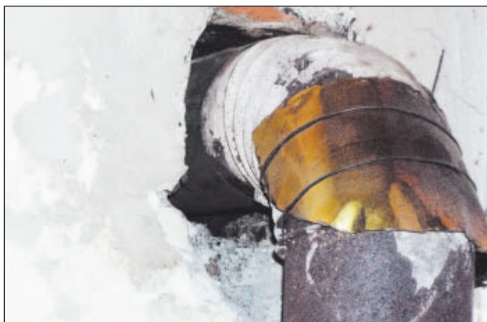
NEPOVOLENÁ STAVEBNÍ ÚPRAVA. Takový postup ohrožuje životy a zdraví osob. Stavební policie uvědomí vlastníka objektu a provede výzvu státního stavebního dohledu k okamžitému odstranění závad.