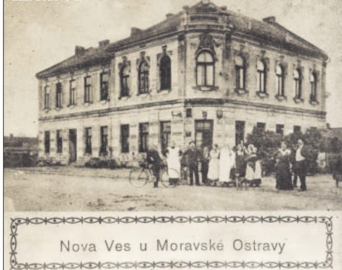
Nova Ves u Moravské Ostravy