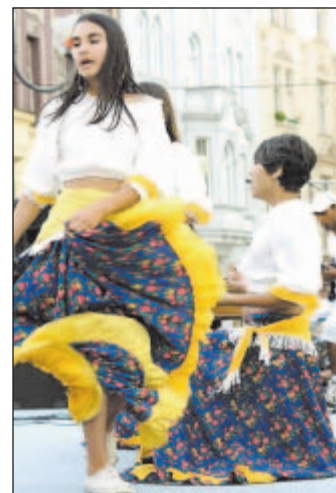
Sympatie diváků patřily romskému souboru Oktava - Ochoť.

„Myslím si, že letošní ročník se opravdu povedl, vystoupila řada českých souborů, ale také národnostních menšin. A divákům vůbec