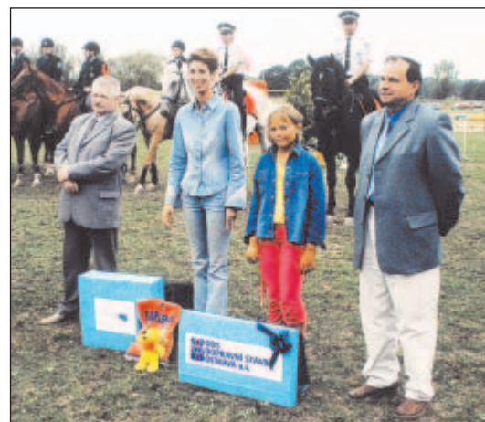
Pro výherce výtvarné soutěže Ostravský kůň očima dětí věnovaly ceny kancelář primátora, Severomoravské vodovody a kanalizace a.s., ODS-Dopravní stavby Ostrava a.s. a HARIBO CZ s.r.o.