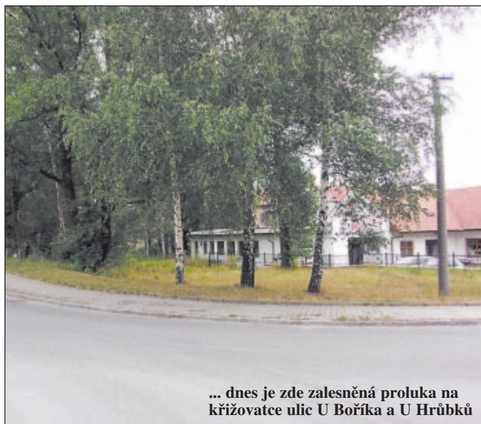
... dnes je zde zalesněná proluka na křižovatce ulic U Boříka a U Hrubků