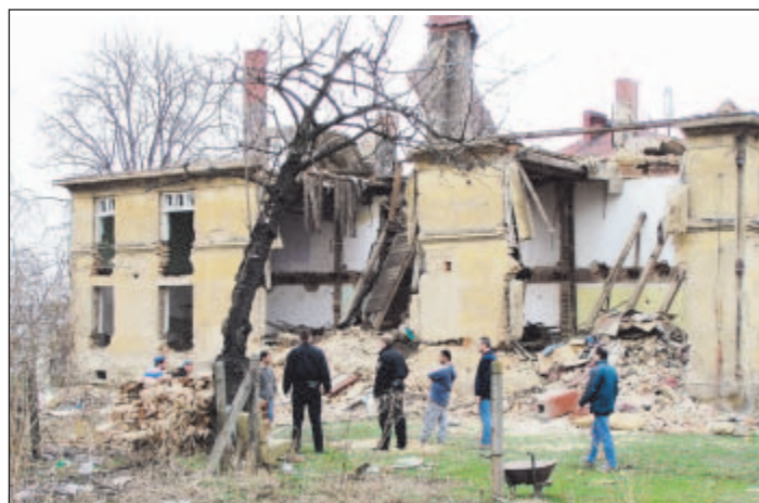
BEZPŘÍSTĚRNÉ OHROŽENÍ OKOLÍ, ŽIVOTŮ A ZDRAVÍ OSOB. Stavební policie provede zajištění okolí stavby a dá podnět příslušnému stavebnímu úřadu k vydání rozhodnutí o odstranění stavby (nebo nezbytných stavebních úprav).