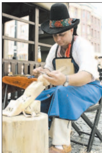
Festival doprovázel na Jiráskově náměstí Jarmark lidových řemesel.