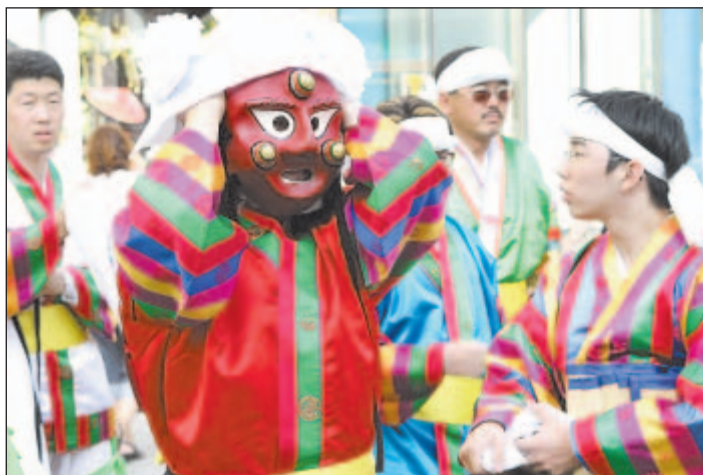
Masky s démonickým výrazem používali v Koreji při svých obřadech šamani.