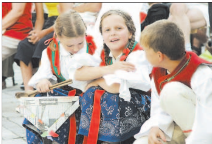
Lidové umění má své nadšence i mezi nejmladší generací.