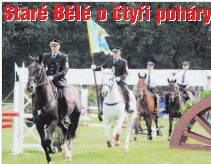
Slavnostního nástupu se zúčastnili všichni soutěžící.

Pořadatelé přichystali pro návštěvníky bohatý doprovodný program s ukázkami z výcviku strážníků. Představili se v něm členové kynologického oddílu MPO, na děti čekaly zajímavé soutěže, lákadlem se stala laserová střelnice i výstava automobilových veteránů. Součástí akce bylo již 6. setkání pěstounů psů z útulku v Ostravě-Třebovicích, spravovaného Městskou policií Ostrava. Sedmáct pejsků bojovalo o několik titulů, například o Ostravského šikulu nebo o Nejlepší psí kousek. (ta)