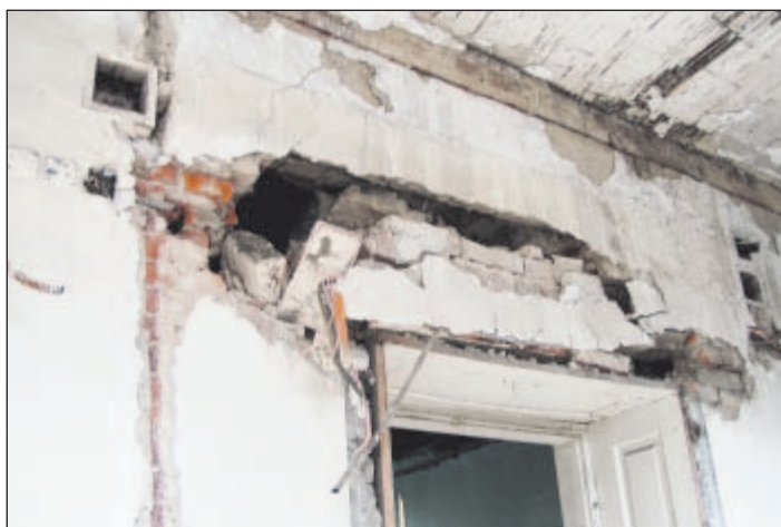
NARUŠENÍ STATIKY OBJEKTU. Stavební policie provede výzvu vlastníkovu stavby k jejímu zabezpečení.