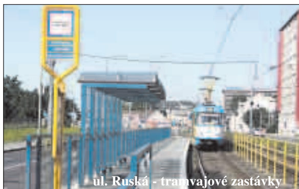
ul. Ruská - tramvajové zastávky