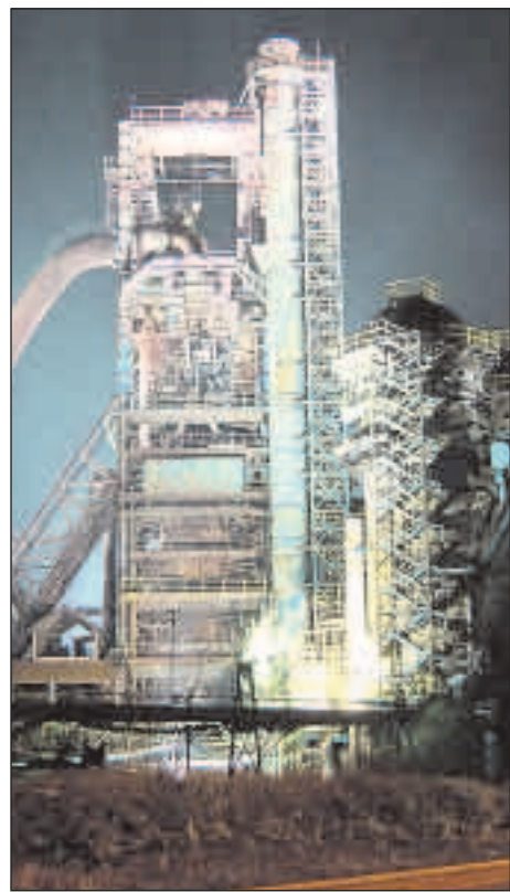
Nevšední pohled na osvětlené tony železa vysoké pece v dolní oblasti Vítkovic v době konání světového šampionátu v ledním hokeji všem učeňoval - reflektory se rozsvěcují každý večer.

Podíl Ostravy na celkovém počtu turistů (domácích i zahraničních) v Moravskoslezském kraji (dále jen MSK) se v posledních 4 letech pohybuje mezi 15 - 20 %. Podíl MSK na celkovém počtu lůžek v ubytovacích kapacitách v ČR se pohybuje mezi 6 - 7 %, podíl Ostravy na celkovém počtu lůžek v kraji je přibližně 9 %, tj. přibližně 0,6 % všech lůžek v ČR. Pokud se týká využití kapacit pokojů, za MSK se pohybuje mezi 48 % - 50 %, v Ostravě je to kolem 40 %, což je pod republikovým průměrem. Ten je na úrovni asi 50 %.