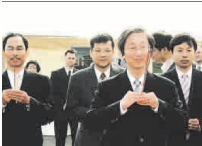
Představitelé firmy ASUSTeK zahájili stavbu podle staré čínské tradice.