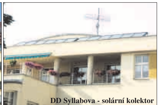
DD Syllabova - solární kolektor