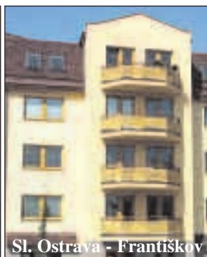
Sl. Ostrava - Františkov