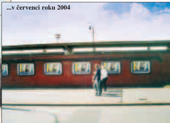
...v červenci roku 2004