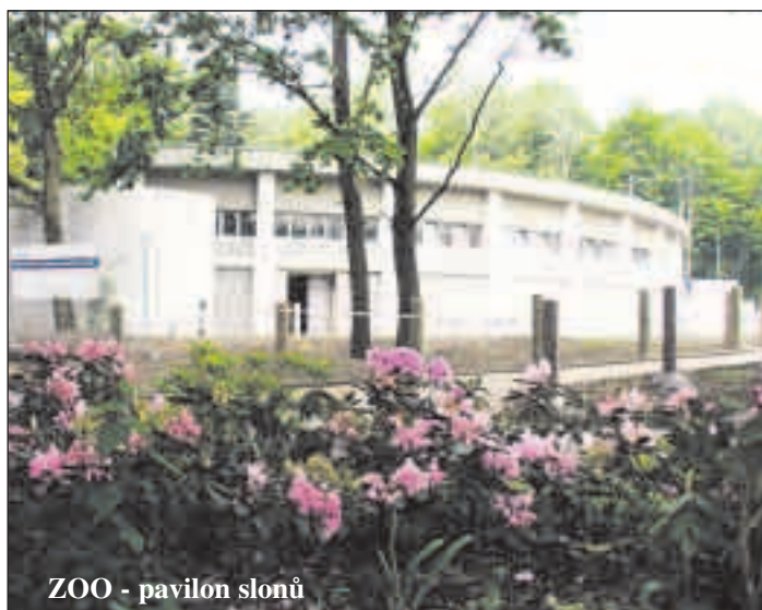
ZOO - pavilon slonů