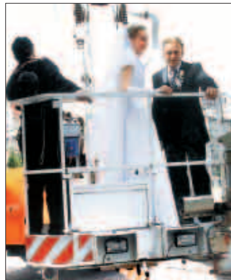
Svatební páry si zatančily na pódiu, poslechly písně Petry Janů a hasiči je na plošině zvedli vysoko nad Prokešovo náměstí.