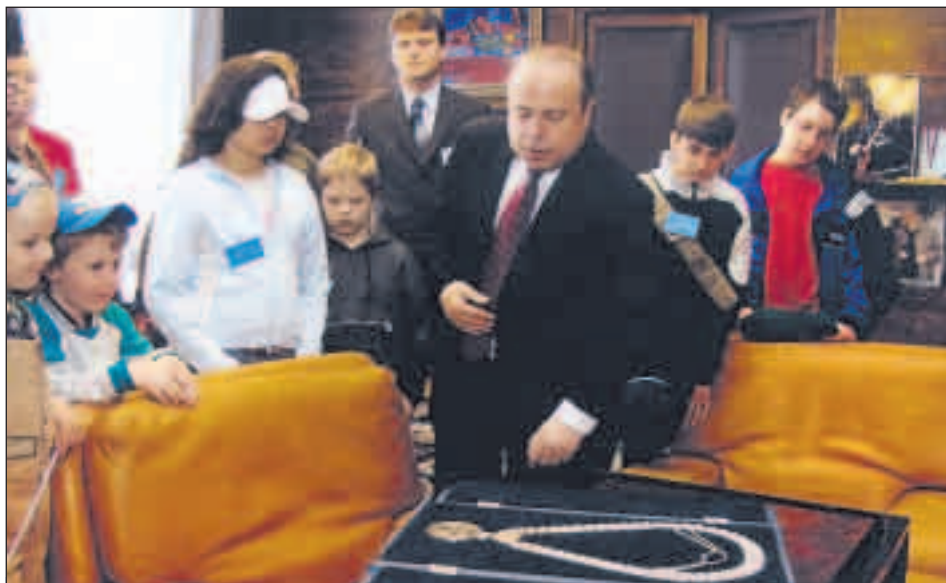
Kancelář primátora a další reprezentativní místnosti si se zájmem prohlédlo během pátku 14. a soboty 15. května téměř 2 tisíce návštěvníků.