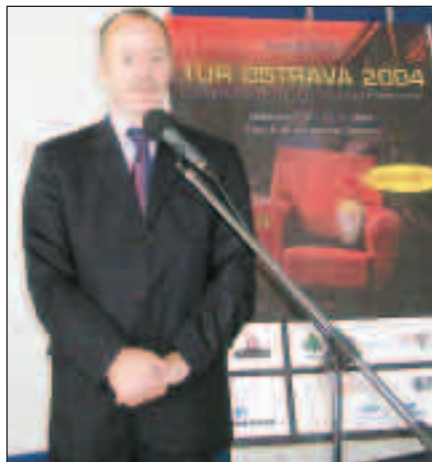
Festival zhodnotil nám. primátora M. Jašurek.

Hlavní cenu mezinárodního festivalu filmů o trvale udržitelném rozvoji Grand prix TUR Ostrava 2004, kterou udělil ostravský primátor Aleš Zedník, získal snímek Spojených států amerických Cena za to, že jsi cool. Primátor předal cenu po skončení festivalu 21. května zástupcům amerického kulturního institutu.