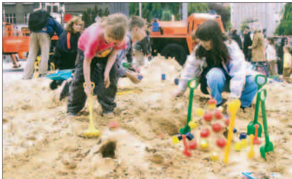
Šedesát tun písku a plastové hračky věnovala dětem společnost Štěrkovny Dolní Benešov.

Policie ČR připravila v rámci programu mimo jiné vědomostní soutěže. Spokojeni byli opravdu i ti nejmenší (viz snímek). Ve vstupní hale radnice si občané mohli vyzkoušet laserový trezážer střelby. Na náměstí před radnicí pak mohli zhlédnout ukázky sebeobraných technik strážníků městské policie a výcviku služebních psů.