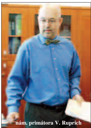
nám. primátora V. Ruprich

„Cílem města samozřejmě je, aby tady byly výroby vykazující vyšší přídavnou hodnotu. Máme zájem, aby do Ostravy nepřicházely jen montážní