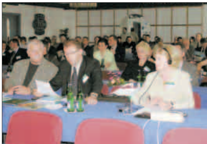
Na konferenci se sjeli odborníci z České republiky, Maďarska, Polska, Rakouska a Slovenska.

Náklady na výstavbu CEZKO činí dvě miliardy korun. „Postaveno by mělo být do roku 2008 až 2009. Bude však podrobena velmi přísnému procesu posuzování vlivu na životní prostředí všemi zainteresovanými složkami včetně občanů. Projednávání může termín výstavby prodloužit,“ poznamenal náměstek primátora a dodal: „V Evropě funguje podobných typů spaloven kolem sto šedesáti. Je to ověřená technologie, při níž dochází k minimálnímu znečištění ovzduší. Navíc spalování komunálního odpadu je k životnímu prostředí daleko šetrnější než jeho ukládání na skládky.“ (ta)