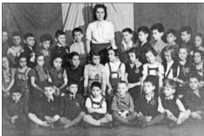
Žáci školy v roce 1941

V pozdějších letech budova sloužila k dalšímu vzdělávání obyvatel Ostravy, sídlila tu jazyková škola. Na jaře roku 1991 byl značně zchátralý objekt v rámci opravy ulice Pivovarské demolován. (M & B)