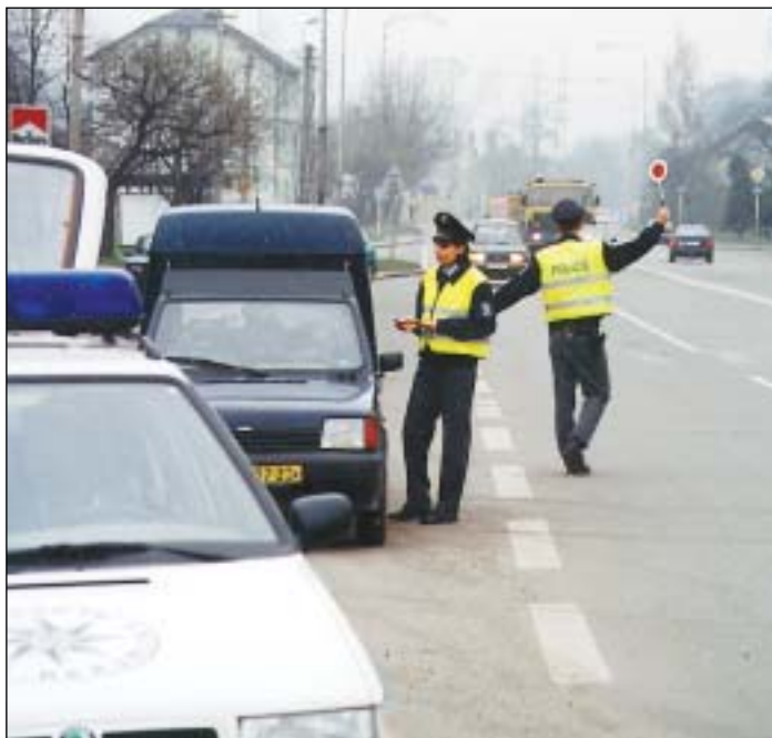
„Dobrý den, pane řidiči. Silniční kontrola, předložte vaše doklady...“

toven jiné osobě, která se prokáže ověřenou plnou mocí.