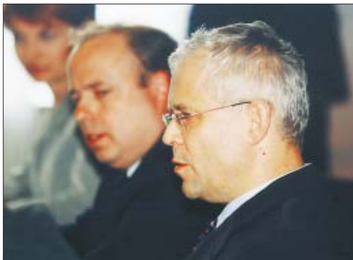
DÁLNIČNÍ D47. „Dálnice bude postavena o rok dříve a o čtyřicet miliard levněji,“ oznámil 31. března premiér Vladimír Špidla v zasedací místnosti rady města jen několik hodin po rozhodnutí české vlády, která definitivně vypověděla smlouvu s konsorciem v čele s izraelskou společností Housing & Construction. Právě to mělo dálnici z Lípnicka do Ostravy postavit za 125 miliard korun a provozovat 30 let. „Stát nasadí lidi a peníze v takové míře, která umožní dálnici dokončit do roku 2008,“ řekl ministerský předseda v Ostravě. (Pokračování na str. 5)

Rozvoj brownfields není jediným klíčem k ekonomickému růstu, ale spíše je to jedna z jeho hlavních složek, která musí být vždy vnímána jako perspektivní a prioritní. Na závěr prezentace výsledků srovnávací studie přístupů řešení revitalizace brownfields bylo podepsáno memorandum mezi univerzitami spolupracujících měst. (M)