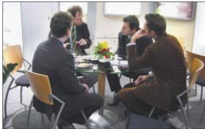
V ostravském stánku se živě diskutovalo a intenzivně jednalo.