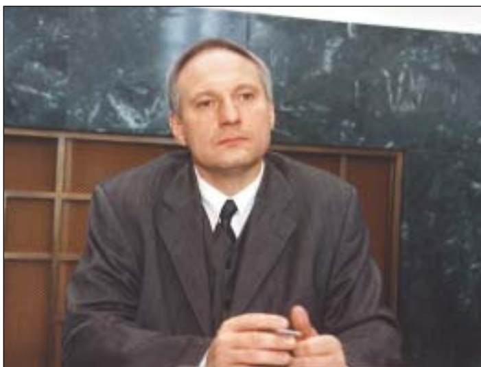
Zbyněk Pražák (KDU-ČSL) zodpovědný za úsek: kultury a vzdělanosti, sociálních věcí a zdravotnictví, školství, mládeže a tělovýchovy.