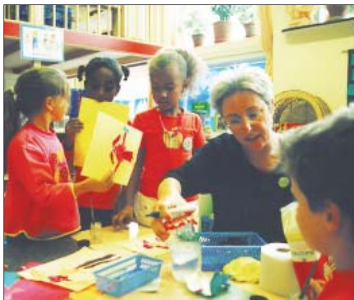
Součástí mezinárodního projektu byly také výměnné stáže. Snímek pochází z návštěvy komunitní základní školy v holandském Eindhovenu.

rozvoje, téměř sto procentní nezaměstnaností, nejistou budoucností a tím pádem i nedostatkem motivace něco změnit. Lidé z komunitních center ovšem realizací svých aktivit dokazují, že také oni mohou vlastními silami něco dokázat. Výsledky pilotního projektu mohou pomoci zvýšit zainteresovanost rodičů na vzdělávání dětí a posílit jejich sebedůvěru. Posun myšlení tímto směrem je prvním krokem na cestě ze začarovaného kruhu, ve kterém se nyní nacházíme,“ dodala I. Štegmánová. Tomuto cíli by mohla napomoci také další část projektu - informační brožura pro veřejnost, která vyjde v příštím roce. (LO)